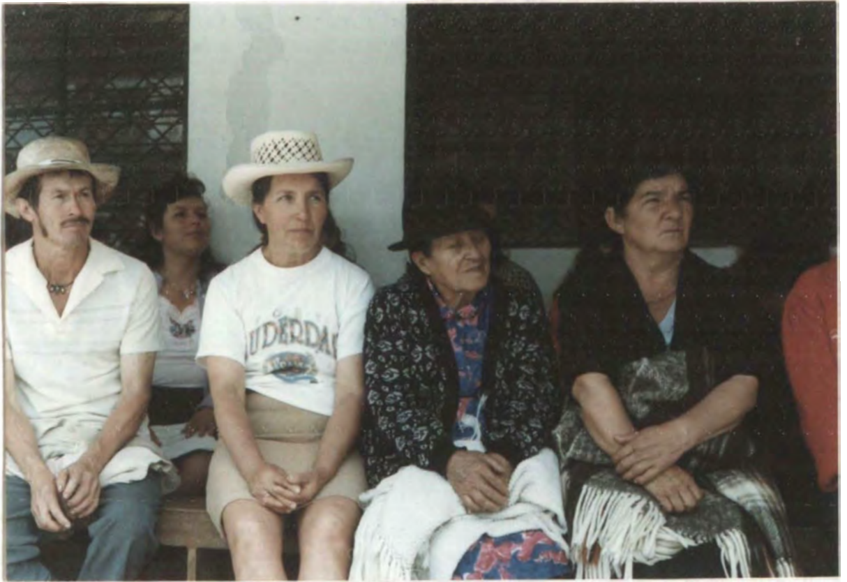
PROYECTO: LA CAPILLA CREATIVA PROGRAMA: ORGANIZACIÓN COMUNITARI OBJETIVO: MÓDULO DE ECONOMÍA LUGAR: SALA DE LA ESCUELA DE PALA ABAJO FECHA: 9 DE JULIO DE 1996