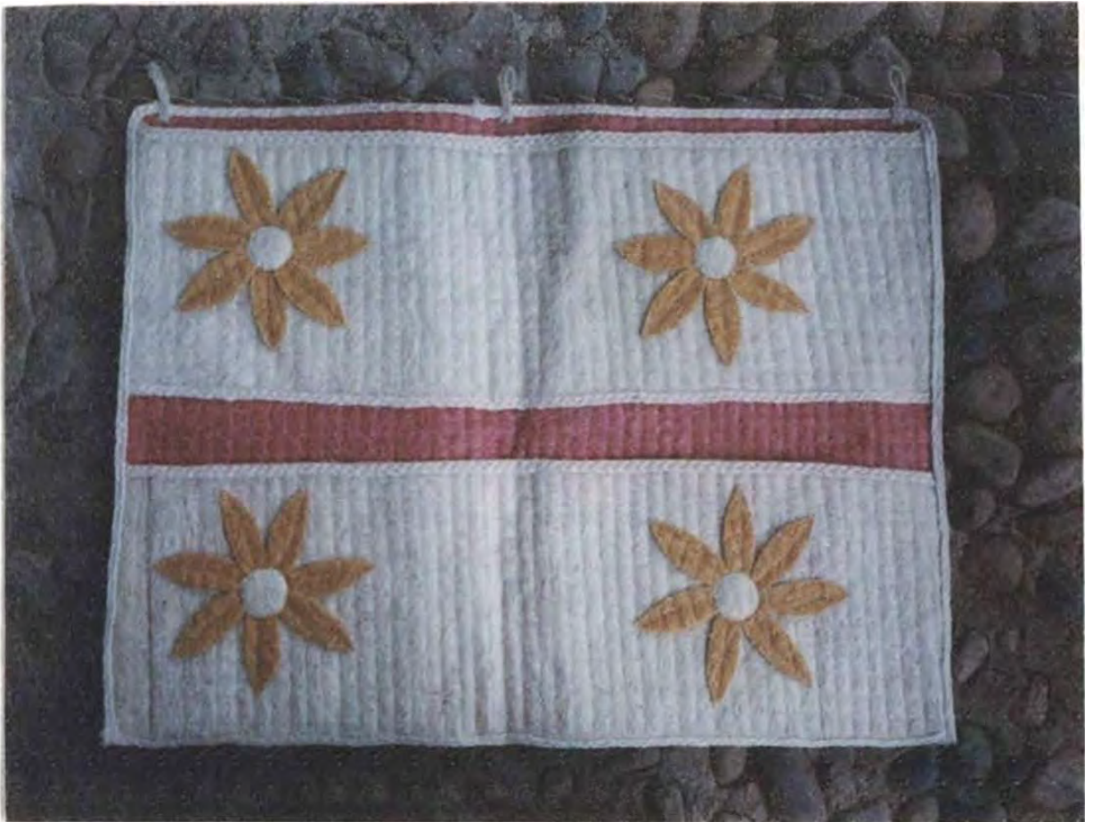
Pieza artesanal ——— zapateros