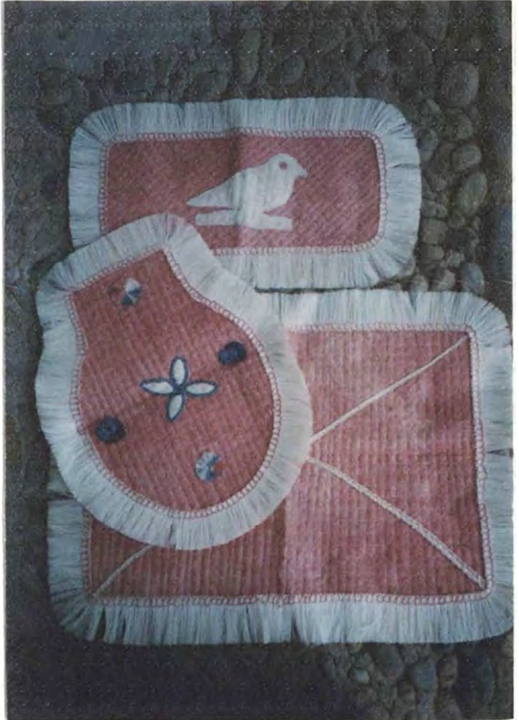
Pieza artesanal — juegos de baño