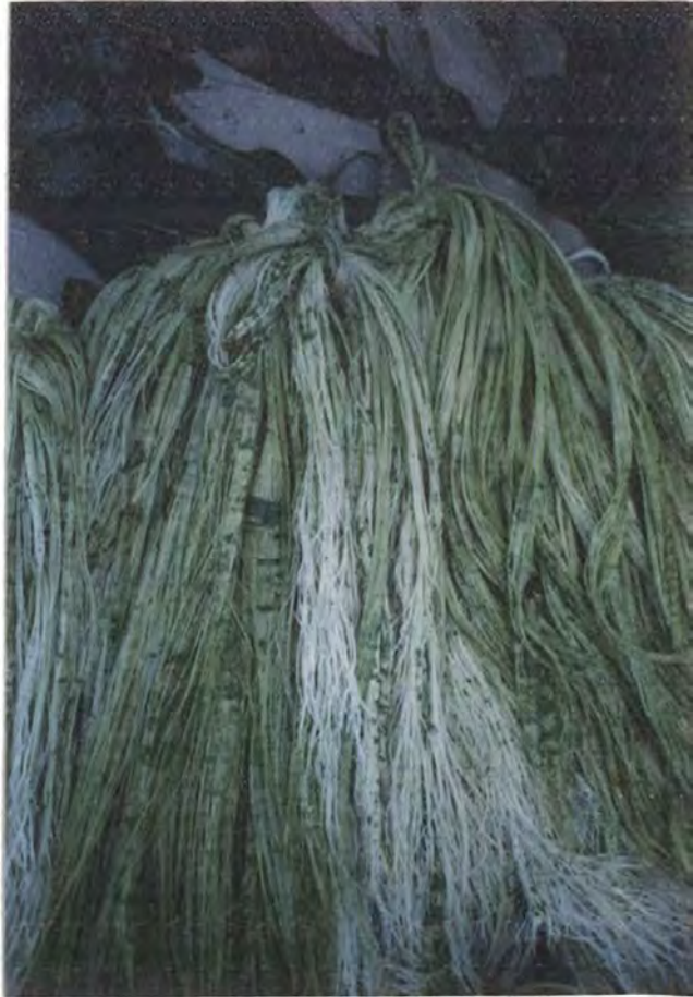
Materia prima procesamiento