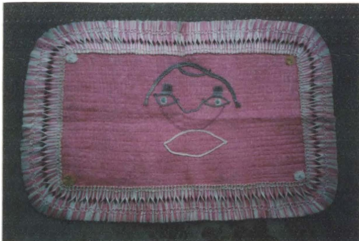
Pieza artesanal ——— tapetes - pié de cama