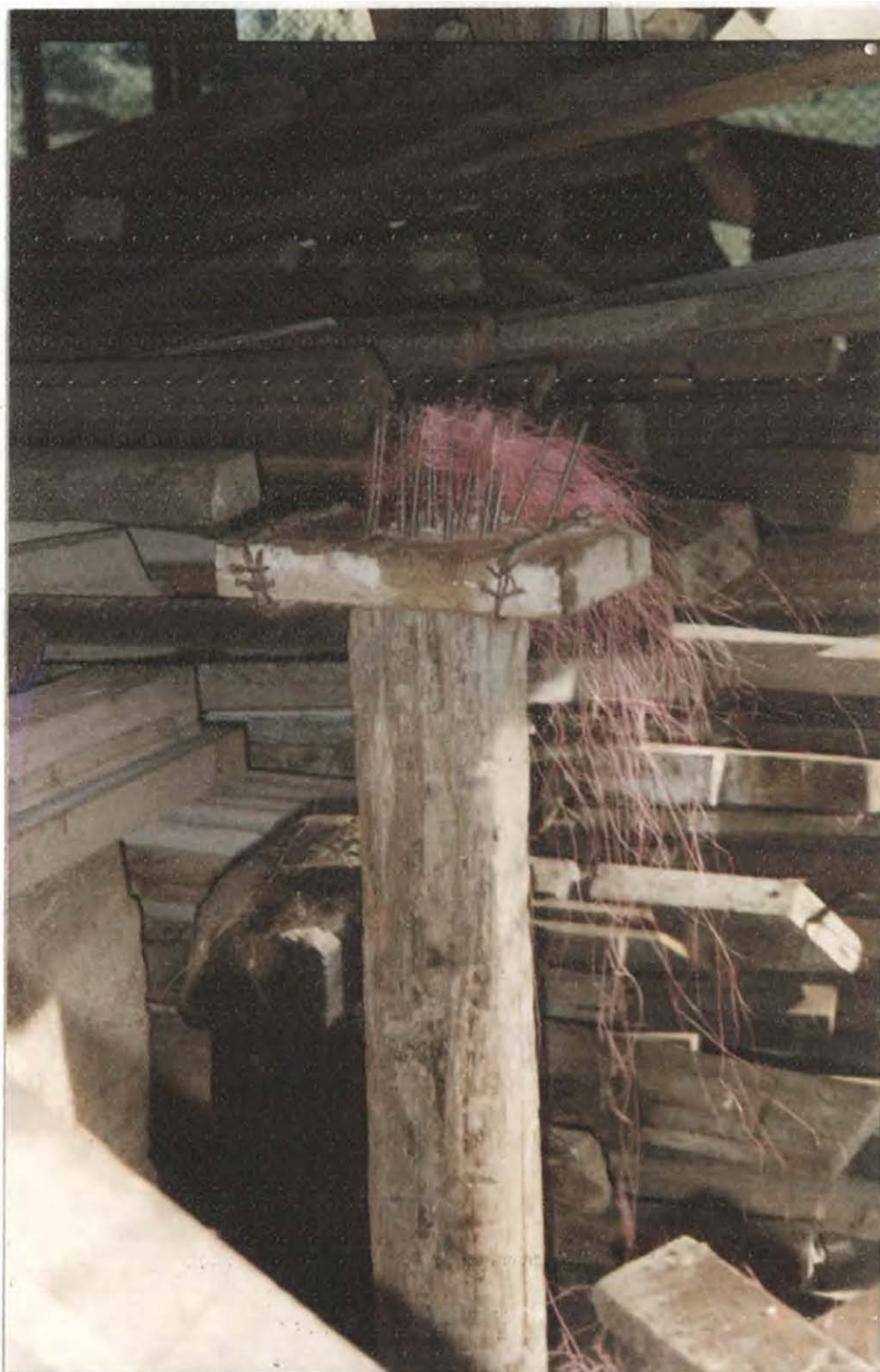
La técnica peinador de puntillas