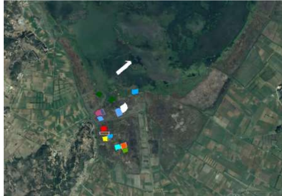
Imágenes Satelitales Landsat Modificada. Ubicación de zonas de Aprovechamiento. Fúquene (C/marca).