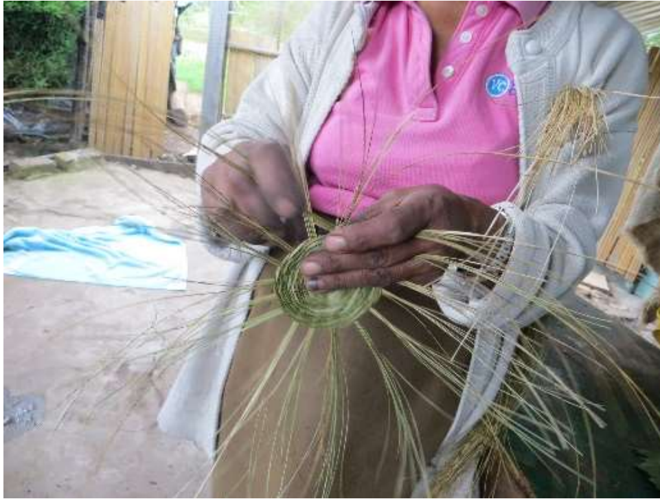
Foto 1. Tejido en Uche

Con el acompañamiento de artesana del Municipio de Cerinza (Boyacá), se realiza trabajo artesanal. Es de anotar que la fibra del uche, es más delgada si se compara con la fibra del esparto.