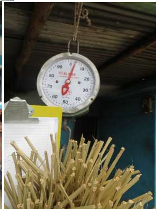
Elaboración de Sombrero de Iraca - Floración de Iraca - Pesaje de Fibras de Palma Iraca – Vereda Cimarronas. Colón – Nariño.