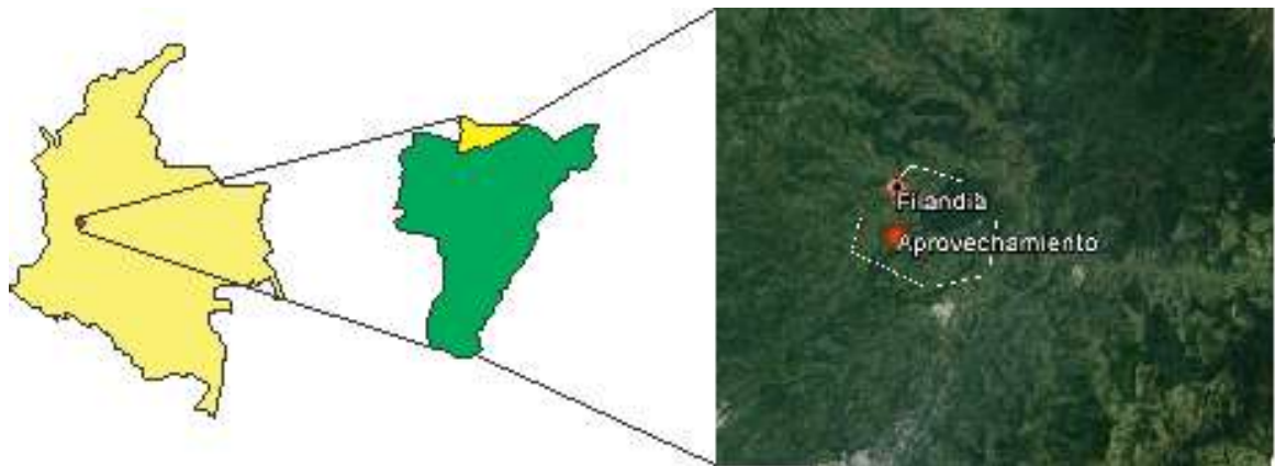
Imagen Satelital Landsat Modificada. Ubicación de zonas de Aprovechamiento Filandia (Quindío).

Son visitados predios de carácter público, en donde colectores, han realizado el aprovechamiento de las especies Tripeperro ( Philodendron longirrhizum ) y chusco ( Chusquea sp ), entre otros. Son tomadas muestras de tres especies, que son señaladas por artesanos, como las utilizadas en la actividad artesanal, estas son llevadas a Herbario de la Universidad Nacional, para su identificación.