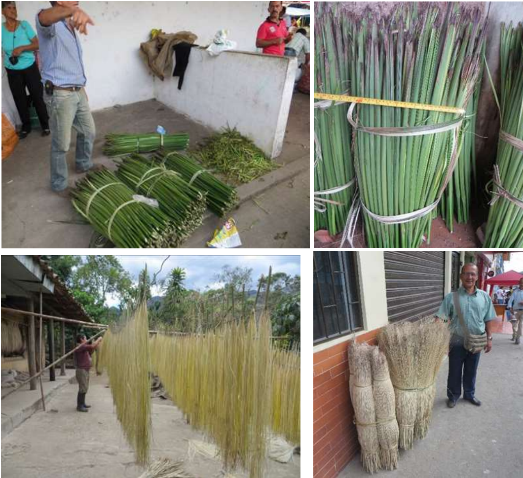
Preparación, transporte y comercialización de cogollos de Palma Iraca. Linares – Nariño