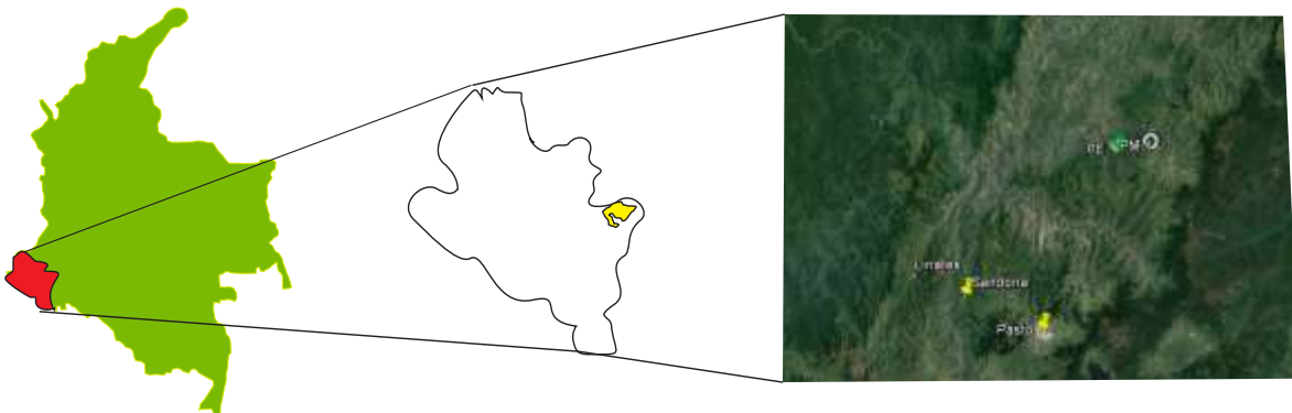
Imagen Satelital Landsat Modificada. Ubicación de Municipios Colón, Linares, Sandoná (Nariño).

Se realiza la identificación de especie en herbario de la Universidad Nacional. Para realizar una aproximación de la oferta natural de la palma de iraca, en el Municipio de Colón, se toman datos de los atributos de la especie, en seis (06) predios ubicados en las veredas Cimarronas, La Playa /Placer y Las Lajas, se realizó el respectivo registro de información en tablas, en donde se consigna información de Ubicación, área, altura de individuos vegetales, número de hojas, número de colinos, Número de cogollos, Número de Cogollos de corte y diámetro de corte.