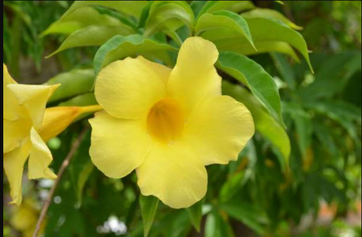
Flor de Campana