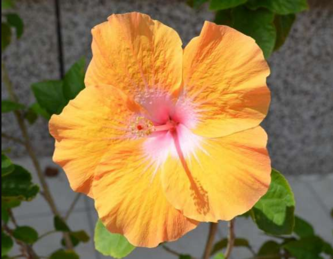
Flor de la Cayena