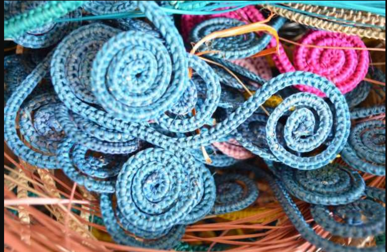
Caracoles en Iraca