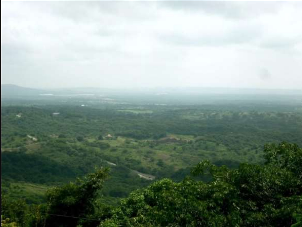
Montañas de Tubará.