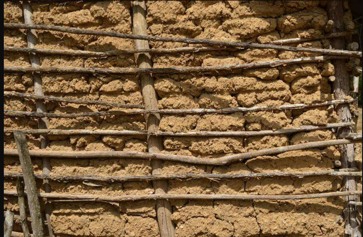
Casas de bahareque.