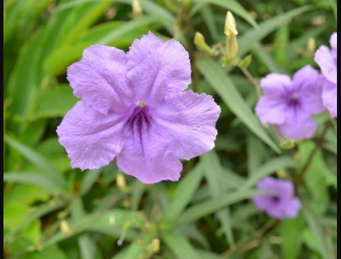
Flor de Campana