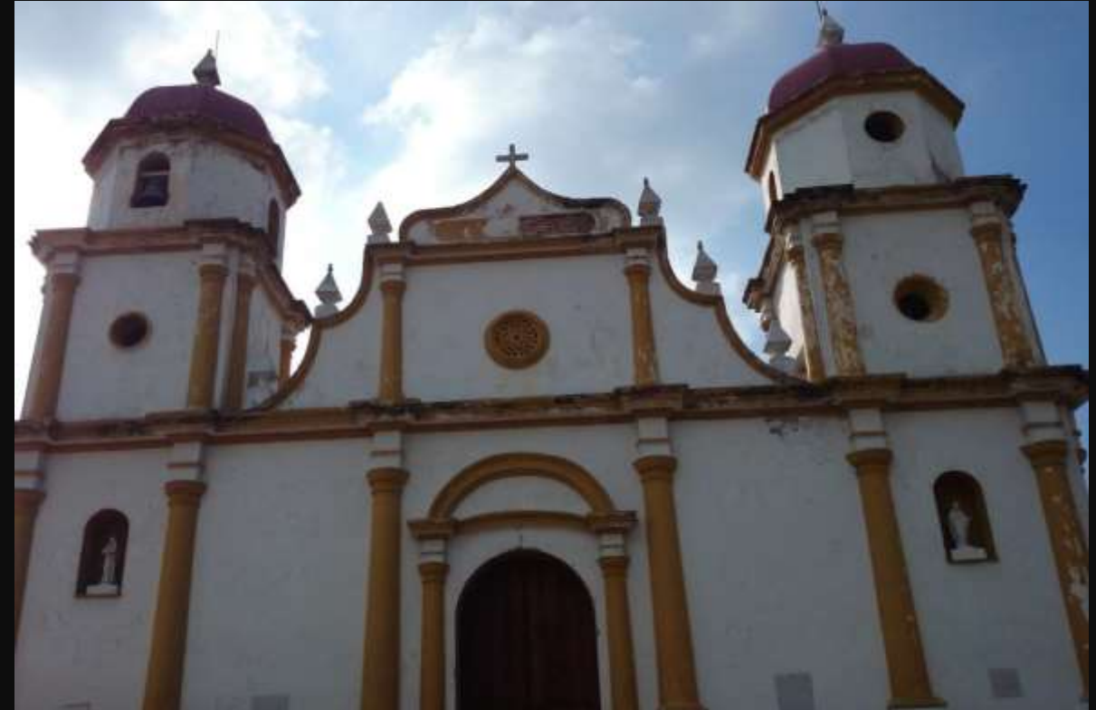
Iglesia de San Antonio de Padua Soledad