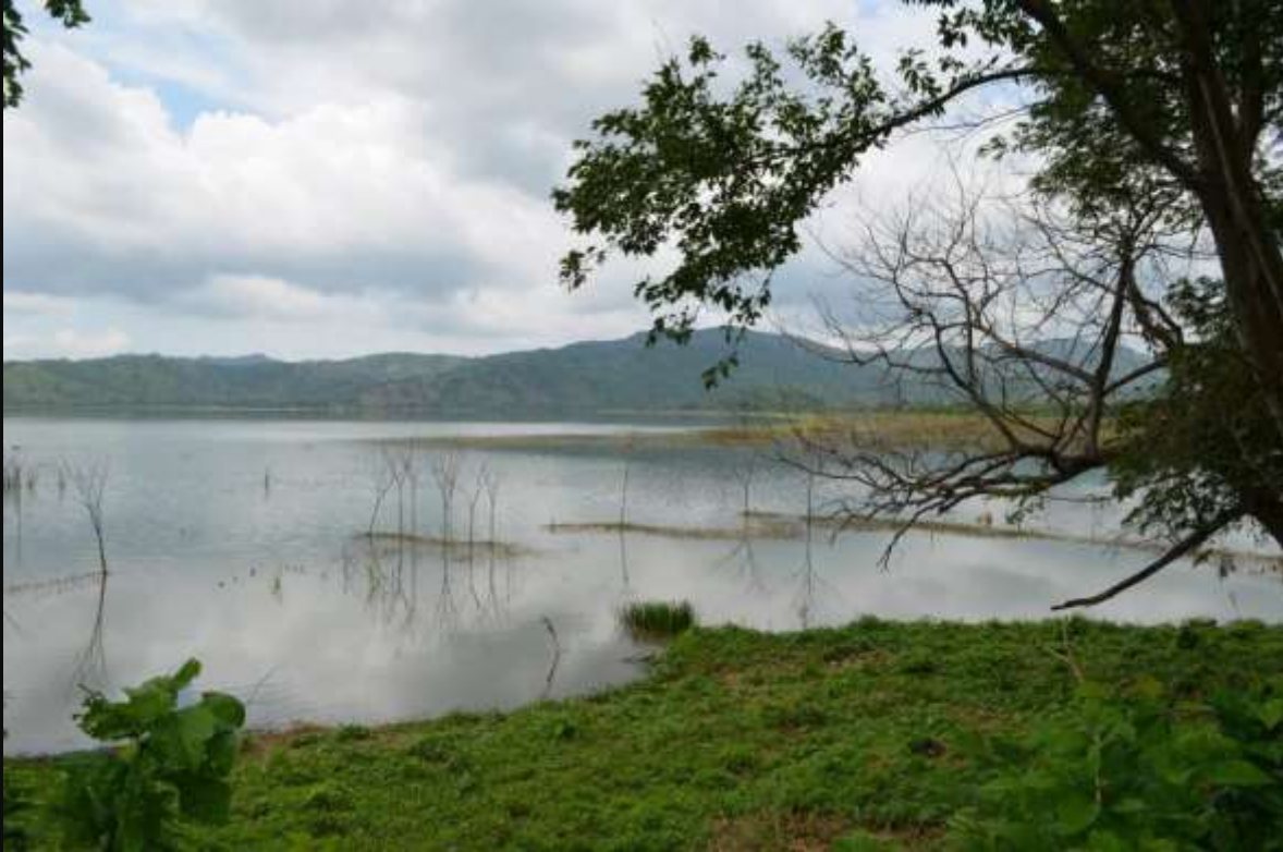
Laguna de Luruaco, Luruaco.