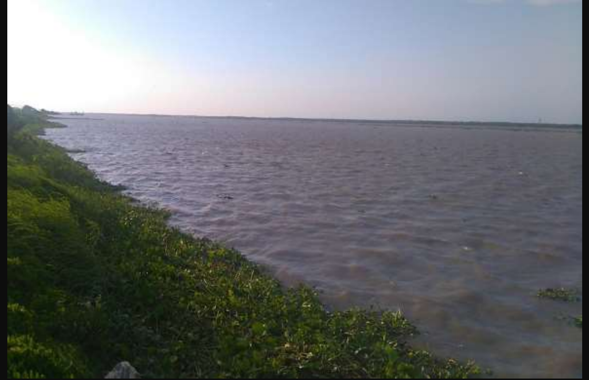
Río Magdalena, Barranquilla