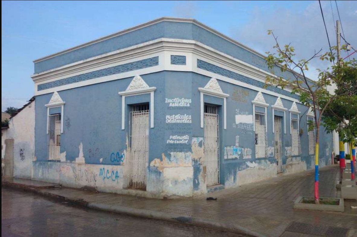
Arquitectura casas tradicionales Soledad