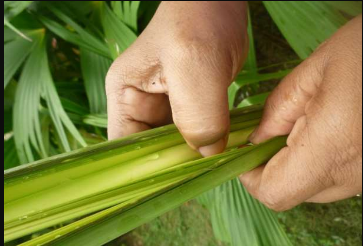
Proceso de ripeado de la palma.