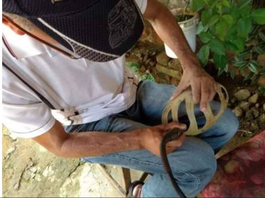
CALADO CON MOTORTOOL