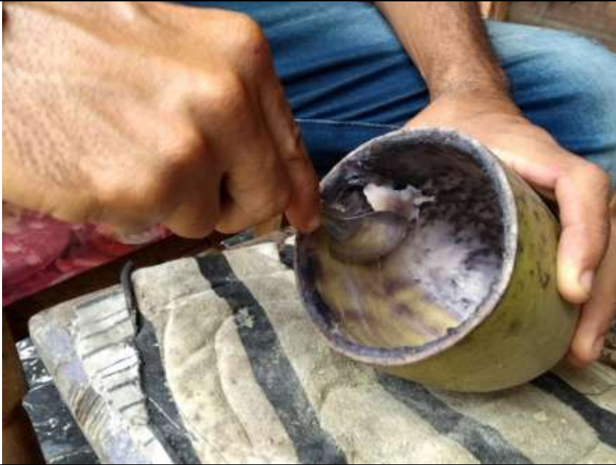
PROCESO DE DESPULPADO