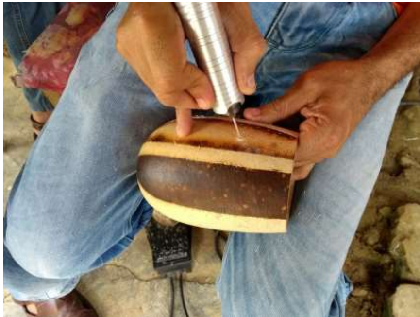
PERFORADO CON MOTORTOOL