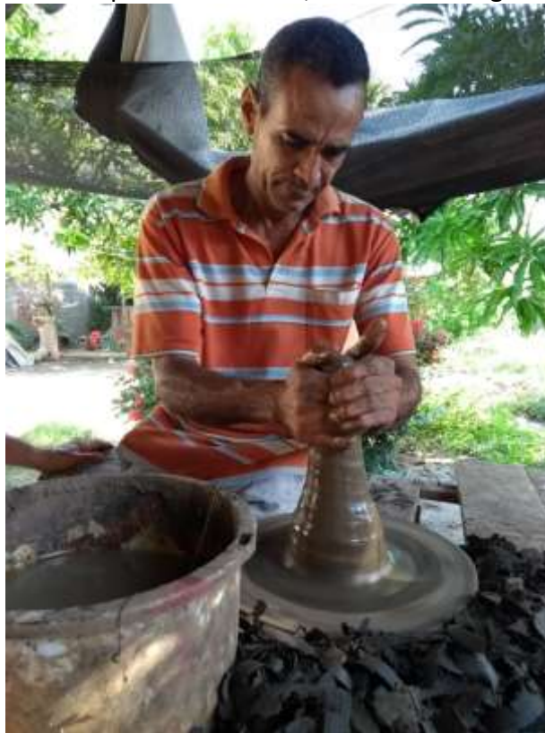
Torneado. Ponedera, Atlántico.