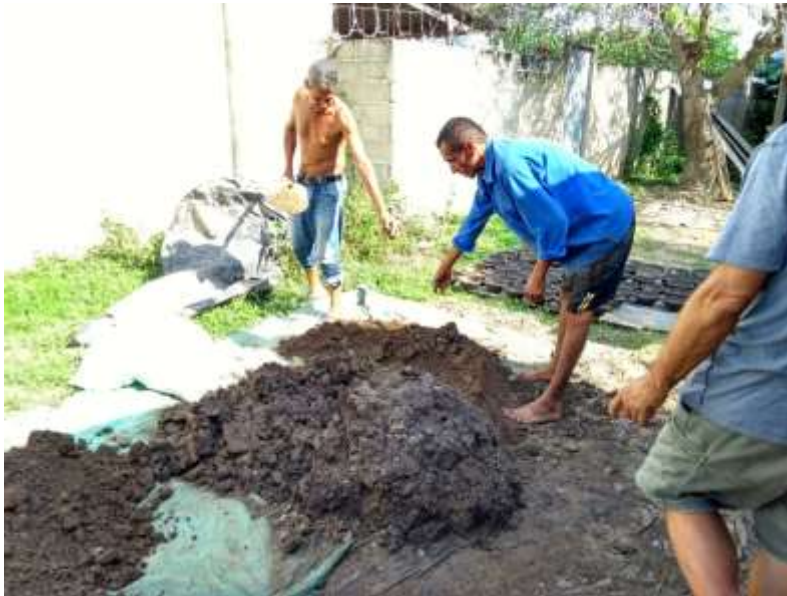
Preparación de la materia prima. Ponedera, Atlántico.