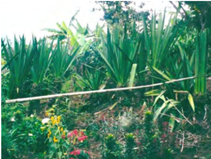
No 3 19,20,03,23 Tejidos con aguja de crochet V. CHISQUIO- CAUCA pencas de fique