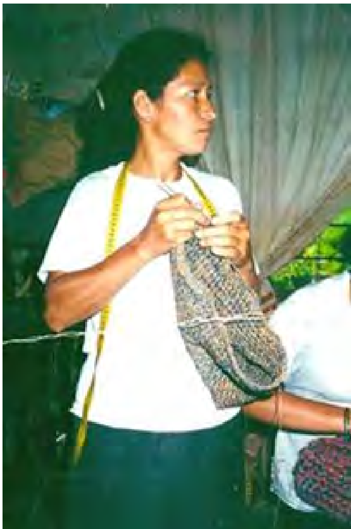
No 7 19,20,07,23 Tejidos con aguja de crochet V. CHISQUÍO-CAUCA Elaboración mochila