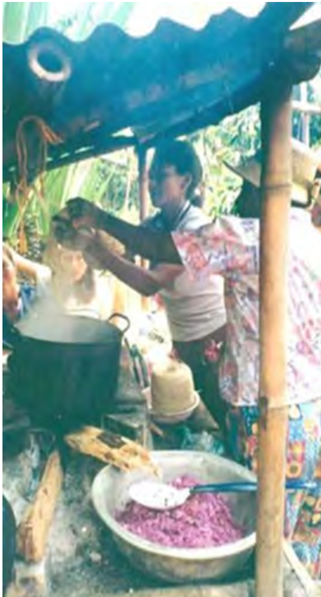
No 9 19,20,09,23 Tejidos con aguja de crochet V. CHISQUÍO-CAUCA Proceso de teñido