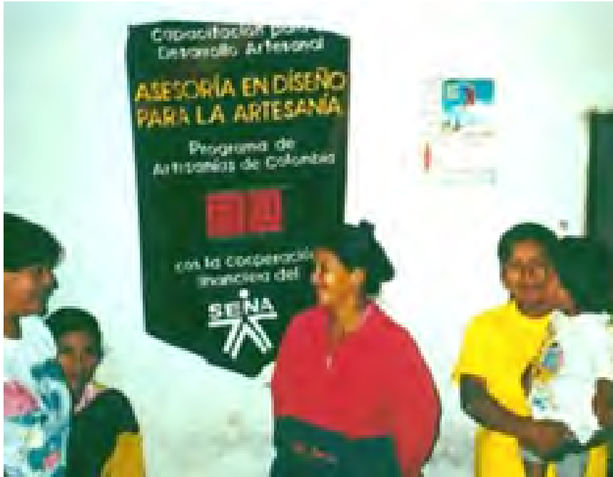
Tejidos con aguja de crochet SANTA ROSA - CAUCA Grupo Asesorado