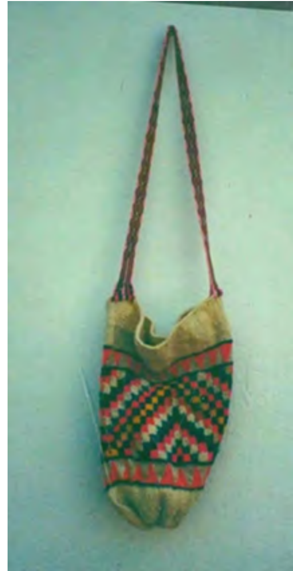
Tejidos con aguja de crochet SANTA ROSA - CAUCA Muestra de producto