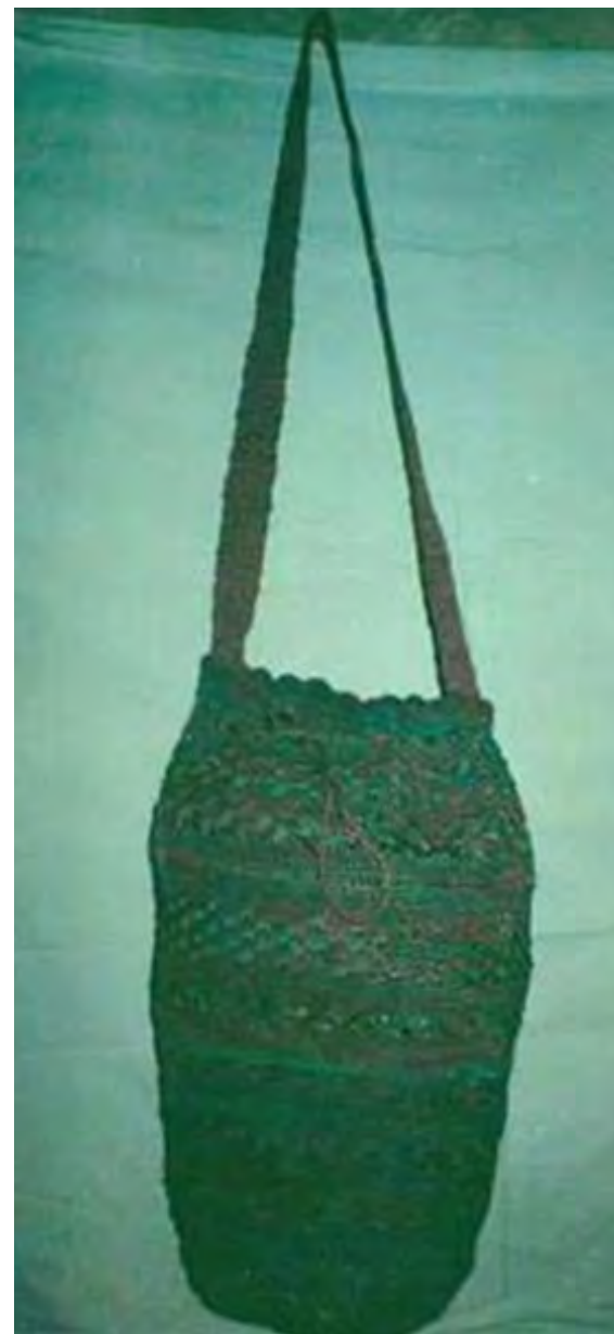
No 15 19,20,15,23 Tejidos con aguja de crochet V. CHISQUIÑO-CAUCA Mochila tradicional