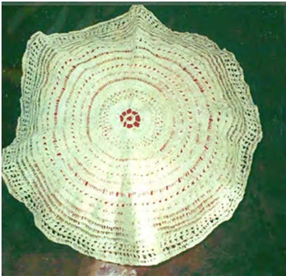
No 13 19,20,13,23 Tejidos con aguja de crochet V. CHISQUÍO-CAUCA Mantel de figue