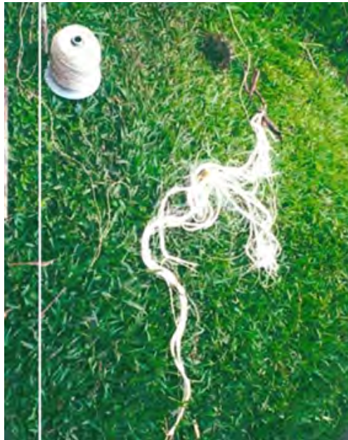
No 6 19,20,06,23 Tejidos con aguja de crochet V. CHISQUIO-CAUCA Tejiendo en crochet