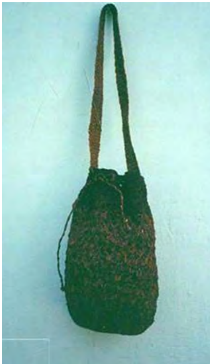
No 14 19,20,14,23 Tejidos con aguja de crochet V. CHISQUIÑO-CAUCA Mochila tradicional