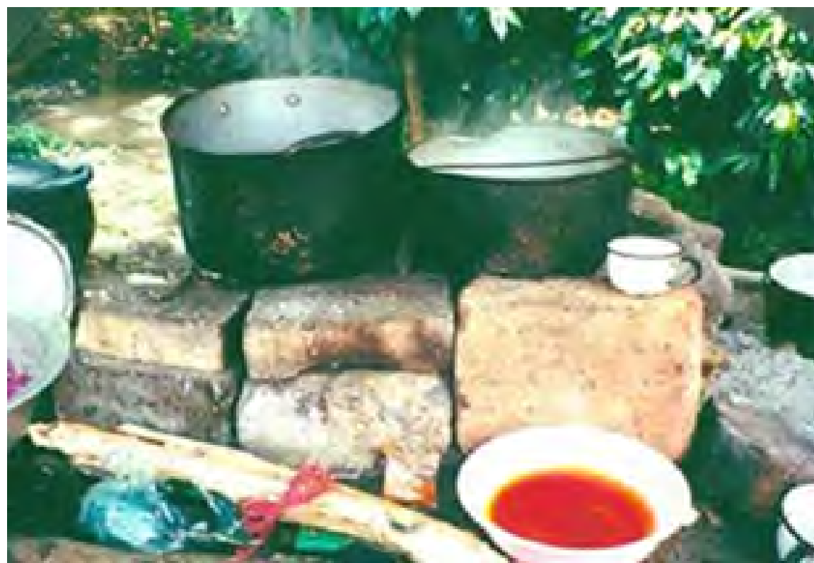
No 8 19,20,08,23 Tejidos con aguja de crochet V. CHISQUÍO-CAUCA Ollas