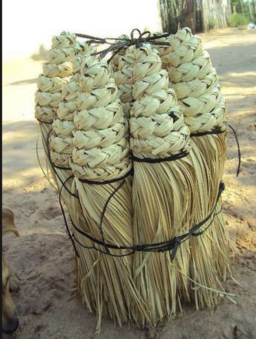
escoba en palma de vino