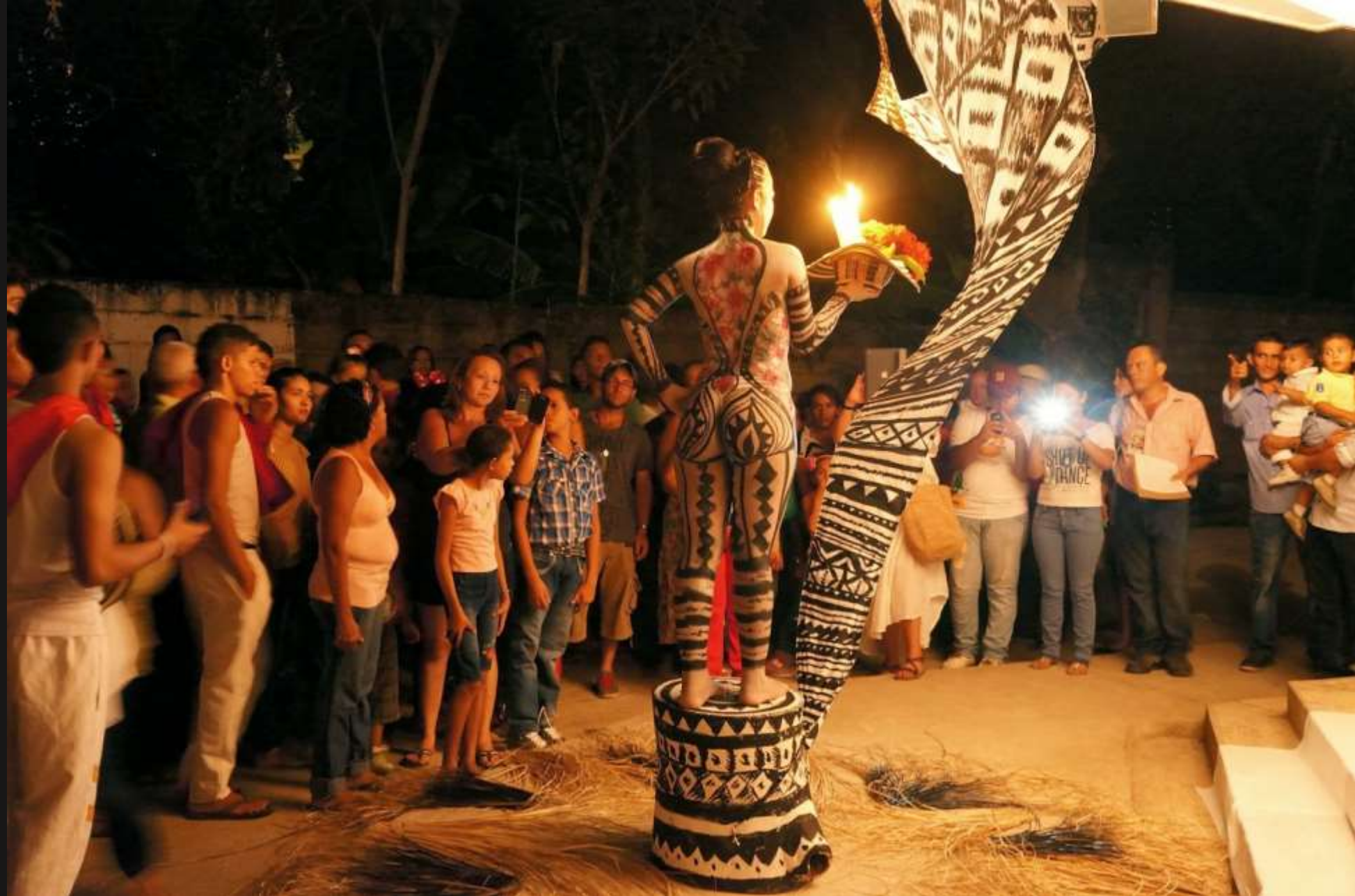
Evento de cuadros vivos, festival del algarrobo