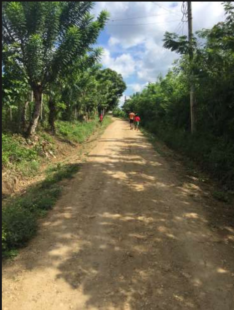
vias del Corregimiento, Cruz De Ramal