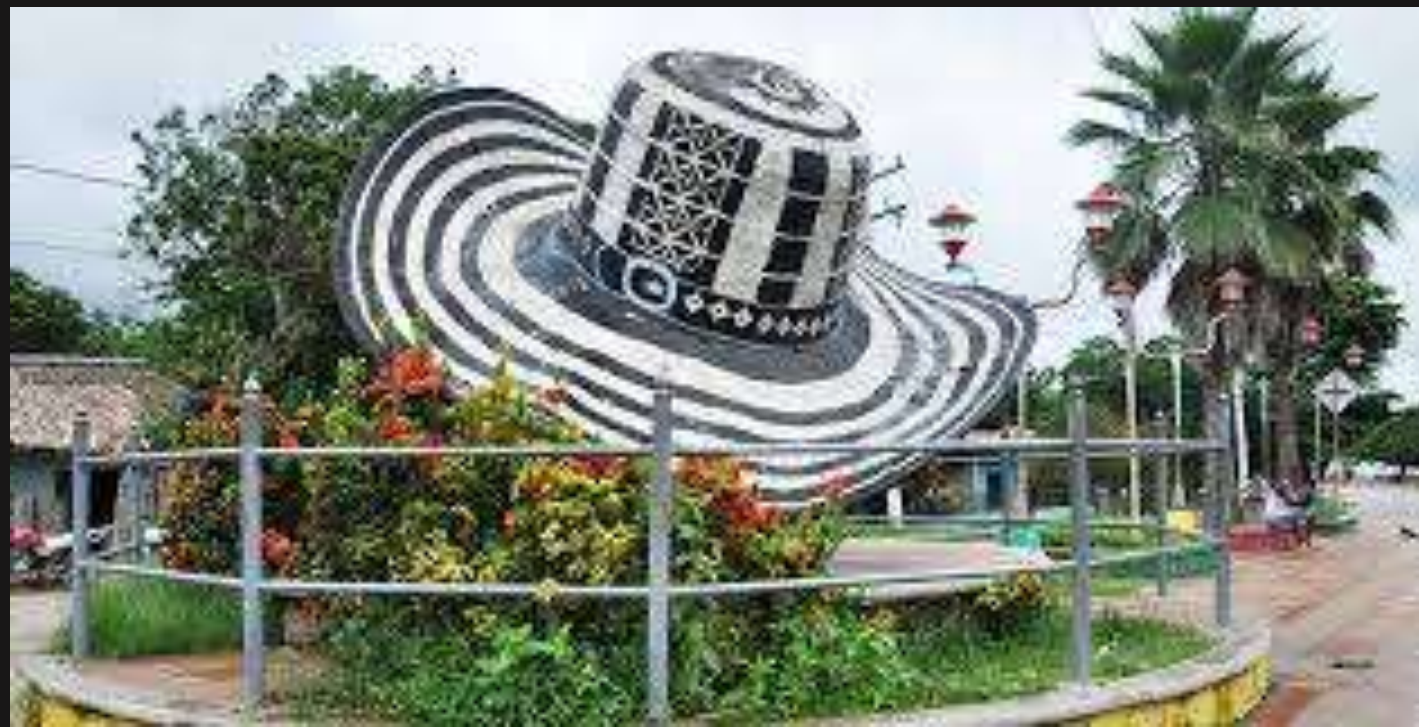
Monumento del sombrero vueltiao