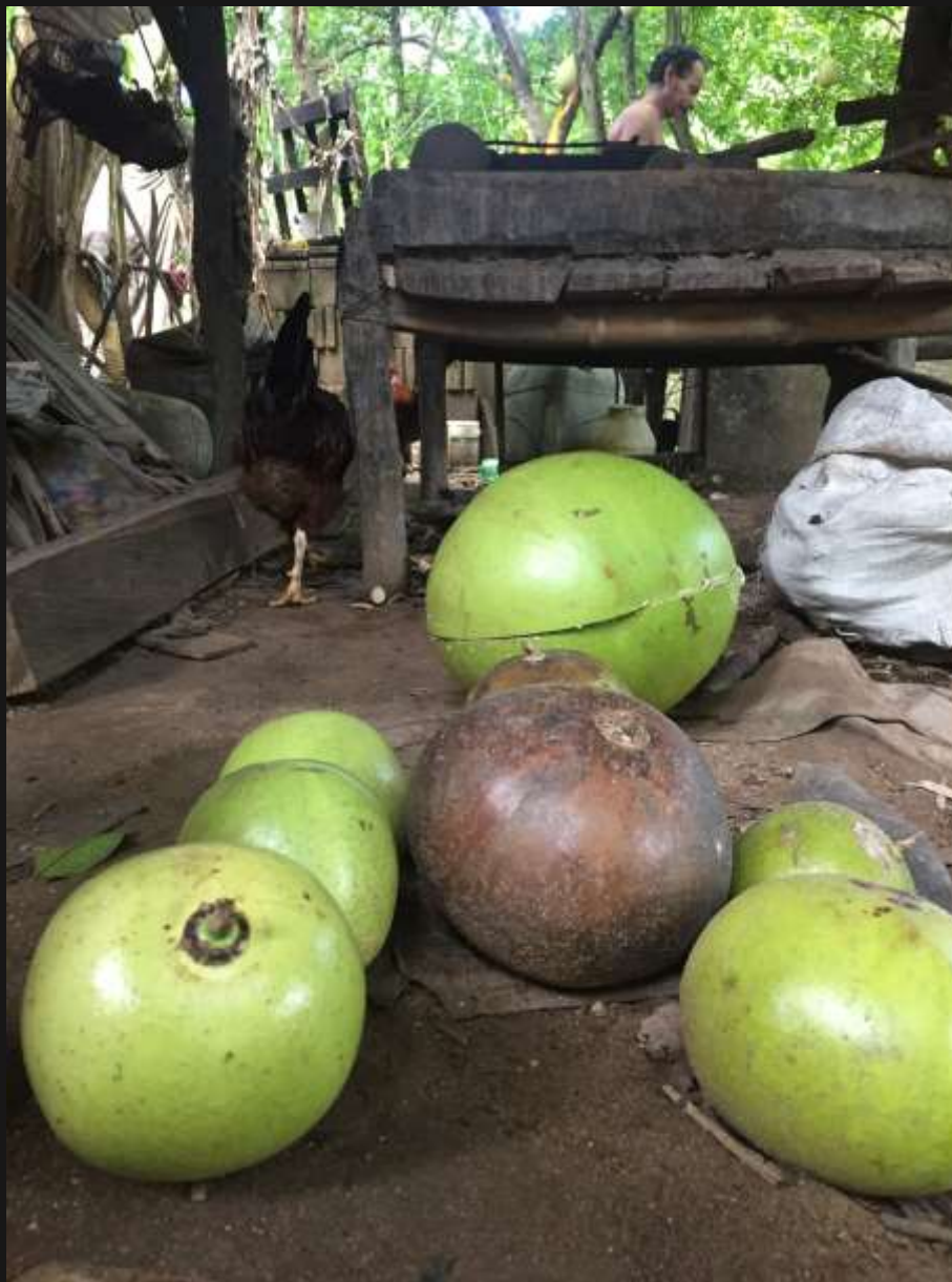
totumos y calabazos