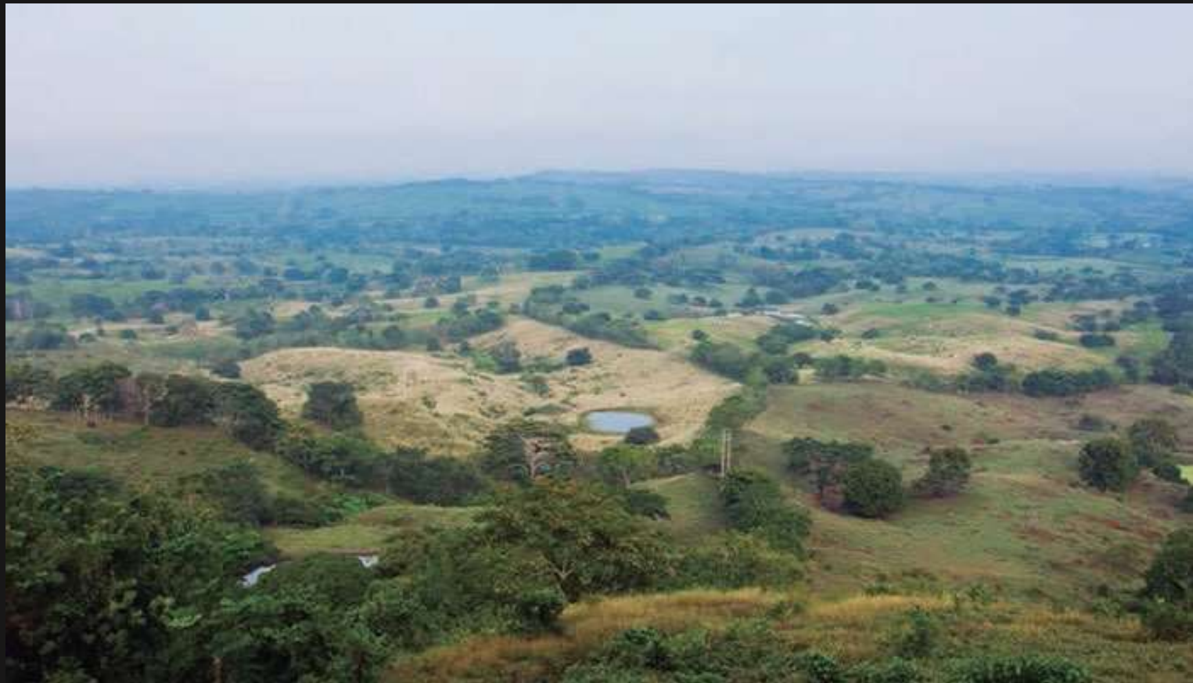
sierra flor-montes de maria