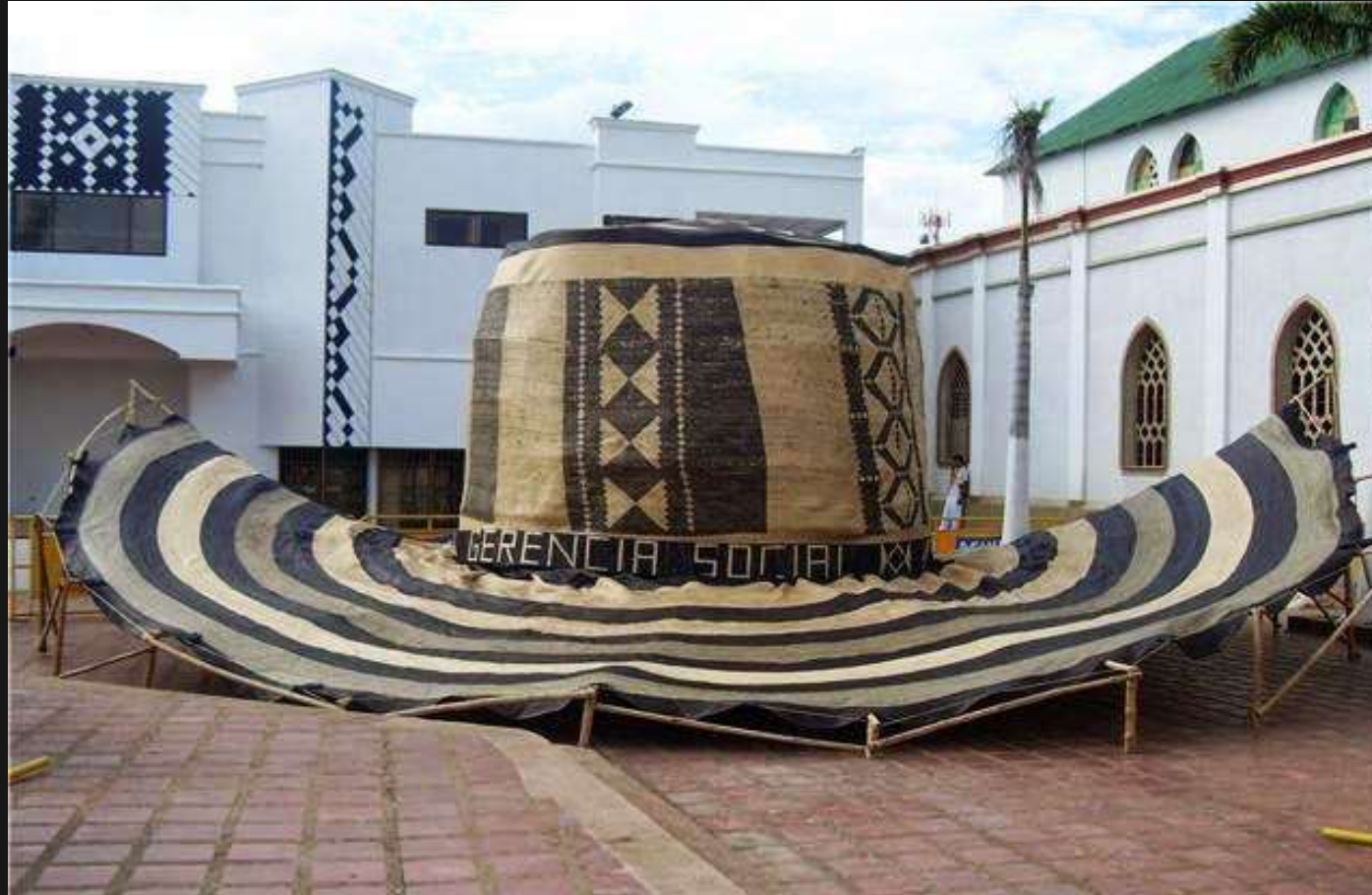
Sombrero mas grande del mundo, realizado por artesanos del municipio.