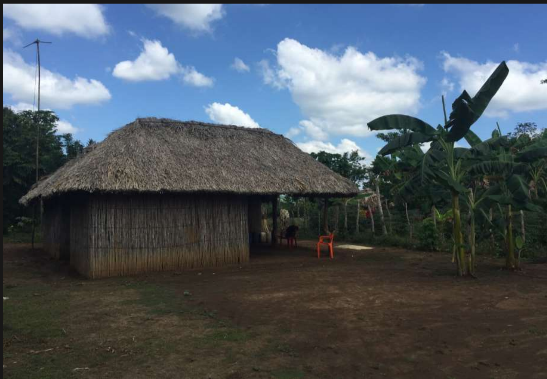
casa típica construida con bara de caña flecha. vereda Cruz De Ramal