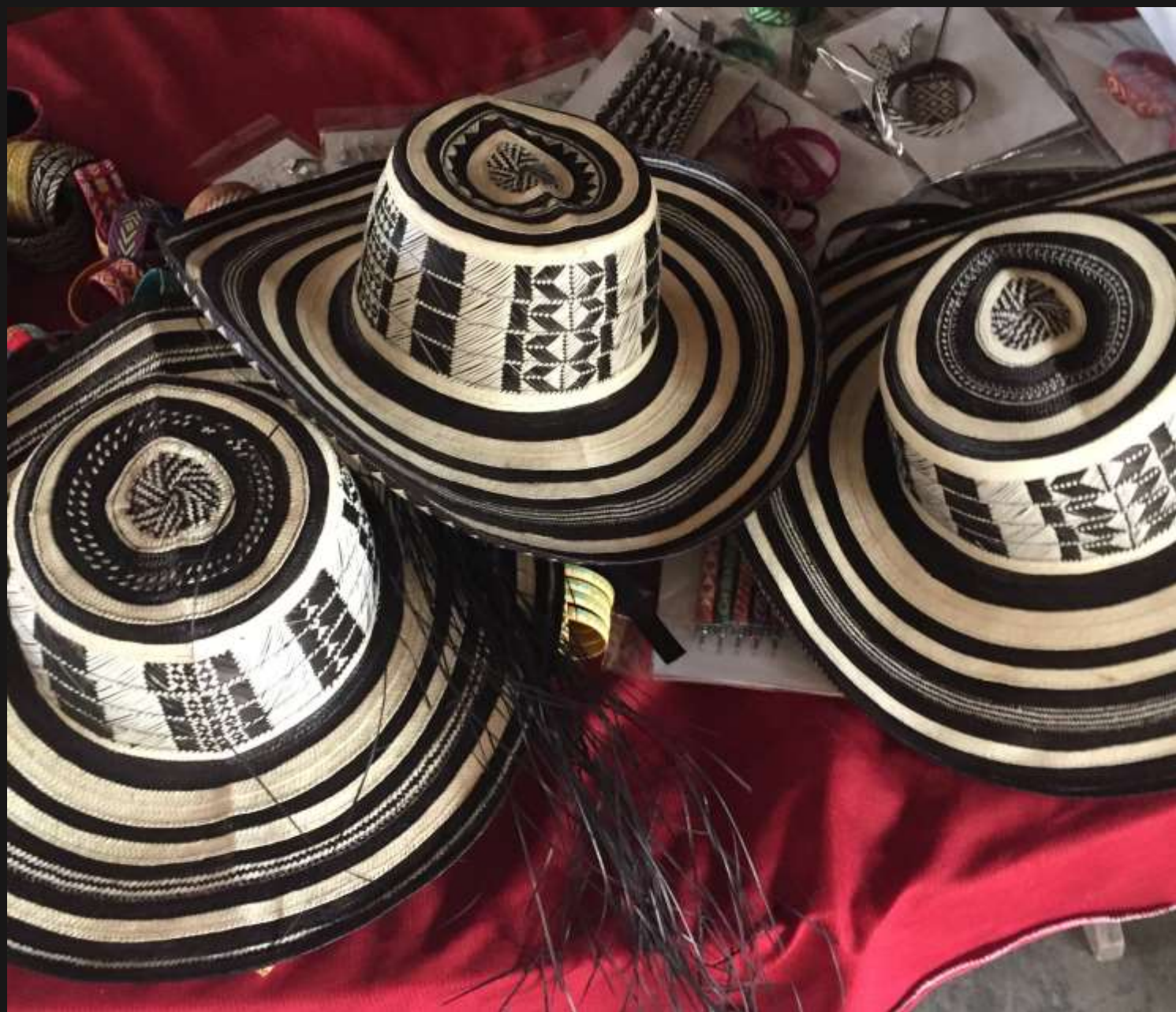
Tradicional sombrero vueltaio