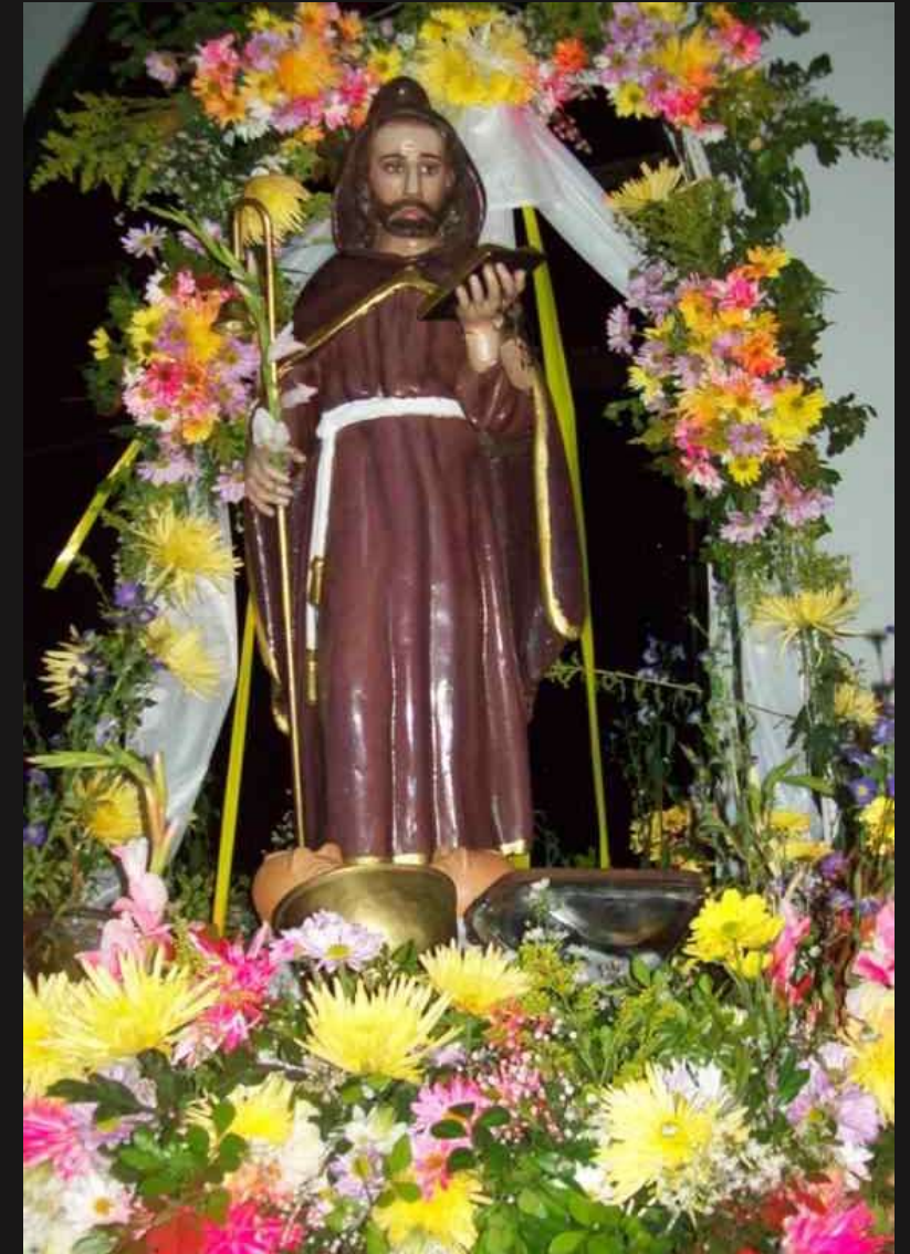
San Antonio Abad, santo patrono del municipio