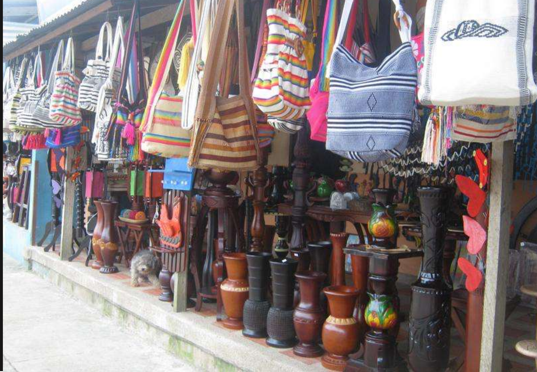
Vitrina de ventas a orillas de la carretera