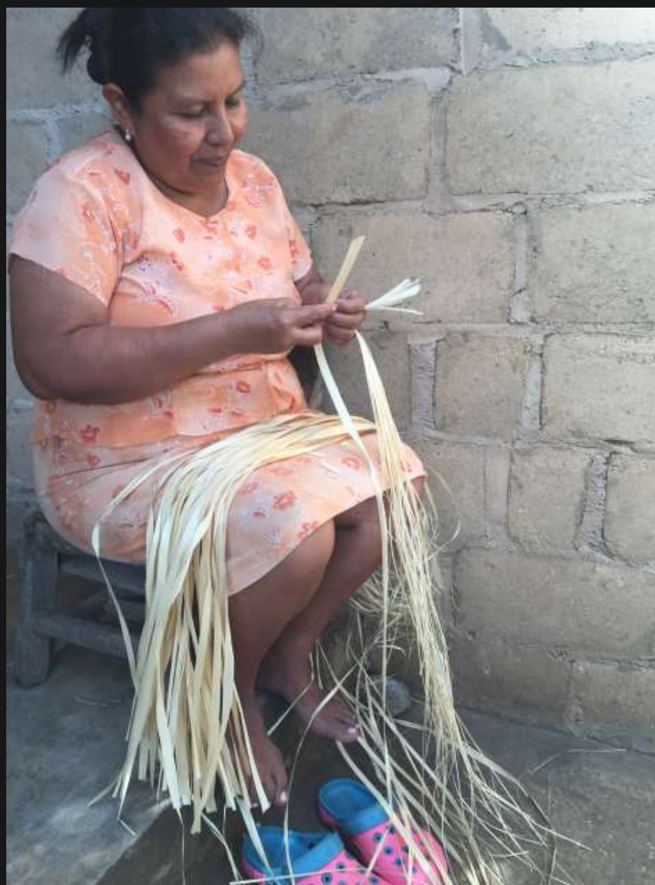
tejedoras de caña flecha