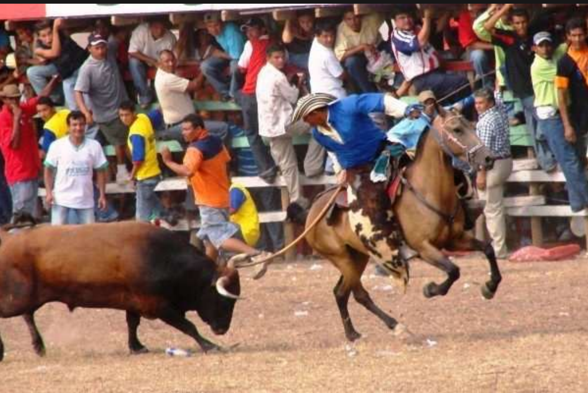
fiestas de corraleja