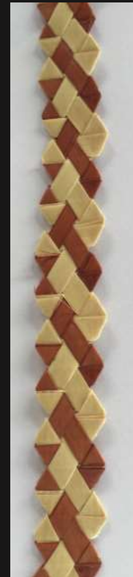
Pintas y trenzas