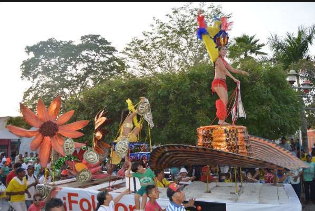
Reinado nacional del sombrero vueltiao