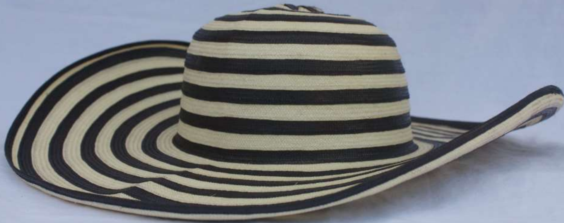
Tradicional sombrero vueltaio 21