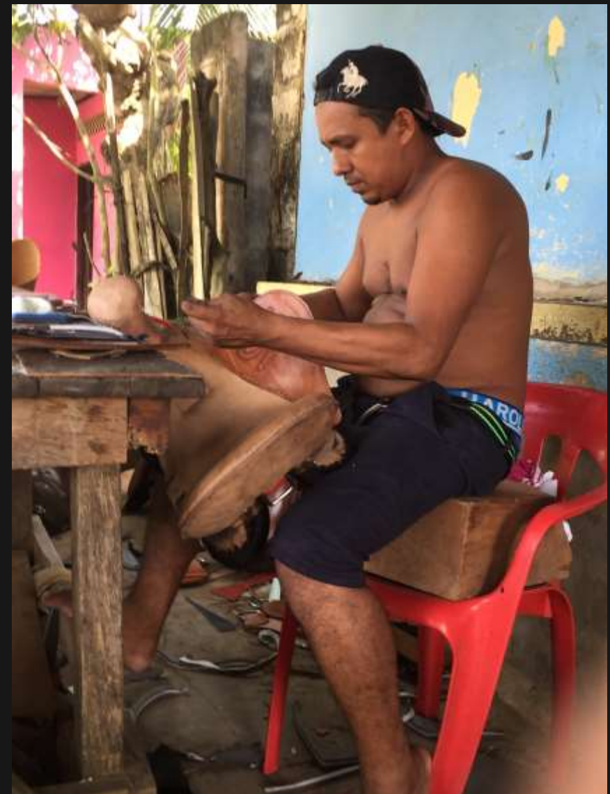
talabartero, silla de montar