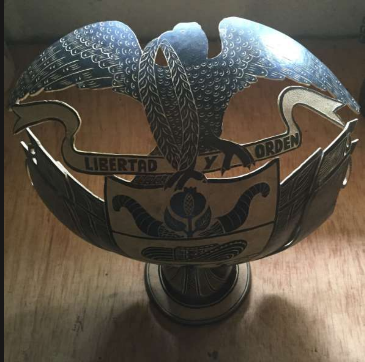
talla y ensamble en totumo