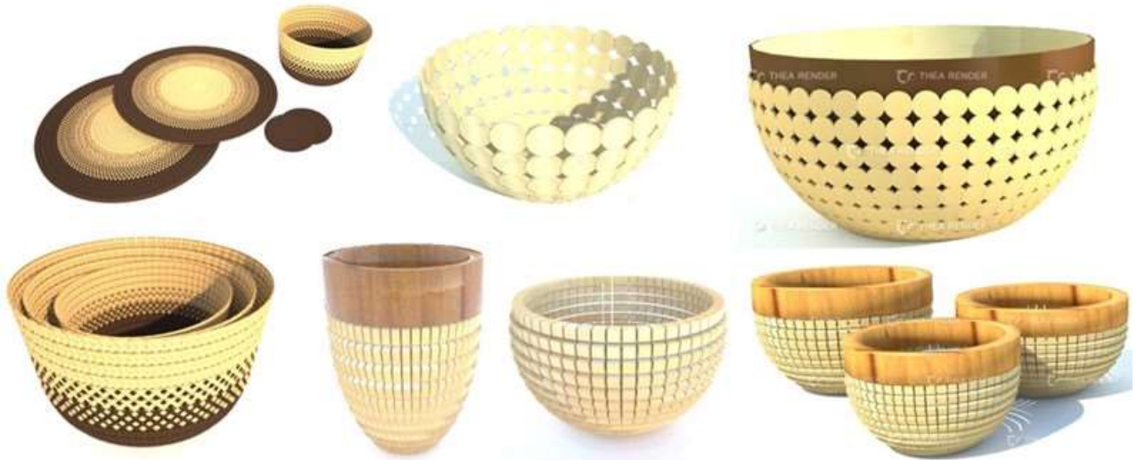
Grafico 5. Propuestas en 3D