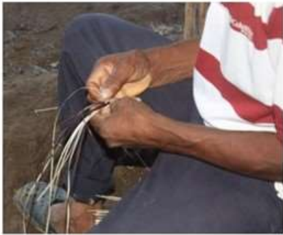
Imagen 1. Trenzado en caña flecha San Antonio De Palmito 2017

trenza 21 característica en los sombreros finos, existen unas no tan finas como el ribete donde se trenzan 22 fibras únicamente. Luego de lograda la trenza se procede a la confección, labor que consiste en coser con una maquina de pedal la trenza para la creación de elementos como sombreros, carteras y de decoración.