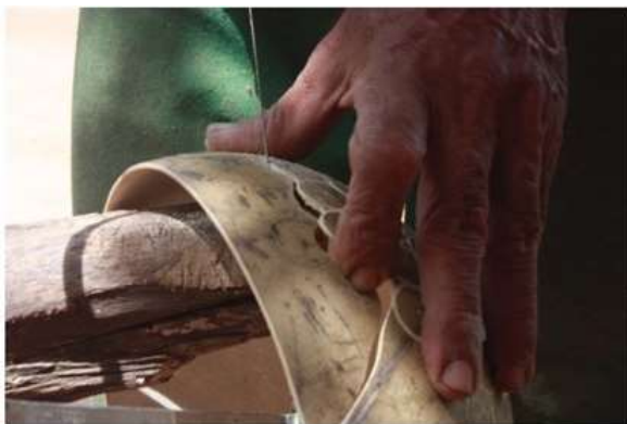
Imagen 7. Corte sobre totumo Fotografía por: Rafael Barreto Galeras 2017