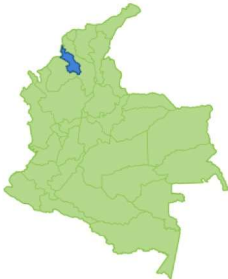
Gráfico 1. Ubicación geográfica del departamento de Sucre

Para comprender de manera más profunda la operación del proyecto es necesario conocer donde se encuentran ubicados los municipios atendidos en el marco del proyecto, para el soporte de la información se presentan los gráficos 1 y 2 .