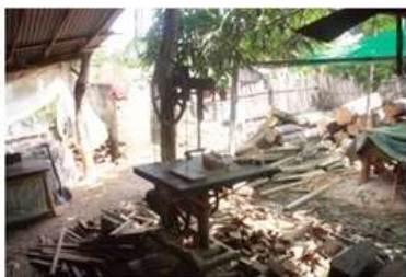
Imagen 4. Taller de carpintería Fotografía por: Rafael Barreto Sampués 2017

Las condiciones encontradas en sampues desde un principio fueron favorables, por lo mencionado anteriormente cuentan con una buena trayectoria en el tema de fortalecimiento y capacitaciones, las unidades productivas cuentan con el equipo necesario para cumplir con todo tipo de proyectos relacionados con su oficio además del adecuado manejo de los mismos.