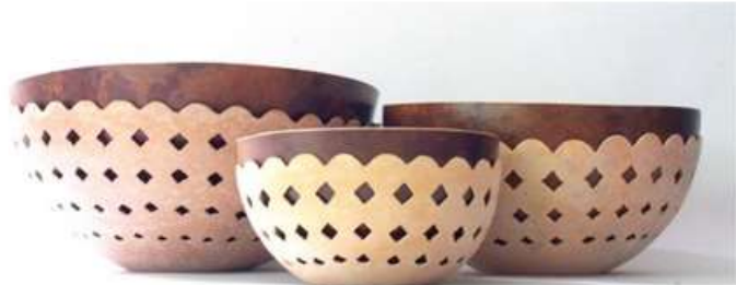
Imagen 17. Contenedores calados fabricado por: Jose Luis Gale Fotografía por: Rafael Barreto Galeras 2017

Para San Antonio de Palmito la gestión de diseño y producción estuvo enfocada en la selección de trenzas para lograr un efecto tipo degradado, manteniendo el eje de conexión de toda la región se trabajo con la prensa “granito de arroz” alterando los colores en en la medida que se avanzaba en el proceso de confección, el resultado fue una transición de color con muy buena apariencia y valor percibido.