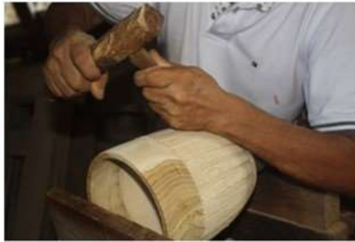
Imagen 2. Tallado en madera