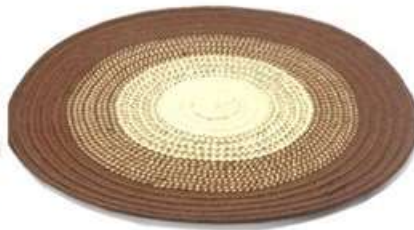
Imagen 19. individuales fabricado por: Antonio Marquez San Antonio De Palmito 2017