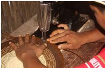
Imagen 11. confección de individuales San Antonio De Palmito 2017

Ya habiendo establecido los planes de producción se puso en marcha la gestión de productos para cumplir con las metas establecidas para EXPOARTESANIAS 2017.