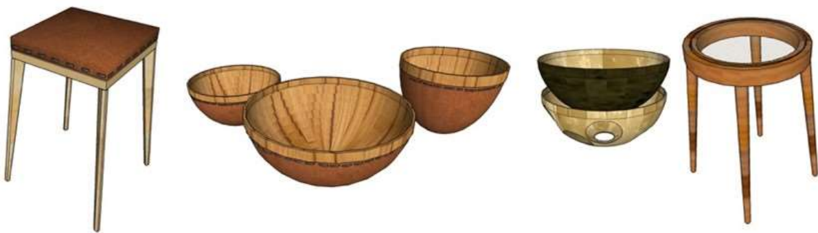
Grafico 4. Primeras propuestas en 3D Dibujo por: Rafael Barreto Sincelejo - Sucre 2017

Luego de presentas las propuestas anteriormente mostradas en los gráficos 3 y 4 en los comités nacionales se recibió la respectiva retro alimentación para el ajuste del enfoque y consolidación de una propuesta mas solida.