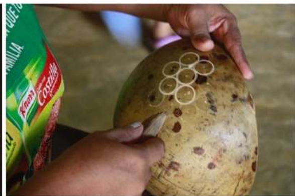
Imagen 8. Grabado modular sobre totumo

Las condiciones encontradas en Galeras se puede decir que fueron lo opuesto a lo encontrado en Sampués. A pesar de que recientemente habían culminado un proceso con resultados favorables las condiciones en cuanto a la explotación de la técnica se encontraban muy poco desarrolladas, se habían limitado al desarrollo de una talla basada en líneas representando elementos imaginarios y figurativos pero carentes de proporciones o criterios básicos de diseño como la modulación.