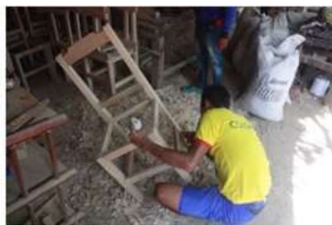
Imagen 5. Armado de taburete