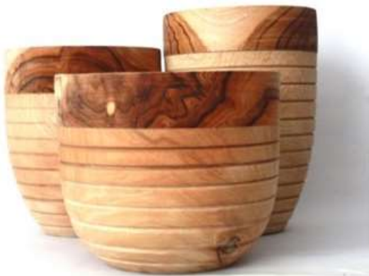
Imagen 14. Set de contenedores fabricado por: Jorge Cujar Fotografía por: Rafael Barreto Sampues 2017

Se logró una diversificación de productos en sampues, donde generalmente se elaboraban artículos de mobiliario, se desarrolló una propuesta innovadora que proponía contrastes en tonos, materiales y texturas, se trabajó una línea de productos enfocada al comedor y la decoración, con buenos acabados y gran manejo de la técnica.