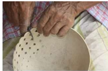
Imagen 13. calado en totumo

En los tres municipios durante 15 días se concentraron las actividades en la supervisión y seguimiento de la factura de los productos, dando así cumplimiento a las metas establecidas con muy buenos resultados.