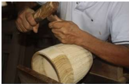
Imagen 12. Tallado en madera Fotografía por: Rafael Barreto Sampues 2017