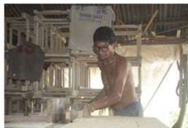
Imagen 6. Corte de madera