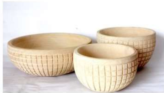
Imagen 15. Bowls tallados fabricado por: Jorge Cujar Fotografía por: Rafael Barreto Sampues 2017

En Galeras se concentró el concepto en la explotación de la técnica y se tomó como eje para la fabricación de productos, utilizando el calado, una técnica poco utilizada en la comunidad debido a su complejidad por falta de herramientas adecuadas. Sin embargo se cumplieron los objetivos y los artesanos se mostraron muy agradecidos por la motivación brindada para la creación de tan novedosos artículos. Se hizo énfasis en la base de los productos, para solucionar el inconveniente que se presenta en los totumos al no tener una base plana carecen de estabilidad, se