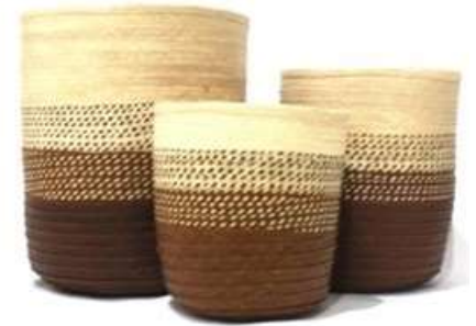
Imagen 20. set de paneras fabricado por: Antonio Marquez San Antonio De Palmito 2017