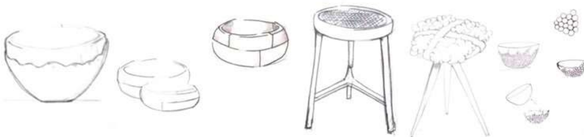
Grafico 3. Primeros bocetos

La indicación general era lograr para la fecha de octubre la aprobación de propuestas para llevar a producción y exhibir en EXPOARTESANIAS 2017. Se recomiendo que en el marco de los talleres de diseño se tuviera en cuenta el componente de desarrollo de propuestas de acuerdo a la matriz de diseño establecida para la feria.