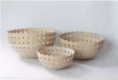
Imagen 16. Bowls calados fabricado por: Jose Luis Gale Fotografía por: Rafael Barreto Galeras 2017

propuso un doble fondo que resolviera este inconveniente resultando en una propuesta modular muy interesante, los resultados saltan a la vista.