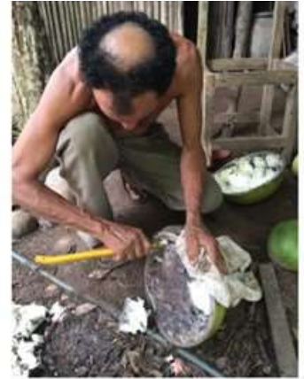
Imagen 3. Trabajo en totumo 2017