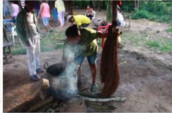
Imagen 10. Tinturado de caña flecha San Antonio De Palmito 2017

Fue tomado con gran satisfacción por parte de los artesanos el acompañamiento de Artesanías de Colombia en su proceso de fortalecimiento pues recién inicio el proceso los artesanos habían constituido una asociación llamada ASOARPAL (Asociación de artesanos de palmito) la cual recibe un impulso significativo con todo lo que incluye el proyecto y les favorece en la ampliación del espectro en cuanto a la gestión y factura de productos se refiere.