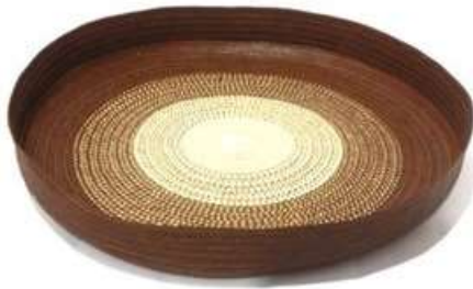
Imagen 18. centro de mesa fabricado por: Antonio Marquez San Antonio De Palmito 2017