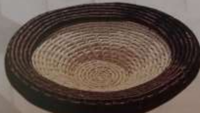
13 Centro de mesa