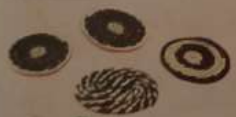
29 Porta vasos