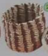
21 Cofre redondo con espiga blanca