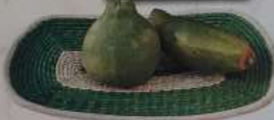
12 Bandeja con base