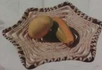
11 Centro de mesa con puntas