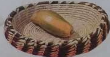
16 Porta calientes