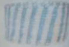
1 Juego de organizadores sin tapa. Hechos con espiga café (tres piezas)