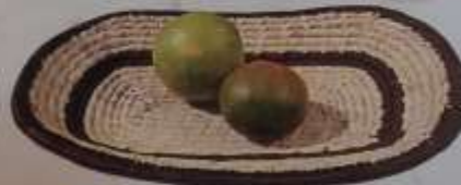
14 Centro de mesa con borde café