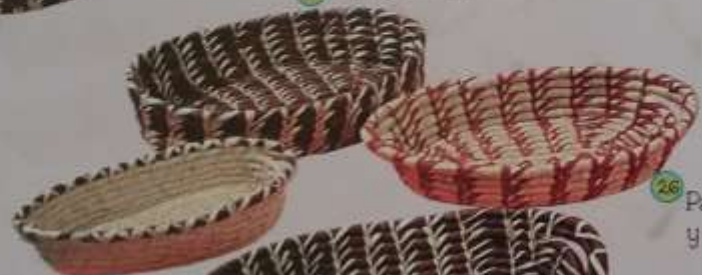
26 Panera blanca con espiga roja y con gancho