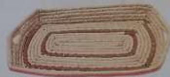
18 Azafate blanco con listas café