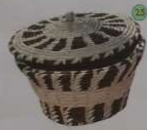
25 Bombonera con tapa y tinte natural