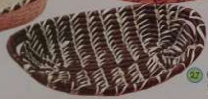
27 Cubiertero café con espiga blanca y con gancho