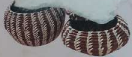
Bomboneras con tapa y tinte natural 25