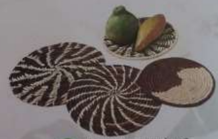
32 Individuales circulares