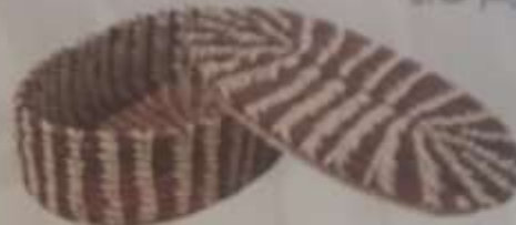
2 Parera ovalada café con espiga blanca y tapa.