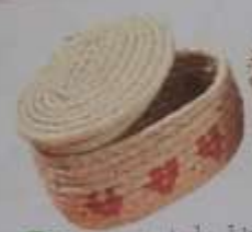
20 Cofre ovalado blanco con adorno rojo