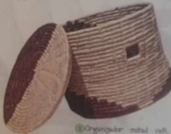
3 Organizador mitad café, mitad blanca con verdinas