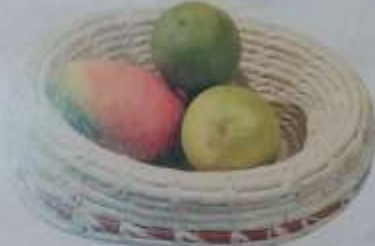
15 Frutera color natural con raya café