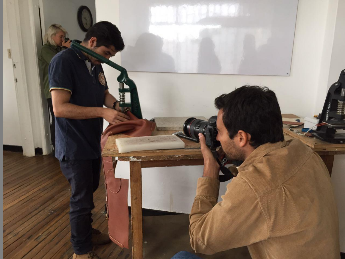
Proceso de elaboración de piezas – Taller Blumarino

VISITA DISEÑADORAS K/LLER – TALLER ARTESANOS