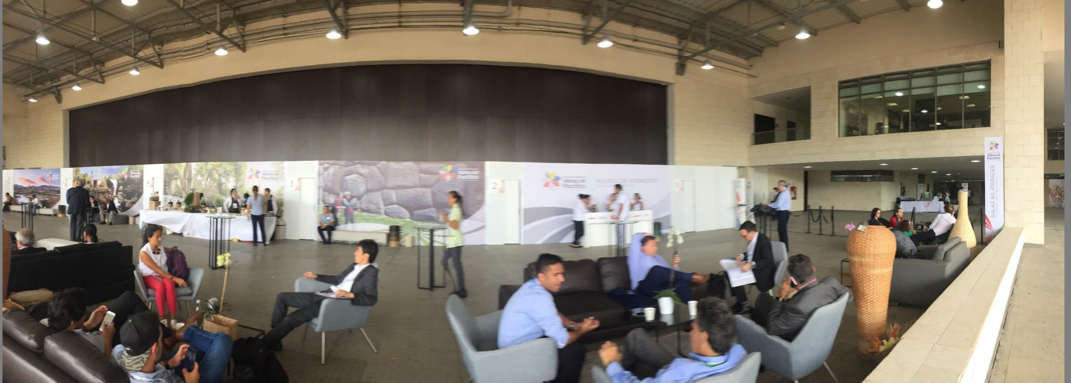
Vista general – área lounge empresarios