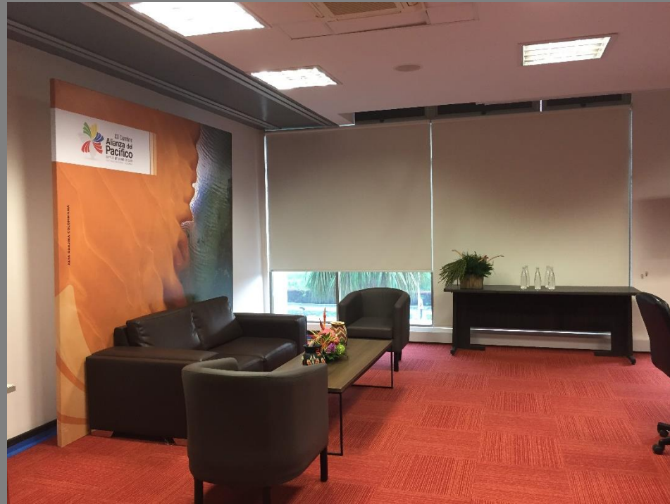
Exhibición de piezas en la sala de reuniones – Presidente ProColombia