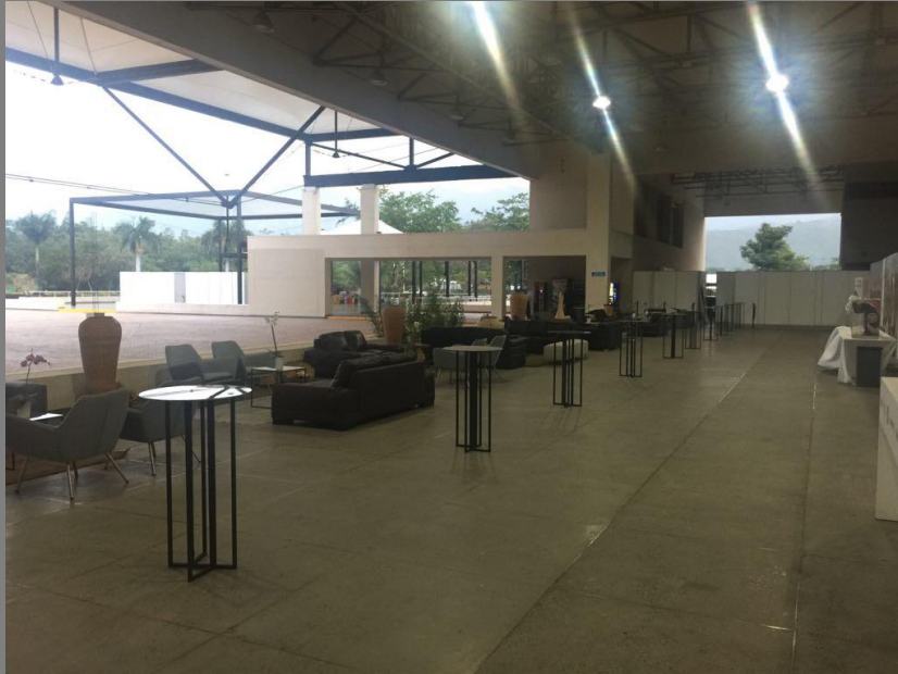
Piezas exhibidas durante el Encuentro