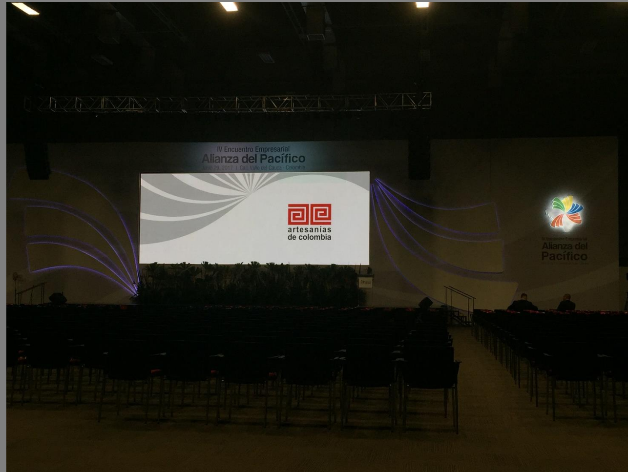
Logo de Artesanías de Colombia en loop del evento

IV ENCUENTRO EMPRESARIAL ALIANZA DEL PACÍFICO