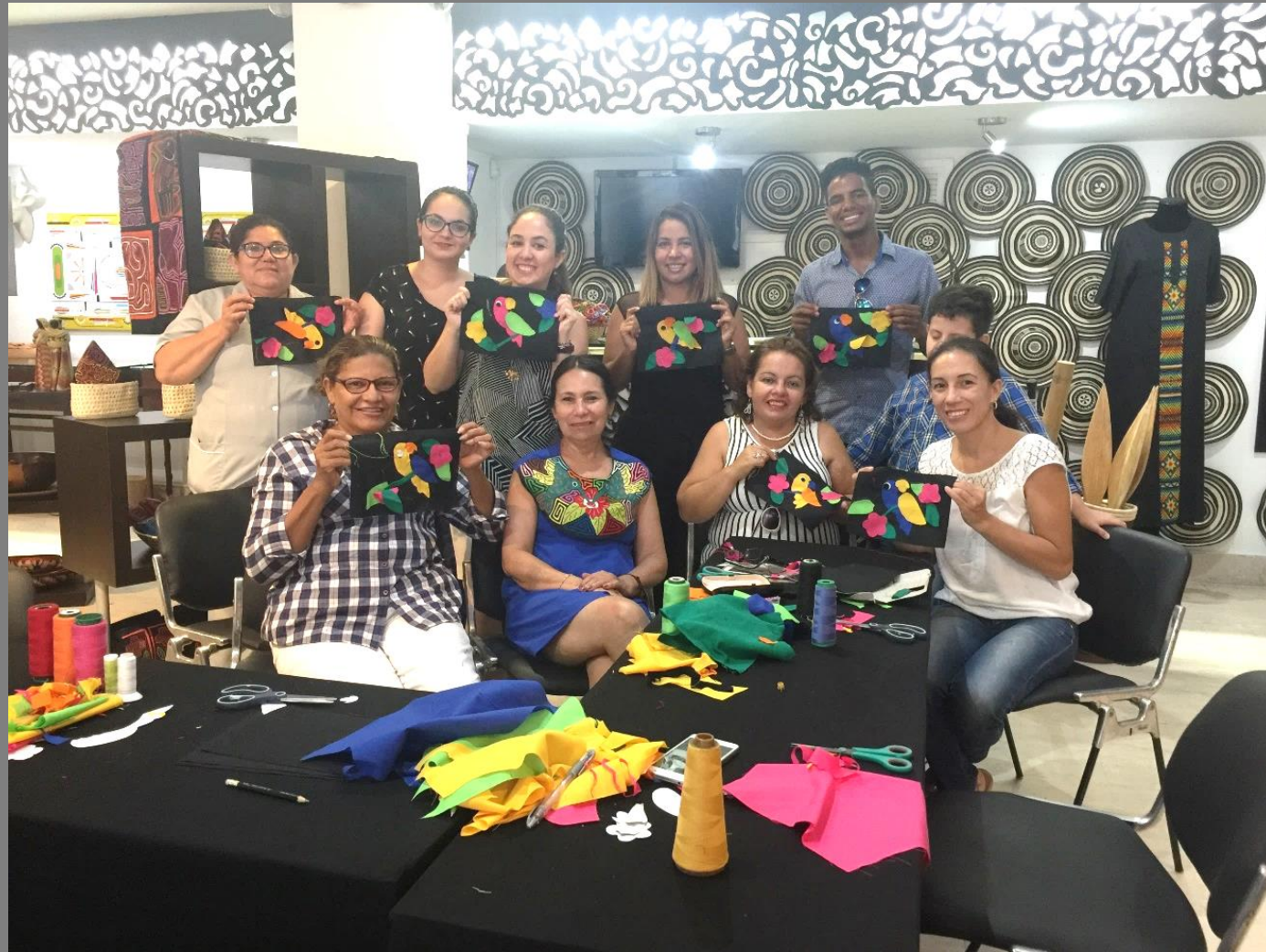
TALLER DE DEMOSTRACIÓN DE OFICIO DE APLICACIÓN EN TELA