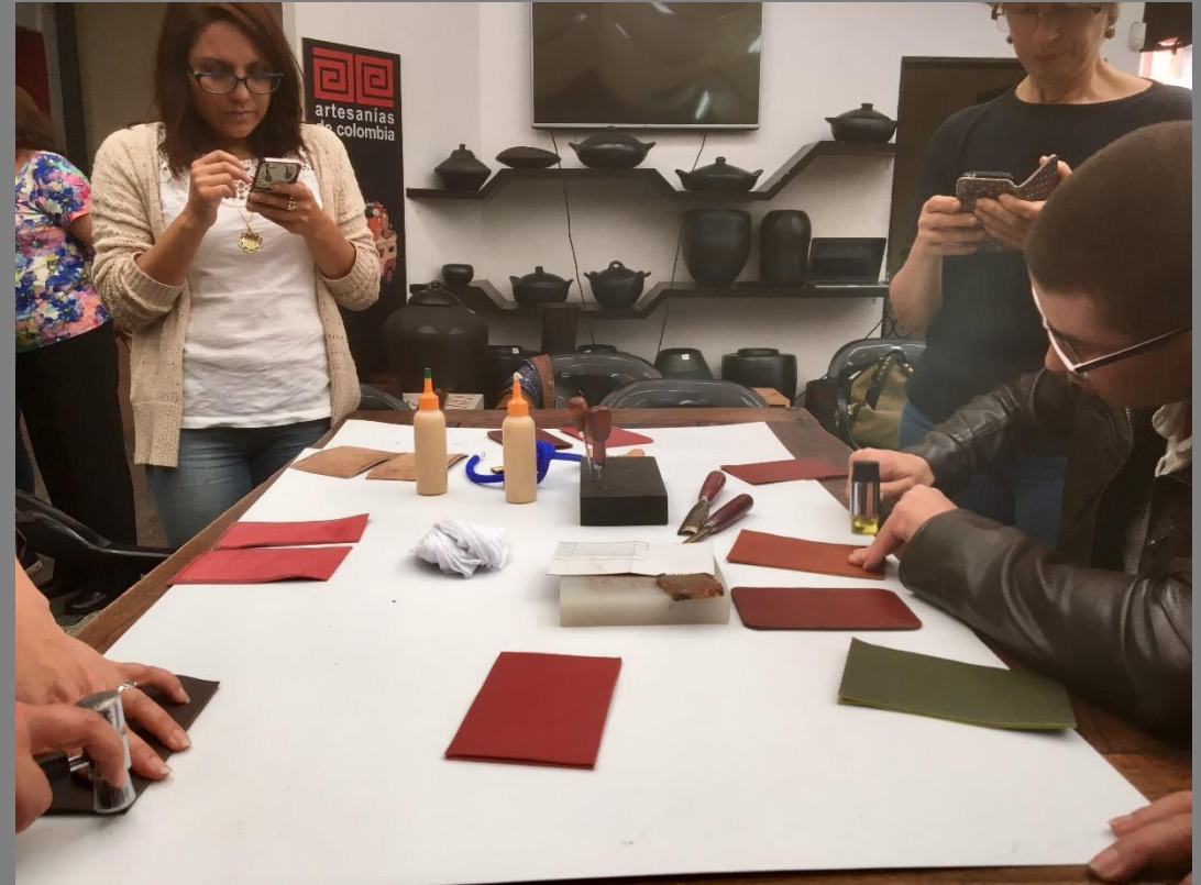
TALLER DE DEMOSTRACIÓN DE OFICIO DE MARROQUINERÍA