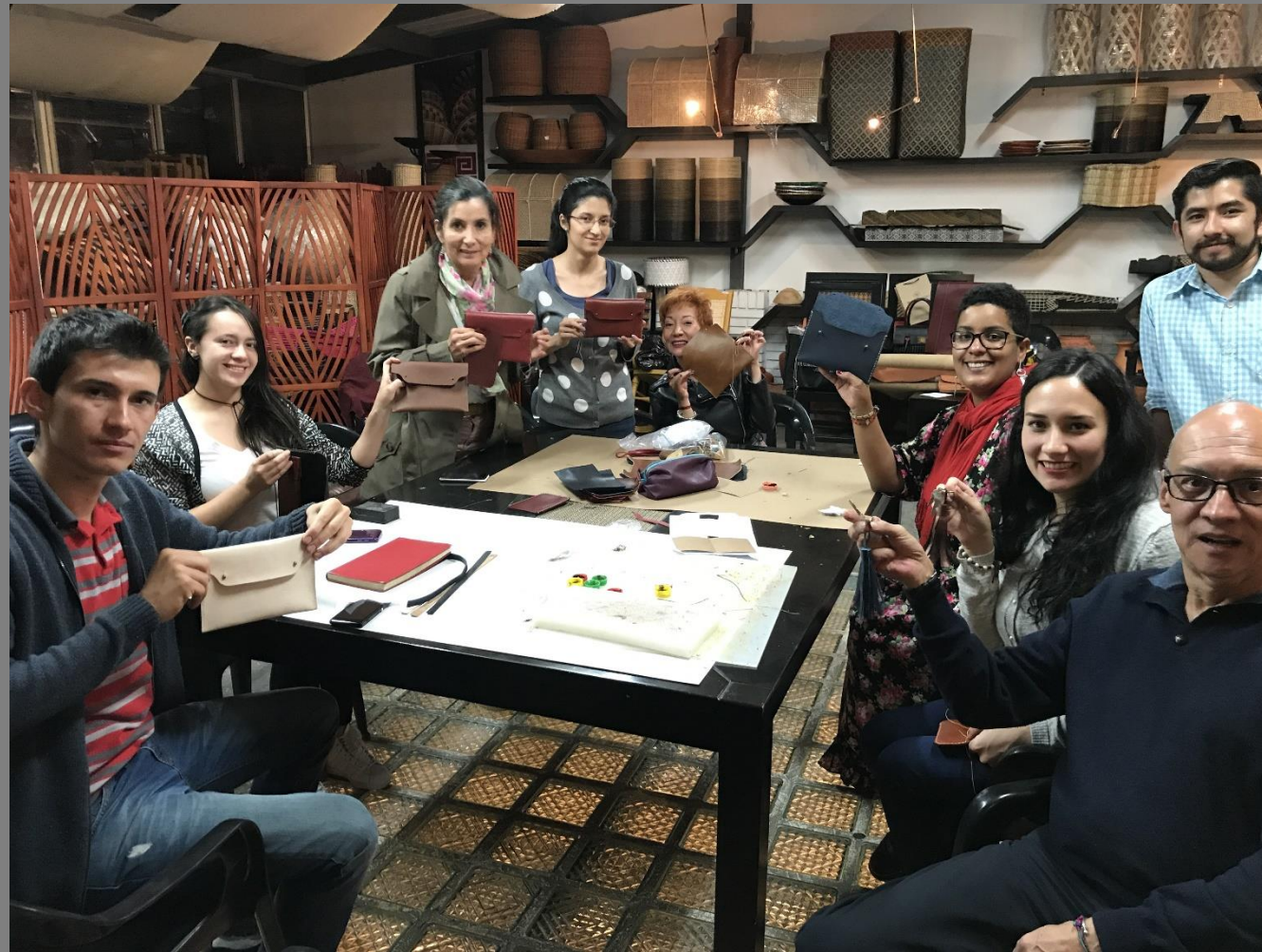
TALLER DE DEMOSTRACIÓN DE OFICIO DE MARROQUINERÍA