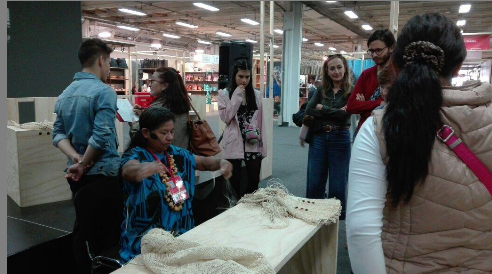
TALLER DE DEMOSTRACIÓN DE OFICIO DE TEJEDURÍA EN CUMARE