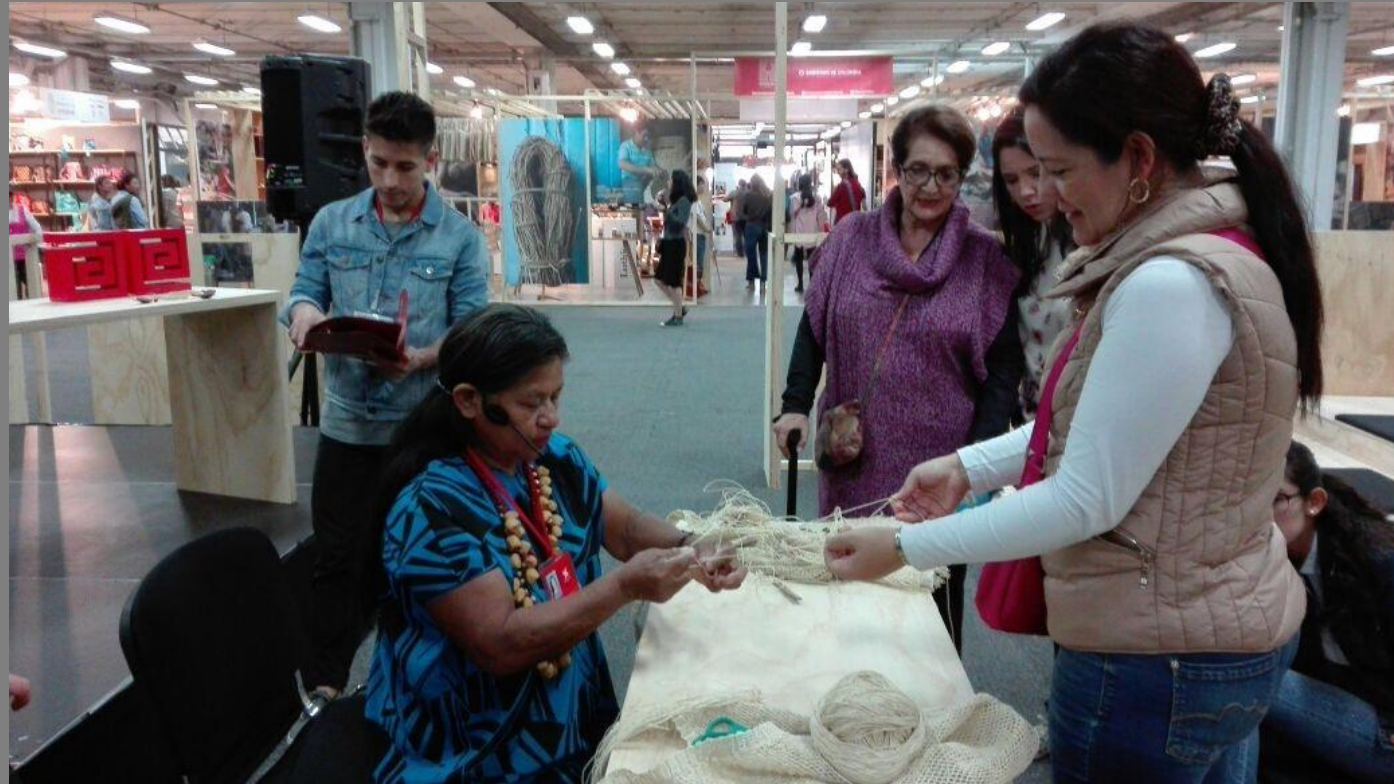
TALLER DE DEMOSTRACIÓN DE OFICIO DE TEJEDURÍA EN CUMARE