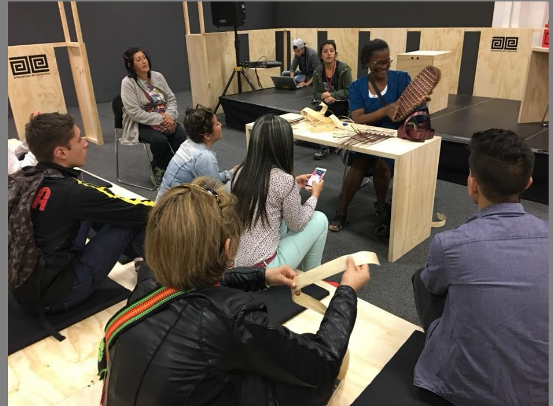
TALLER DE DEMOSTRACIÓN DE OFICIO DE PAJA TETERA O CHOCOLATILLO