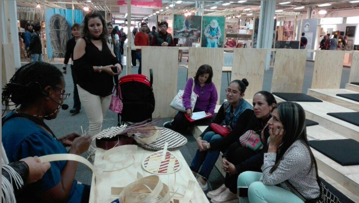
TALLER DE DEMOSTRACIÓN DE OFICIO DE PAJA TETERA O CHOCOLATILLO