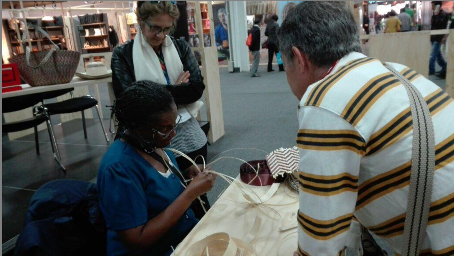
TALLER DE DEMOSTRACIÓN DE OFICIO DE PAJA TETERA O CHOCOLATILLO