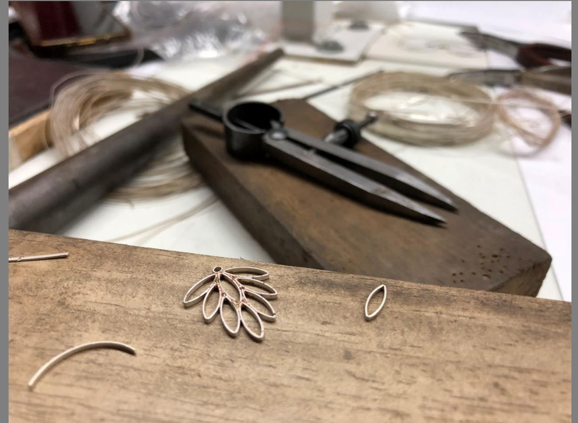
TALLER DE DEMOSTRACIÓN DE OFICIO DE JOYERÍA - FILIGRANA