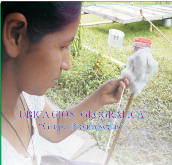
UBICACIÓN GEOGRÁFICA "Grupo Proarteesedas"