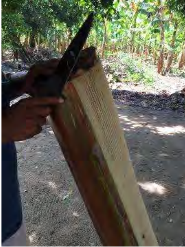
Obtención cepa de plátano