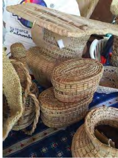
Productos cepa de plátano