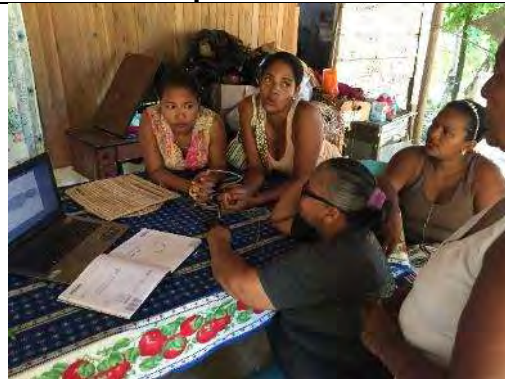
Comunidad artesanal los Córdoba