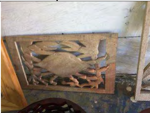
Tallado en madera