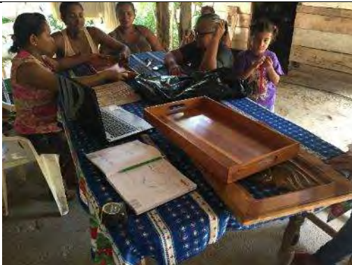
Comunidad artesanal los Córdoba