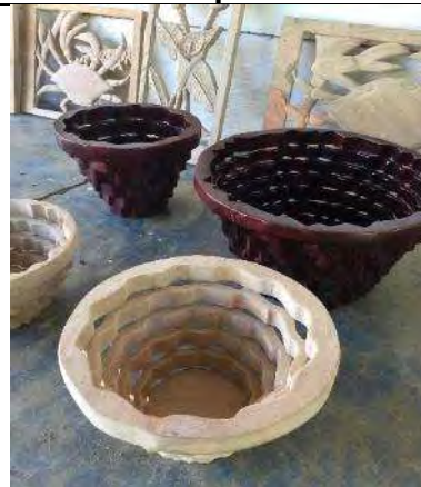
calado en madera