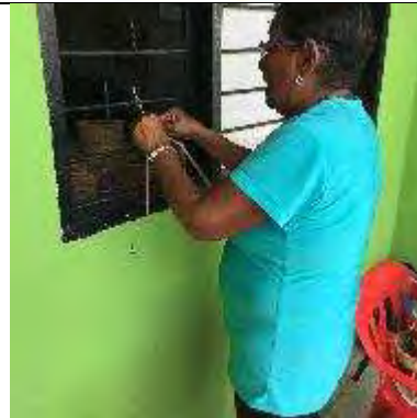
Comunidad artesanal, montería