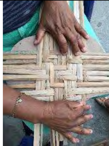
Comunidad artesanal, montería