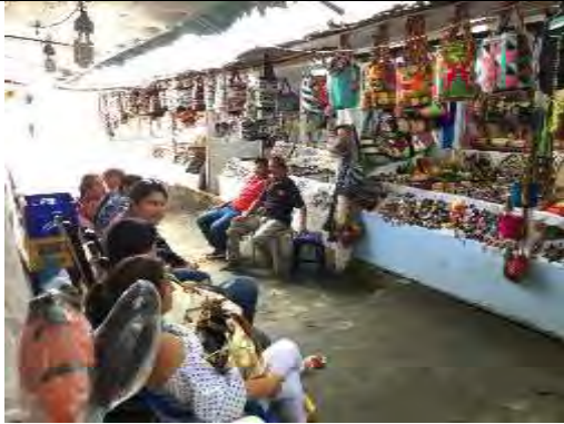
Comunidad artesanal, Montería