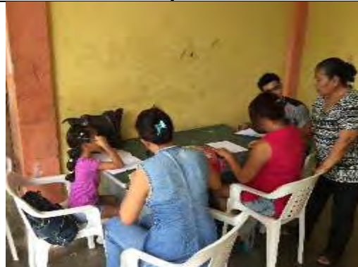
Exploración formal, Montería