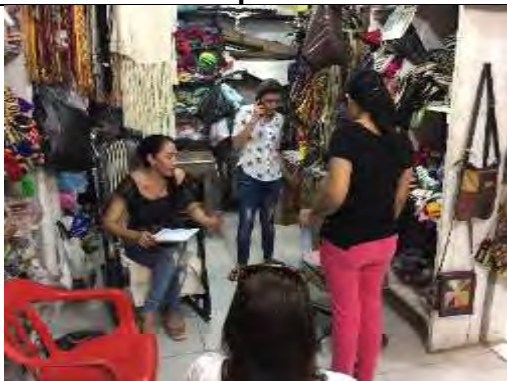
Comunidad artesanal, Montería