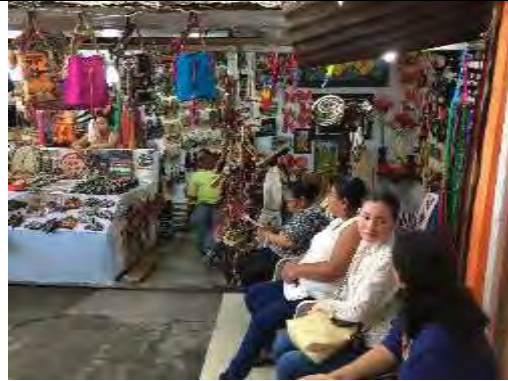
Comunidad artesanal, Montería