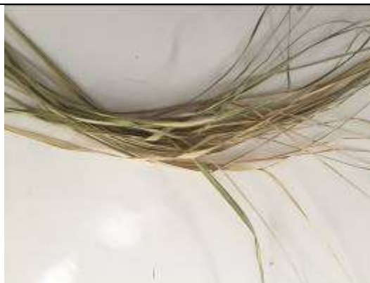
Ilustración 31-iraca deshidratada