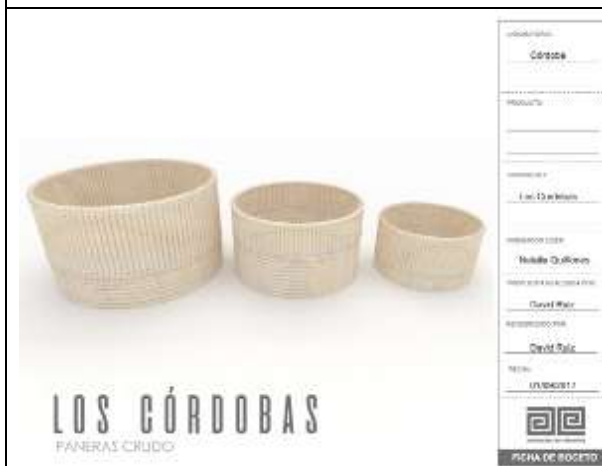
Ilustración 18-ficha boceto paneras