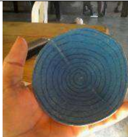
Ilustración 8-pintura en totumo