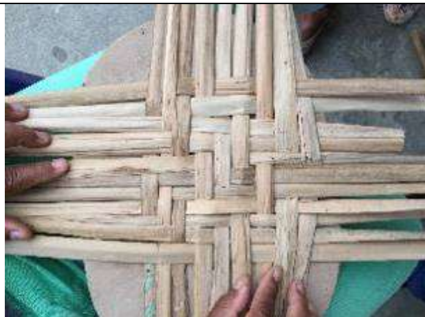
Ilustración 9-taller tejido en enea

Taller 4. En Montería para el trabajo con enea, Se realizaron pruebas de tejidos en enea.