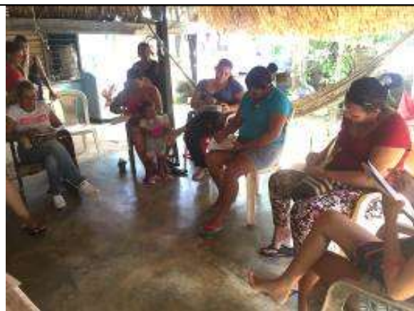
Ilustración 2-Actividad de co diseño

Se diseñó los bocetos para comité en conjunto con las comunidades, aportando sugerencias desde la técnica para afinar las propuestas planteadas. Se tomó en cuenta las actividades de referente realizadas en el periodo anterior para definir las propuestas. El proceso se llevó a cabo evaluando propuestas de diseño entregadas por el diseñador desde los puntos de vista de cada artesano durante las sesiones de desarrollo de líneas. Luego realizando correcciones consensuadas entre el diseñador y el artesano para obtener un diseño de más impacto y técnicamente fácil de concebir.