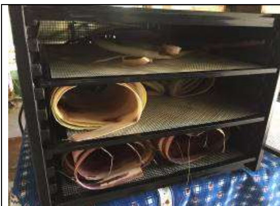
Ilustración 28- deshidratación cepa plátano

Se llevaron a cabo pruebas de secado para la cepa de plátano en el municipio de los Córdoba. La cual consistió en sacar varias fibras del tallo de la planta de plátano e introducirlas en el horno deshidratador a temperatura de 45° C, se posiciono en las parrillas del horno y al cabo de 3 horas se obtuvo el secado de las fibras, obteniendo el mismo resultado que el secado convencional al sol.