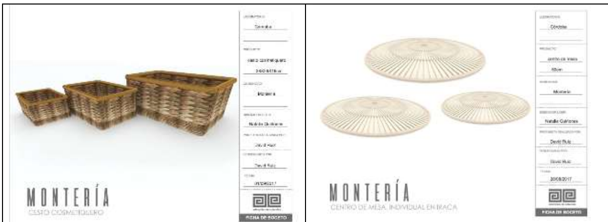
Ilustración 21-ficha boceto cestos enea

Montería se diseñaron 4 líneas (madera, enea, iraca).