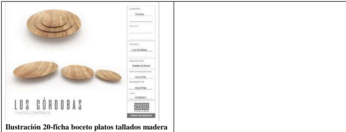
Ilustración 20-ficha boceto platos tallados madera

Montería se diseñaron 4 líneas (madera, enea, iraca).