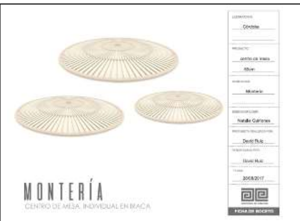
Ilustración 22-ficha boceto individuales iraca