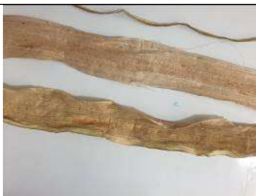
Ilustración 29- cepa deshidratada