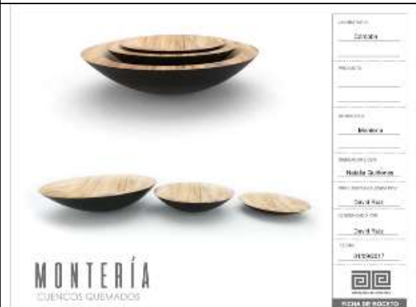
Ilustración 24-ficha boceto cuencos madera