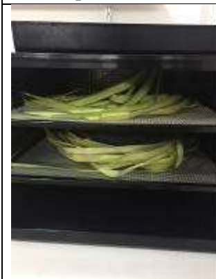
Ilustración 30- deshidratación iraca