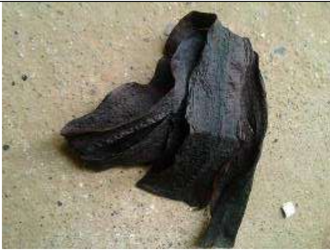
Ilustración 6- Ceba con tinte de pelo

Taller 3. Marcación y pintura en totumo, Puerto Libertador. Se realizó prueba de pintura en totumo, y rayado según diseño aprobado. Se realizó prueba con anilinas, y pintura de agua. Se realizó prueba de marcación con compas metálico haciendo rayando el totumo, y se marcó con lapicero.