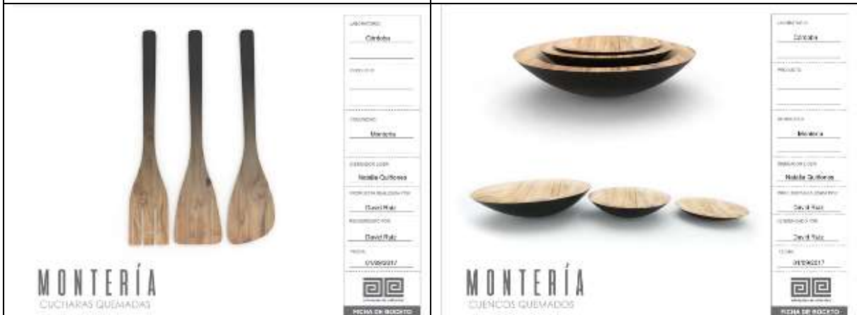
Ilustración 23-ficha boceto cucharas madera