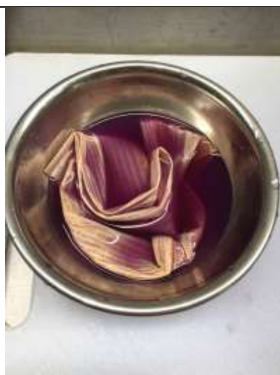
Ilustración 4-taller tintes

Taller 1; tinte natural, repollo morado. Esta prueba arrojó buenos resultados ya que la fibra no se deterioró y se obtuvo un tono morado. Consistió en introducir la fibra seca por 12 horas en agua morada obtenida de hervir repollo morado y esperando se enfríe el agua tinturada.