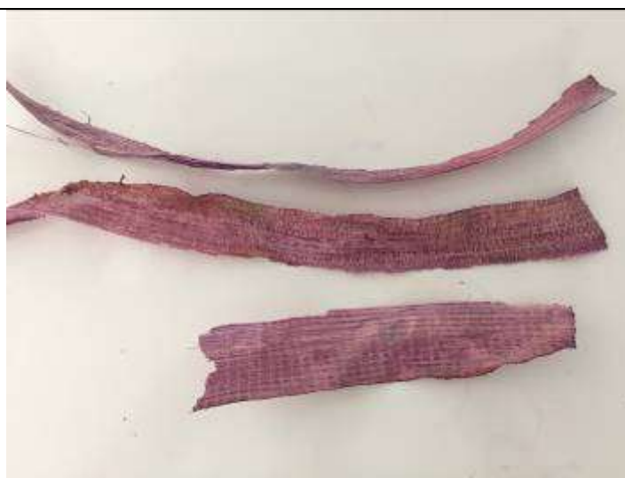
Ilustración 5-cepa tinturada

En la comunidad artesanal de los Córdoba no se tintura, se realizaron pruebas con tintura natural obtenida del repollo morado y secado con horno deshidratador.