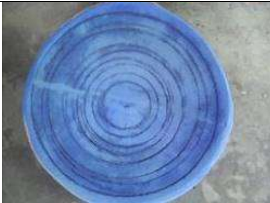
Ilustración 7-rayado en totumo

Taller 3. Marcación y pintura en totumo, Puerto Libertador. Se realizó prueba de pintura en totumo, y rayado según diseño aprobado. Se realizó prueba con anilinas, y pintura de agua. Se realizó prueba de marcación con compas metálico haciendo rayando el totumo, y se marcó con lapicero.