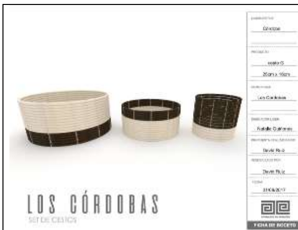
Ilustración 16-ficha boceto cestos cepa