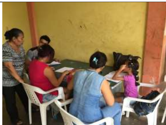
Ilustración 3- Actividad co diseño