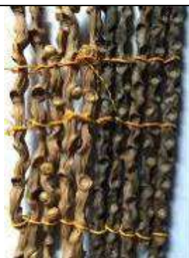
Ilustración 11-seje nylon