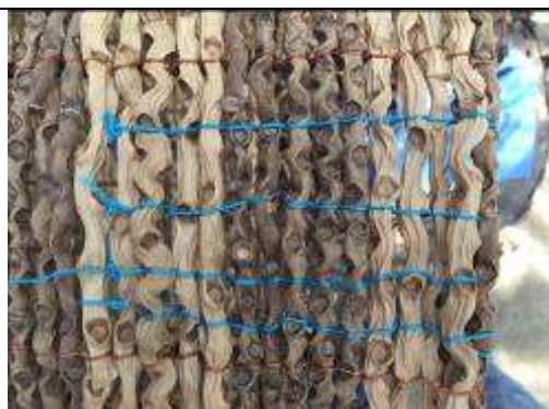
Ilustración 10-taller contrastes palma de seje nylon

Taller 5. En Ayapel según diseños aprobados se realizaron pruebas de contraste entre el nylon y la fibra.