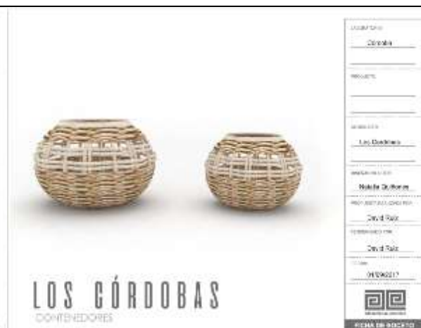
Ilustración 17-ficha boceto contenedores abiertos