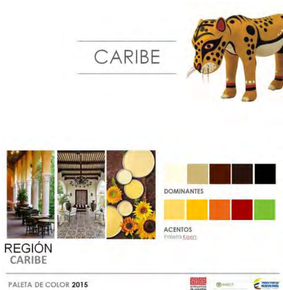
Imagen 1 Jaguar Caribe