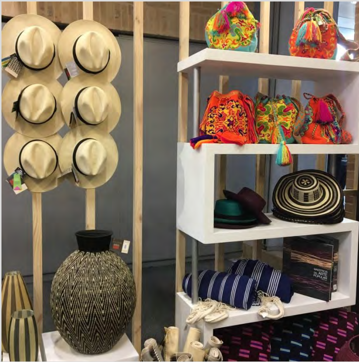
Exhibición de piezas tradicionales