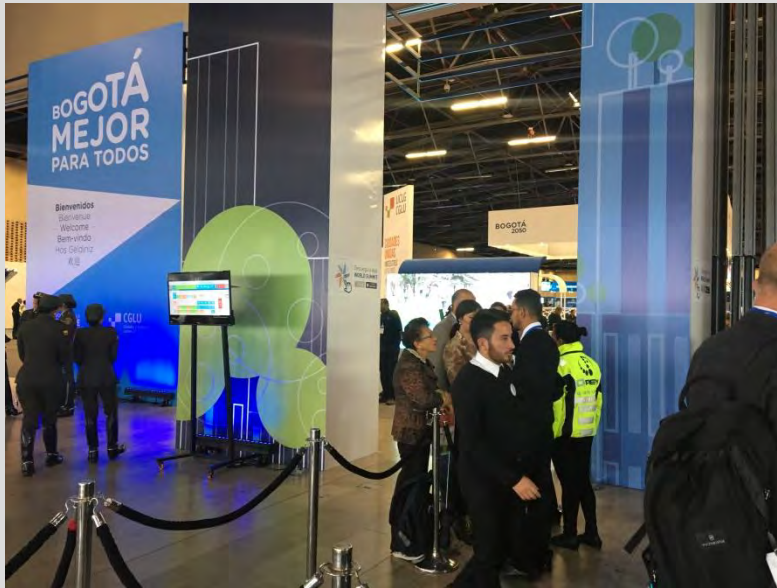
Entrada principal y registro del evento