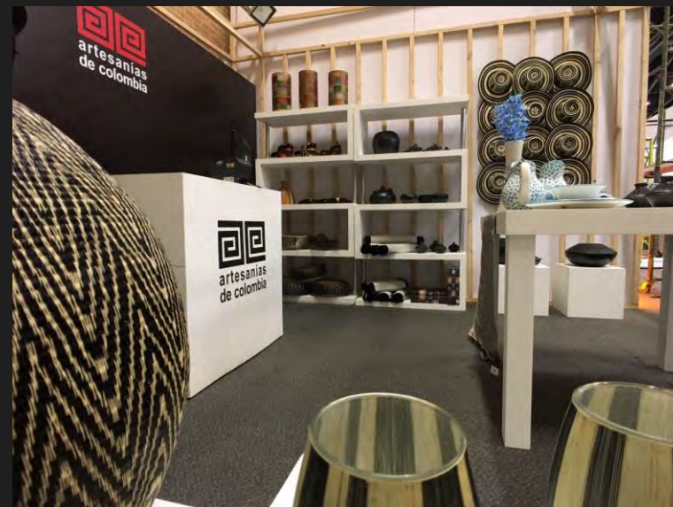
Exhibición Artesanías de Colombia