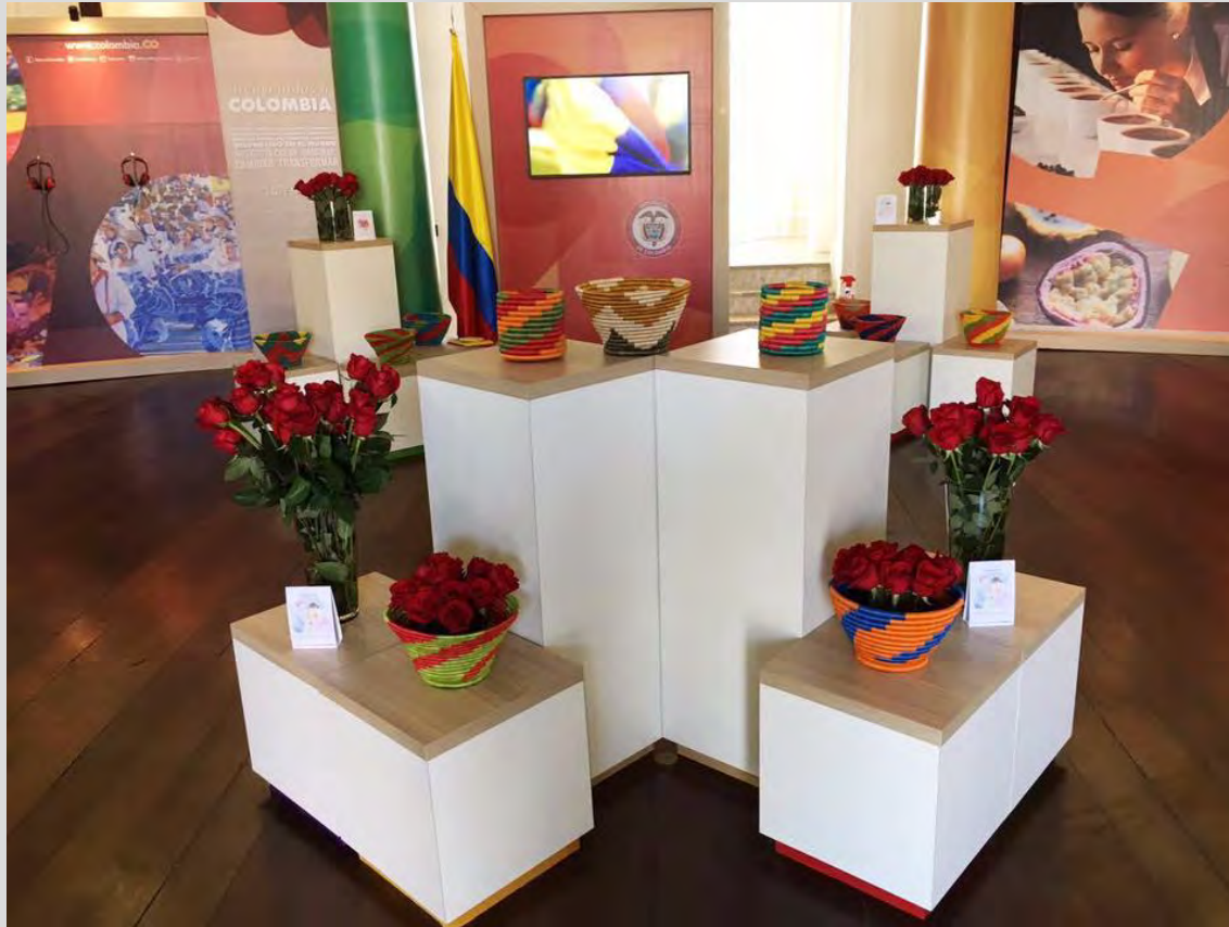
Exhibición Casa Colombia