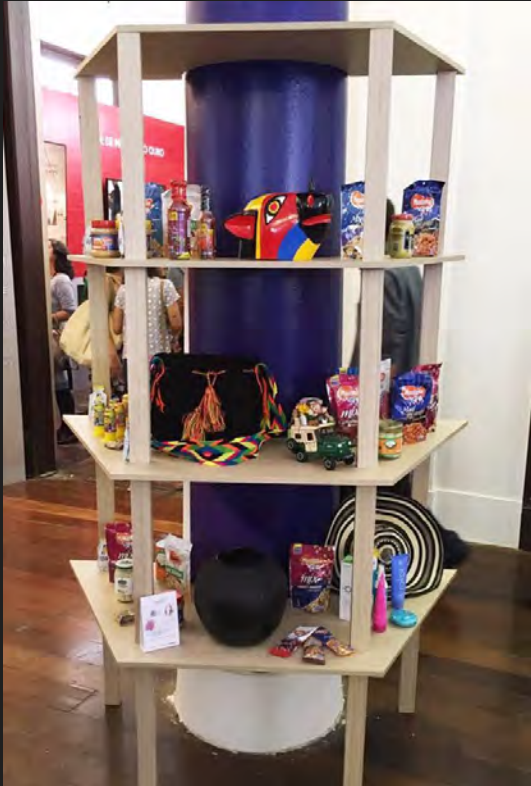
Góndola de Artesanías de Colombia