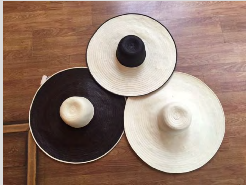
Selección de sombrerería para el pop-up store de B CAPITAL