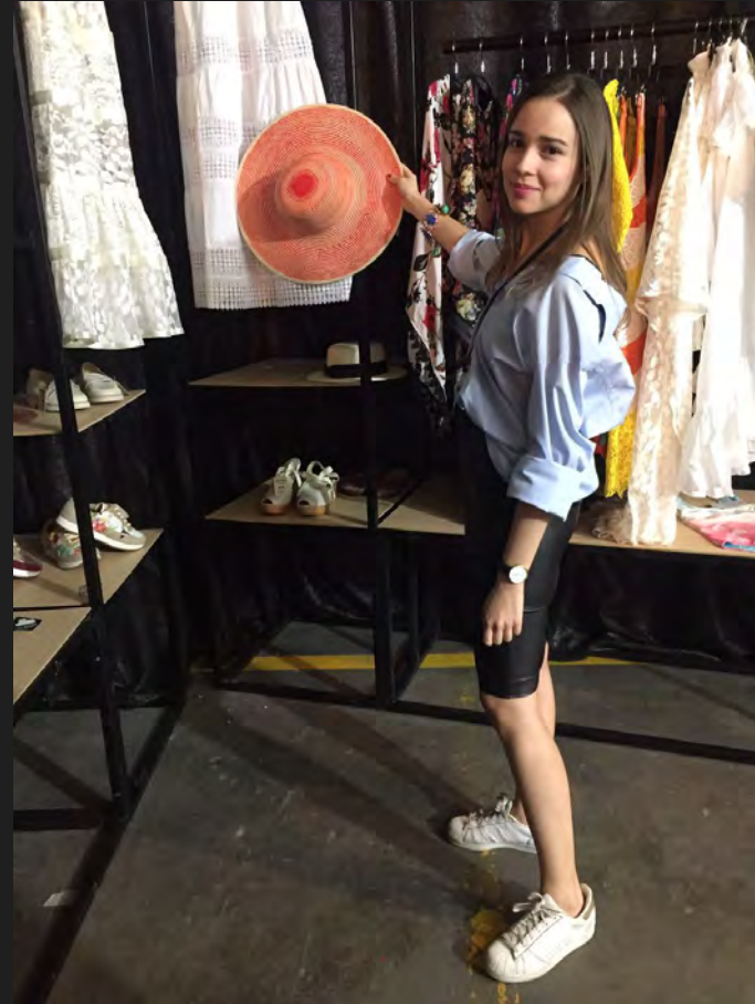
Exhibición MODA VIVA Artesanías de Colombia Pop- Up Store B CAPITAL