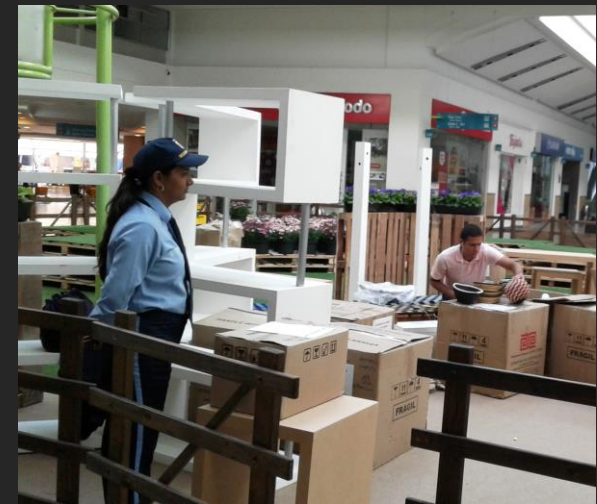
Montaje Artesanías de Colombia – 28 de julio