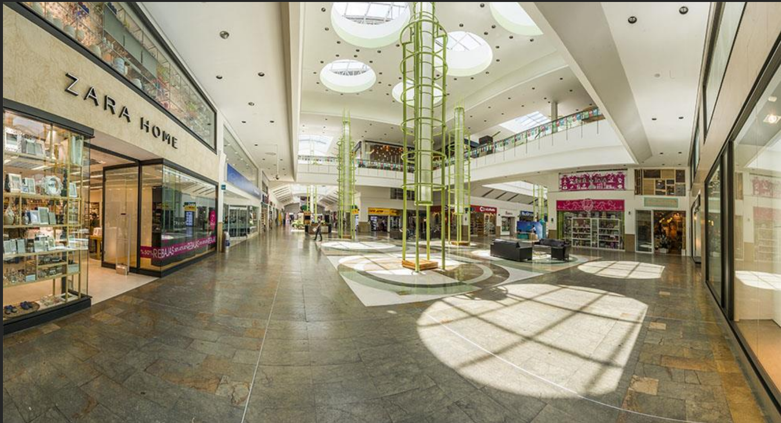
Área para montaje de Artesanías de Colombia