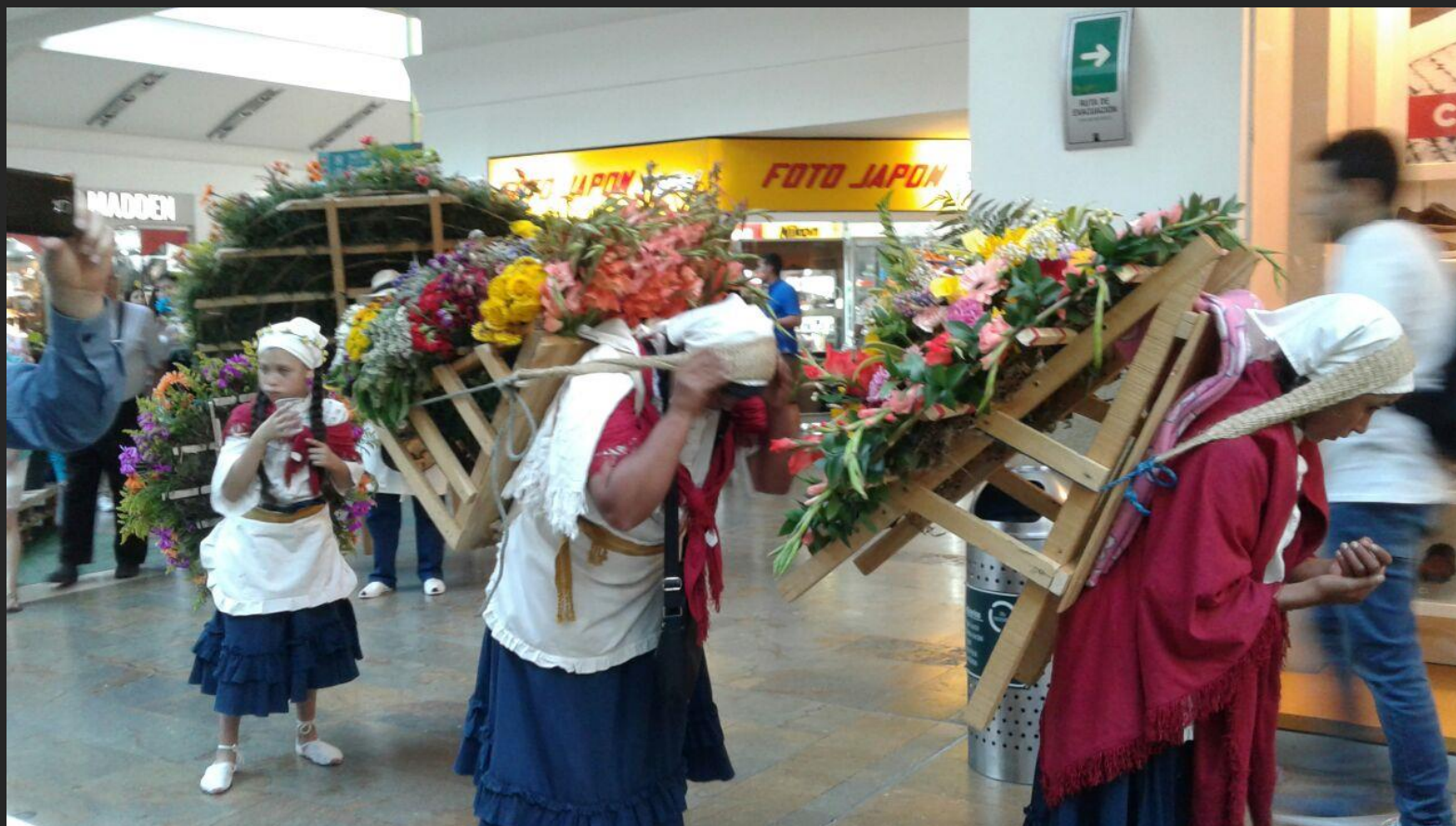
Desfile de Silleteros