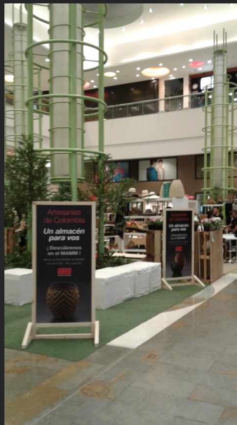
Exhibición Artesanías de Colombia