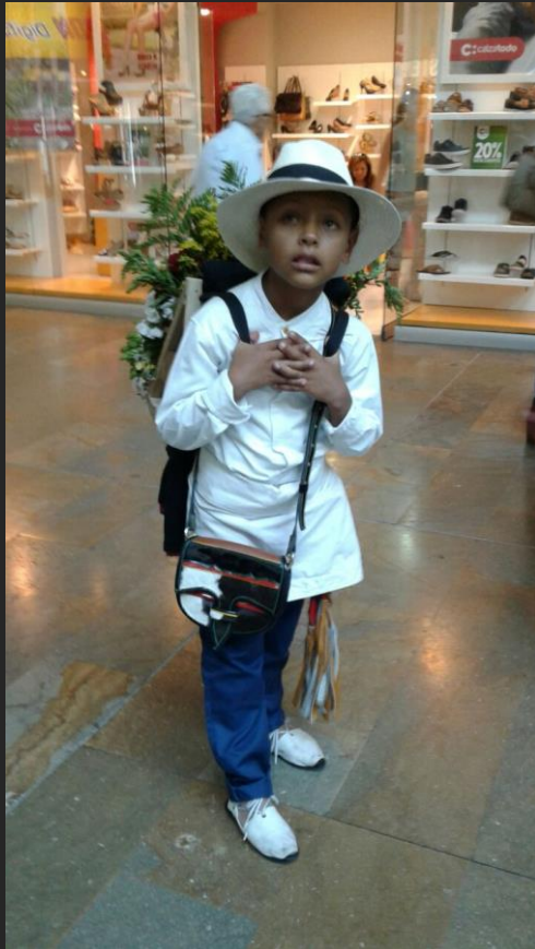
Desfile de Silleteros