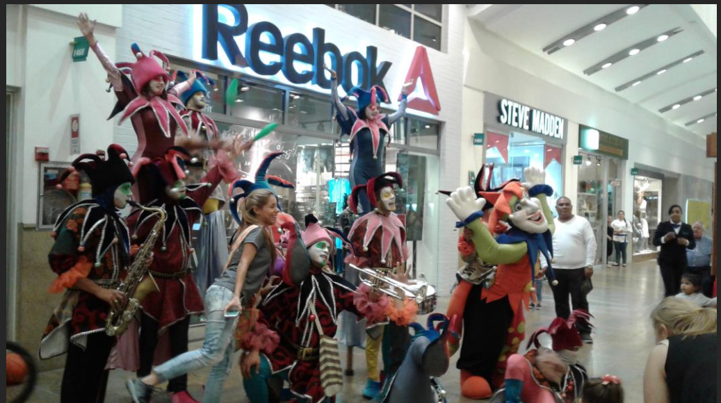
Día de Carnaval