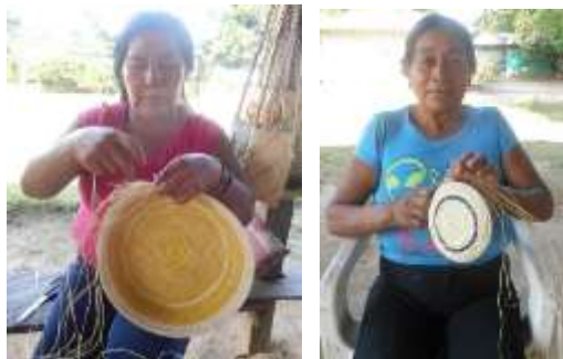
Cestería en fibra de cumare en proceso

obtener mejores resultados en producto. La asesoría se enfocó al mejoramiento de la calidad de los productos en técnicas de rollo y telar, en mediano y pequeño formato para la producción de Expoartesanías. Se logró la inclusión de 2 aprendices en tejeduría.