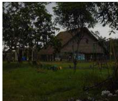
Resguardos El Refugio y Panuré

En la comunidad El Refugio existen 45 grupos de familias, identificadas 10 como artesanos, cada una de ellas representa una unidad productiva, las casas de familia son el