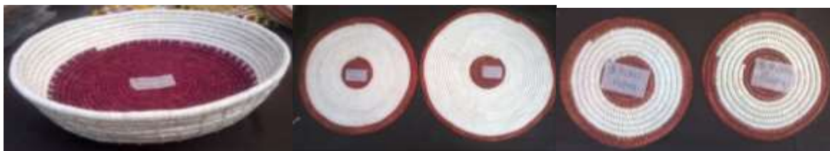
Prototipos: Contenedor, Individuales, Portavasos

Se hizo acompañamiento a los grupos artesanos en el desarrollo de nuevas propuestas de producto con identidad como estrategia para la apertura de nuevos mercados. Se entregaron recursos para compra de materias primas para la producción de prototipos, presentándose inconvenientes con el técnico en su administración y a ello se sumó que los artesanos no presentaron resultados de producción de prototipos para dar curso al proceso de diseño.