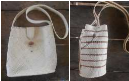
Bolsos en fibra de cumare natural / Con acentos de color

Diseño y producción de 4 Balayes Sirianos tradicionales, aplicando algunos de los símbolos trabajados durante los ejercicios de recuperación, como pieza emblemática de la comunidad para la Galería del proyecto