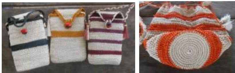
Portacelulares tejidos en rollo fino / Mochila mezclando 2 técnicas

Línea de mesa en técnica de rollo (portavasos, individuales, contenedores).