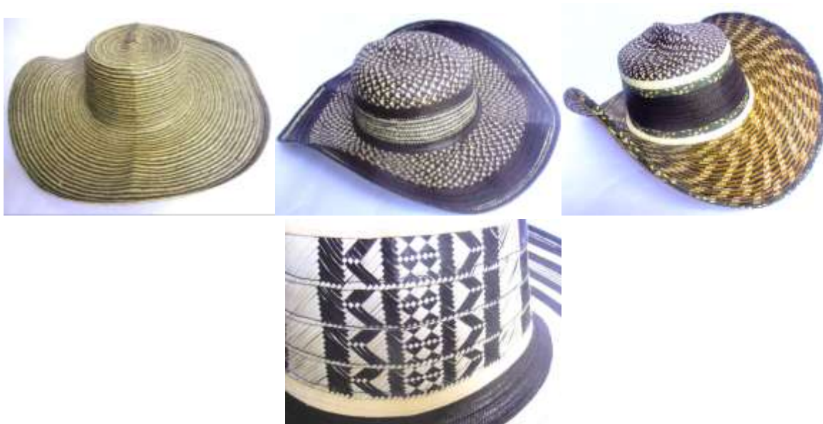
Sombreros vieltaios y detalle de tejido

En relación a los demás productos, no existe una diferenciación entre uno y otro taller artesanal, pues cuando sale un nuevo diseño, es copiado rápidamente en el mercado local de Tuchín.