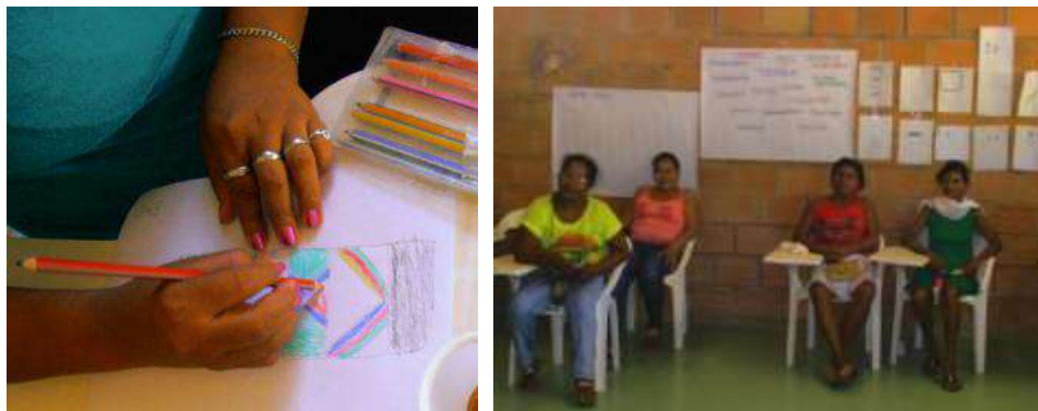
Taller de creatividad para construcción de logo símbolo.

representativo para la comunidad, mediante la identificación de valores que representan a la asociación Arte Zenú, la elaboración de bocetos para las propuestas de logotipo Arte Zenú, la presentación y selección de propuestas.