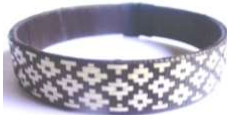
Elaboración de pulsera en tejido plano

Para las pulseras, con una segueta se corta el tubo de PVC del ancho que se desea la pulsera, con el cuchillo se retiran los excedentes que se generan con el corte, luego se pasa por una lija de grano grueso, y se raspa la pulsera con el cuchillo para redondearle los bordes y si se desea se hace otra pasada de lija. Luego se deberá cortar la pulsera transversalmente con la segueta, se pule y se lija.