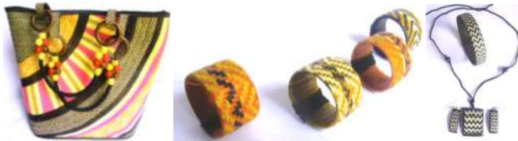
Bolso playero, anillos, collar, aretes y pulsera. Tuchín – Córdoba

participar en una feria comercial como bolsos, billeteras, tapetes, cojines, individuales, servilleteros y bisutería.