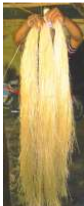
Fibra de caña flecha. Tuchín

La materia prima principal es la caña flecha ( gynerium sagittatum ), caña leñosa que alcanza un tamaño de hasta 10 metros de alto y cuatro cms de diámetro y de la cual se aprovechan las nervaduras de las hojas para la producción de artesanía. Existen tres tipos de caña flecha: Criolla, de mejor calidad, de la cual se extraen fibras hasta de 60 cms de longitud, que pueden ser ripladas en tiras muy finas. Martinera, más rústica, produce fibras largas, rígidas y quebradizas que no permiten el riplado fino y Costera: es quebradiza y poco resistente al trenzado, por eso es poco utilizada por los artesanos, pues la calidad del producto es deficiente. (Artesanías de Colombia, 2008).