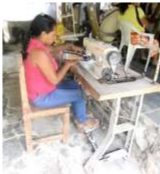
Artesana confeccionando un bolso. Tuchín