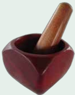
Nombre Mortero Dimensiones 12ø x 10 cm. Materia prima Palo Sangre