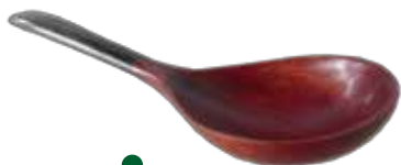
Nombre Cucharon Dimensiones 33 x 11 cm. Materia prima Palo Sangre y Chonta