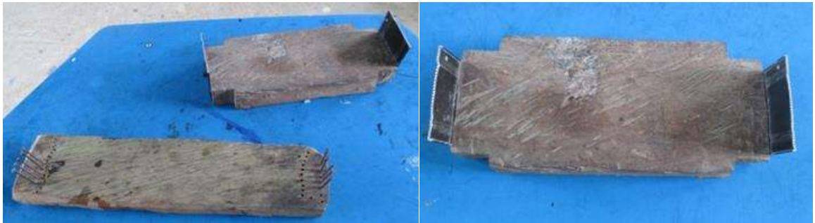
Telares o puntilleros encontrados en la comunidad

Con el fin de recuperar la simbología Embera se hizo un ejercicio de recordación con el grupo de tejedoras, sobre los diferentes dibujos geométricos con los que la etnia representa la naturaleza (animales, plantas y el universo). Se procedió a plasmarlos con las chaquiras en el telar básico, eligiendo los colores y el tamaño del objeto para elaborar manillas, collares y aretes.