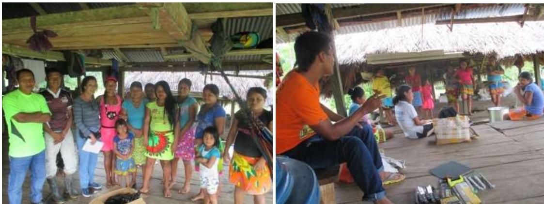
Talleres en Pescadito-Acandí-Chocó

Los dos resguardos, Chidima y Pescadito se encuentran distantes uno del otro, por lo cual las actividades se realizaron en el resguardo Pescadito. A la convocatoria asistieron 22 artesanos pertenecientes a los resguardos de Chidima y Pescadito.