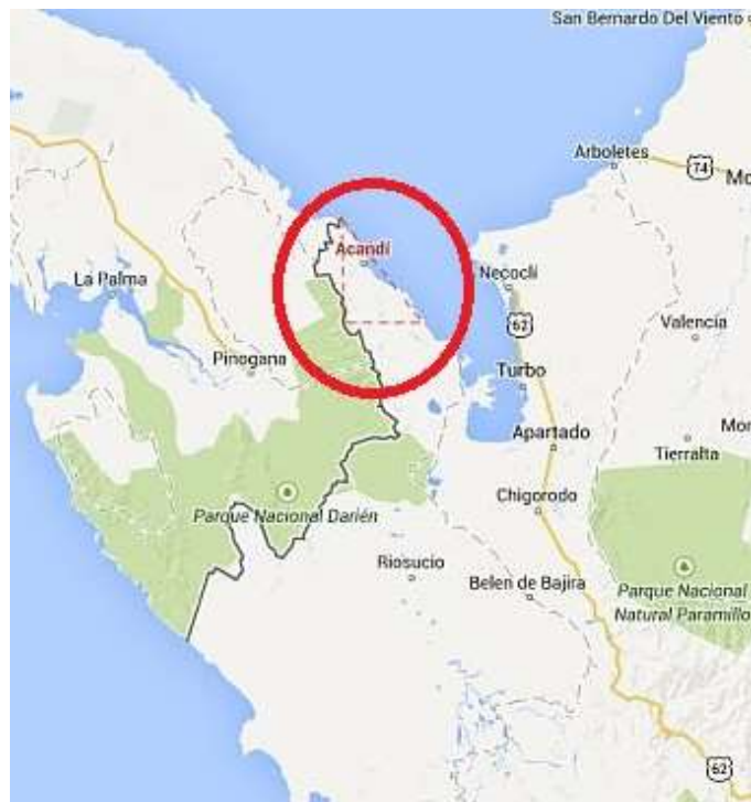
Acandí – Chocó.