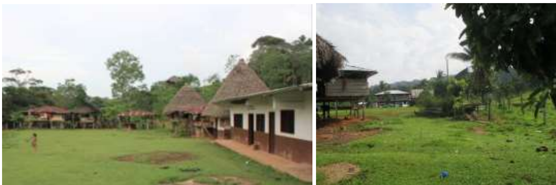
Comunidad Chidima, Resguardo Pescadito, – Acandí (2015)

Los procesos de colonización han hecho que las comunidades tengan que “sedentarizarse”. Se desatacan cuatro actividades económicas: la caza y la pesca intensiva, la agricultura, la recolección y un incipiente intercambio comercial. En enero preparan el terreno para sembrar, en febrero tumban árboles para sembrar plátano.