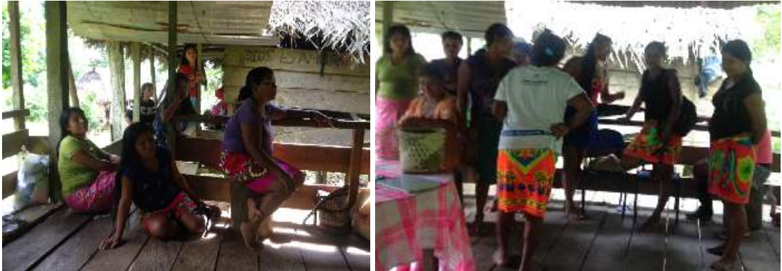
Revisión de los productos y sus costos

Se identificó el volumen de producción para organizar sus tiempos y lograr cumplir con compromisos y se les preparó para participar en el encuentro regional en Medellín y en el Encuentro de Economías Propias en el marco de Expoartesanías 2015.