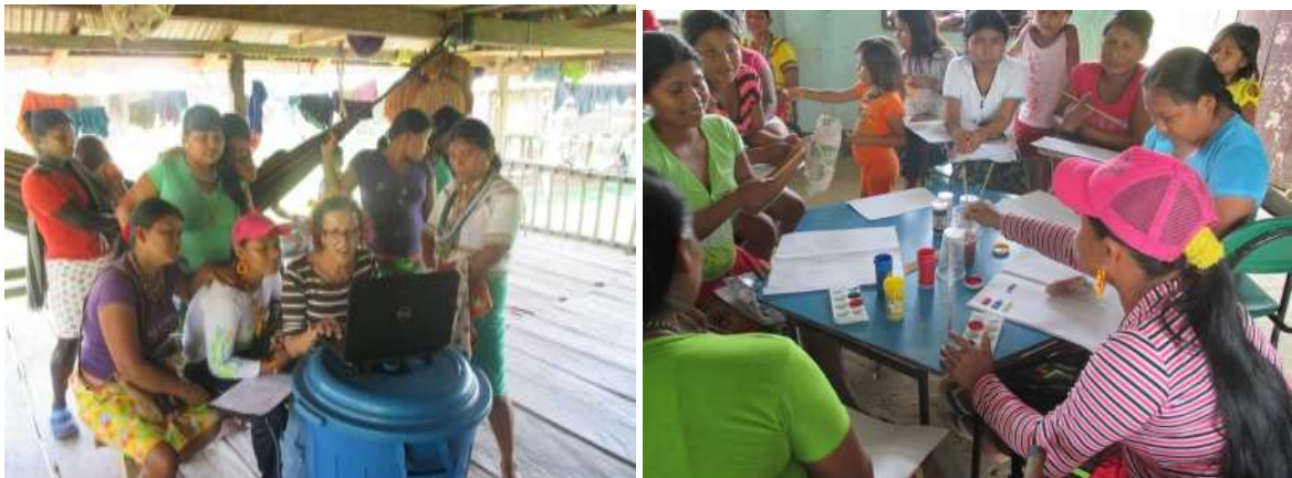
Taller Teoría del color – Comunidad Pescadito

Se llevó a cabo un taller de Teoría del color a fin de que las artesanas combinen mejor los colores ya que se observa en los productos falencias en la combinación de los colores. Se hizo el ejercicio de teoría del color básica, colores primarios, secundarios y terciarios con material pedagógico, (cartulinas, pinceles, témperas, etc.).