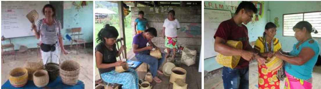
Evaluación de producto en cestería

Se hizo acompañamiento para mejorar los procesos colectivos de organización social y se dio énfasis para retomar la simbología Embera para el desarrollo de productos con identidad y fortalecimiento de su cultura.