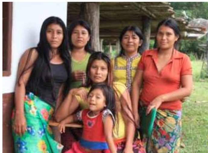
Mujeres Emberá de Chidima - Acandí (2015)

Los Emberá han logrado mantener su legado cultural y tradiciones, gracias a la configuración ritual del Jaibanismo o comunicación con los espíritus. De esta forma, a partir de los recados de los Jai canalizados por el Jaibaná, los Emberá regulan sus actividades, el cuidado médico, al igual que su territorialidad (Vargas, 1986). En Chidima no cuentan con un propio Jai y eventualmente, cuando alguien está enfermo viene un Jai de Turbo o Apartado.