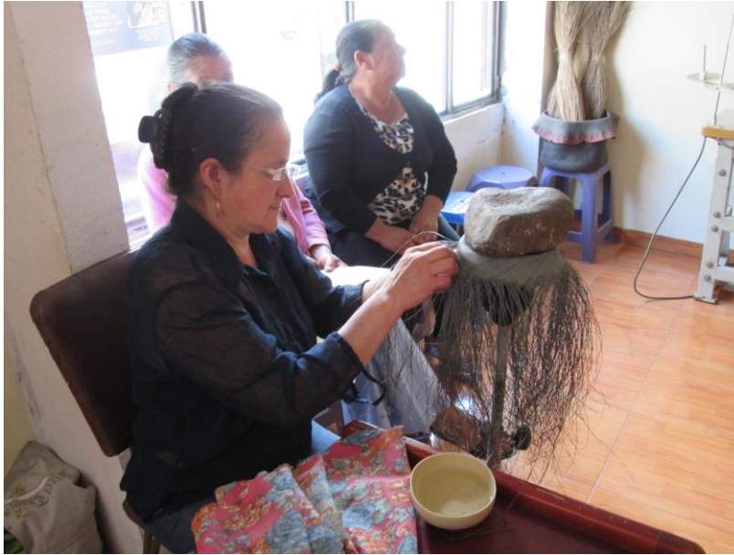
Socialización. Asociación Renacer, La Florida (Nariño). Proyecto Hilando redes humanas de vida. Artesanías de Colombia. Gobernación de Nariño. Fundación Emssanar. Por: Christian Garzón.