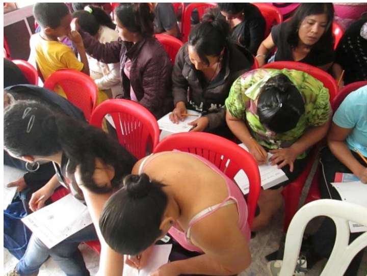
Taller 3. Asociación Taller Juanita Castillo, Sandoná (Nariño). Proyecto Hilando redes humanas de vida. Artesanías de Colombia. Gobernación de Nariño. Fundación Emssanar. Por: Christian Garzón.

También se empieza a desarrollar el análisis de los habitáculos de trabajo y los posibles materiales a utilizar tanto en el prototipo como en la producción de los productos que vendrían más adelante.