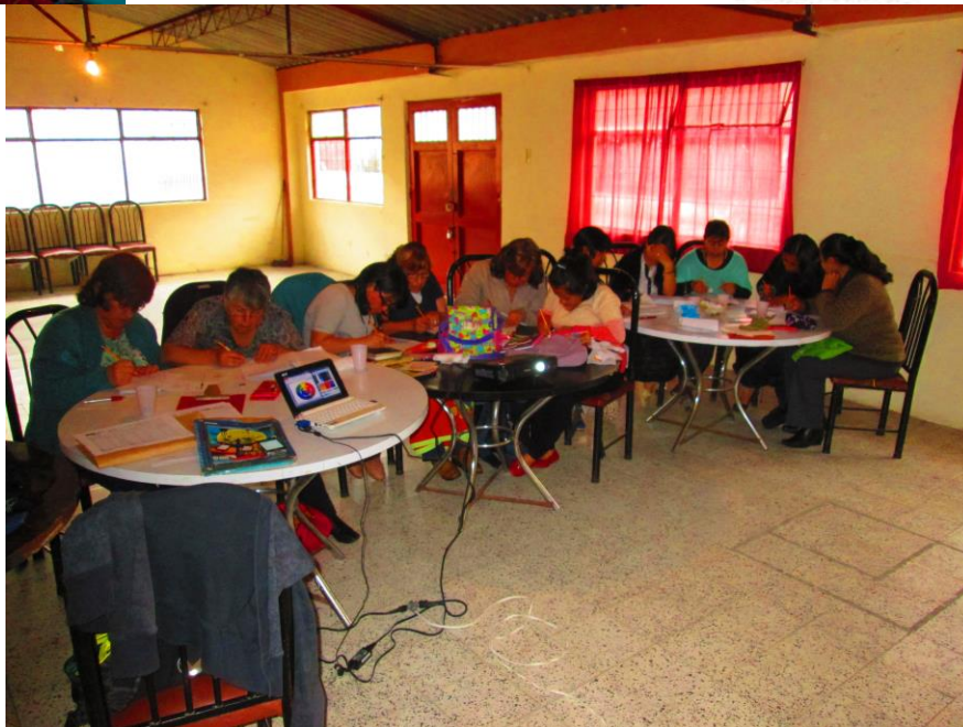
Taller 4. Asociación Agujitas de Lucy, Pasto (Nariño). Proyecto Hilando redes humanas de vida. Artesanías de Colombia. Gobernación de Nariño. Fundación Emssanar.