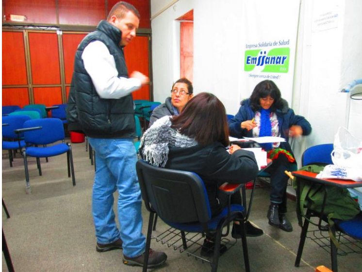
Taller 4. Artesanos independientes, Pasto (Nariño). Proyecto Hilando redes humanas de vida. Artesanías de Colombia. Gobernación de Nariño. Fundación Emssanar.