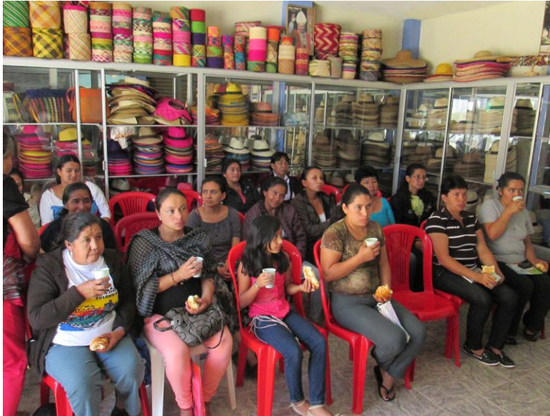
Taller 2. Asociación Taller Juanita Castillo, Sandoná (Nariño). Proyecto Hilando redes humanas de vida. Artesanías de Colombia. Gobernación de Nariño. Fundación Emssanar.

lado, los resultados visuales logrados fueron muy buenos y se puede decir que quedó un buen banco de ideas para su posterior desarrollo y ejecución.