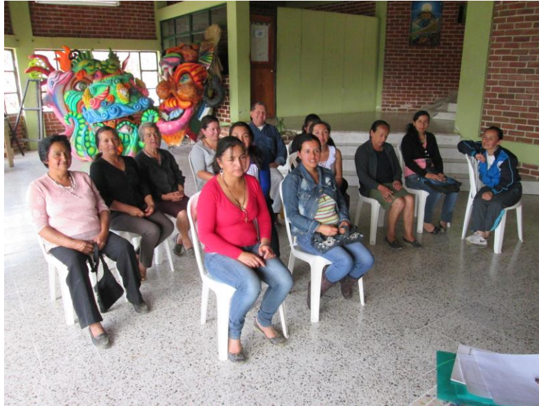
Socialización. Asociación Aproarte, La Florida (Nariño). Proyecto Hilando redes humanas de vida. Artesanías de Colombia. Gobernación de Nariño. Fundación Emssanar.

ningún acompañamiento de Artesanías de Colombia, ni tampoco ninguna capacitación por parte de cualquier otra institución. No tienen un espacio para trabajar como asociación ni punto de exhibición para sus productos.