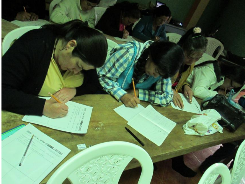
Taller 1. Asociación Tejedoras de Red, Guaitarilla (Nariño). Proyecto Hilando redes humanas de vida. Artesanías de Colombia. Gobernación de Nariño. Fundación Emssanar. Por: Christian Garzón.