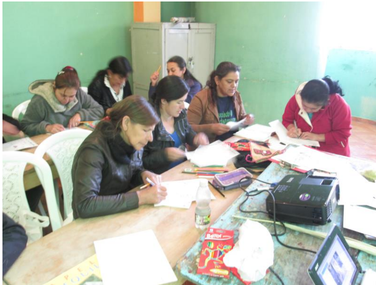
Taller 3. Asociación Tejedoras de red, Guaitarilla (Nariño). Proyecto Hilando redes humanas de vida. Artesanías de Colombia. Gobernación de Nariño. Fundación Emssanar. Por: Christian Garzón.

El taller práctico presentó algunas dificultades en un principio por que era difícil de comprender para ellas y por que no se sentían cómodas dibujando ya productos o cosas que tienen cierta complejidad al bocetar. Sin embargo, poco a poco las asistentes se apropiaron del ejercicio y empezaron a salir de lo convencional y evidente, a lo creativo y explorativo. Mostraron su gusto por tratar de ornamentar sus piezas y acentuar sus propiedades estéticas. El grupo de artesanas están ansiosas por innovar y mostrar todo el talento que tienen en sus manos.