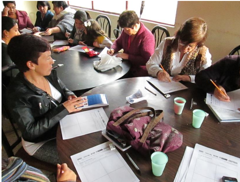
Taller 1. Asociación Agujitas de Lucy, Pasto (Nariño). Proyecto Hilando redes humanas de vida. Artesanías de Colombia. Gobernación de Nariño. Fundación Emssanar.

hicieron preguntas al azar para hacer un paneo de la retentiva de ellas, y constataron correctamente lo cual es un punto positivo para la capacitación.