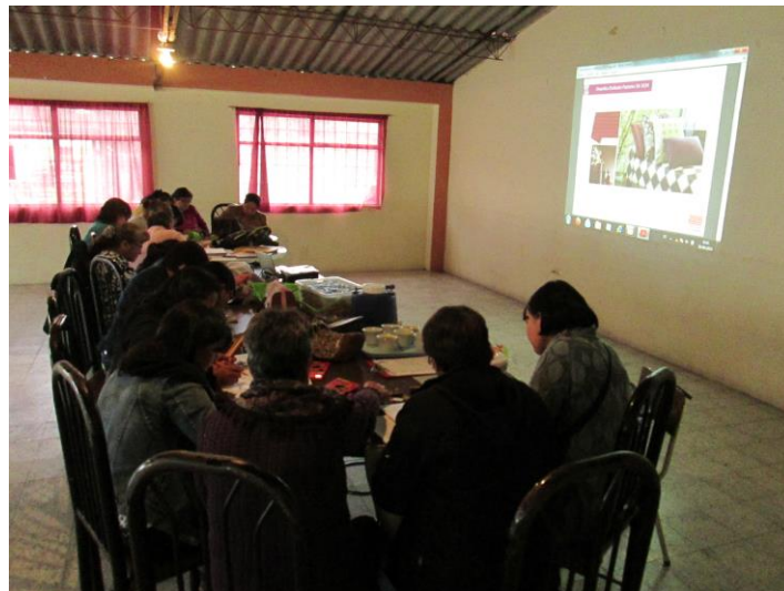
Taller 3. Asociación Agujitas de Lucy, Pasto (Nariño). Proyecto Hilando redes humanas de vida. Artesanías de Colombia. Gobernación de Nariño. Fundación Emssanar. Por: Christian Garzón.

Se habló a cerca de los materiales que vendrían con el proyecto, y ellas expresaron su intención de lograr recibir una máquina para la asociación y no herramientas o kits de herramientas personales como se tiene planteado inicialmente. La asociación esta muy bien consolidada y organizada. Cuentan con un clima organizacional familiar y de liderazgo, por lo cual es totalmente PERTINENTE la llegada de una maquinaria, dado que al estar en sus manos se asegura un eficiente aprovechamiento en el desarrollo de sus oficios artesanales.