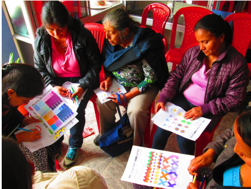
Taller 4. Asociación Taller Juanita Castillo, Sandoná (Nariño). Proyecto Hilando redes humanas de vida. Artesanías de Colombia. Gobernación de Nariño. Fundación Emssanar.