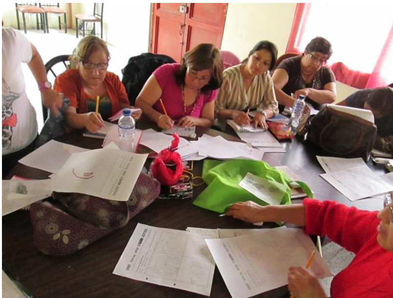
Taller 2. Asociación Agujitas de Lucy, Pasto (Nariño). Proyecto Hilando redes humanas de vida. Artesanías de Colombia. Gobernación de Nariño. Fundación Emssanar. Por: Christian Garzón.

Como en cada encuentro, se desarrolló al final de la clase la evaluación del asesor y la actividad y posteriormente se procedió a la despedida. Las mujeres salieron cansadas, pero con un gran alivio de poder entender estos temas de diseño y observar que son métodos totalmente aplicables a su oficio.