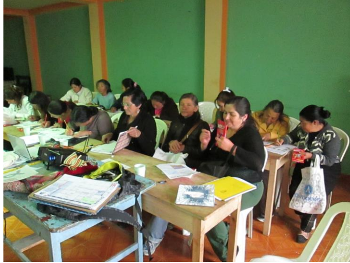
Taller 4. Asociación Tejedoras de red, Guaitarilla (Nariño). Proyecto Hilando redes humanas de vida. Artesanías de Colombia. Gobernación de Nariño. Fundación Emssanar.