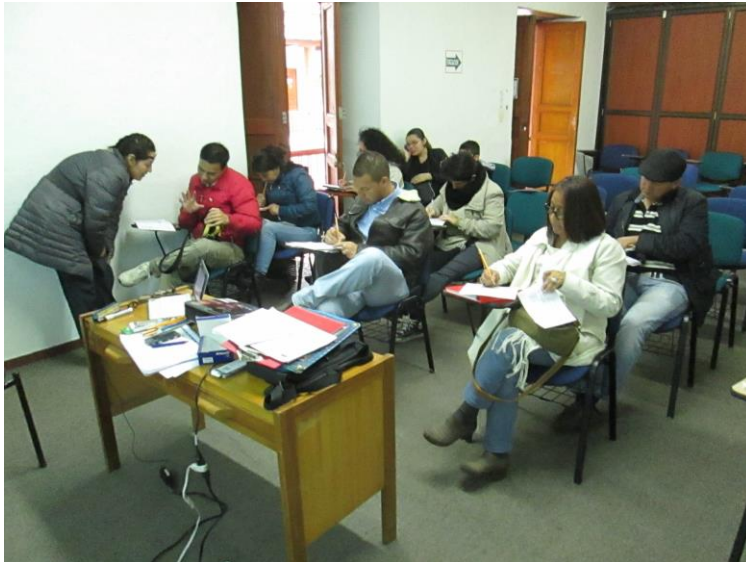
Taller 1. Artesanos independientes, Pasto (Nariño). Proyecto Hilando redes humanas de vida. Artesanías de Colombia. Gobernación de Nariño. Fundación Emssanar. Por: Christian Garzón.

Se desarrolló el taller de referentes, encontrándose gratamente con personas muy talentosas en el dibujo lo cual ayuda a una mejor exploración dentro de la orientación a la innovación que tiene el curso. Teniendo en cuenta lo anterior se lograron obtener excelentes referentes para su posible uso en etapas posteriores.