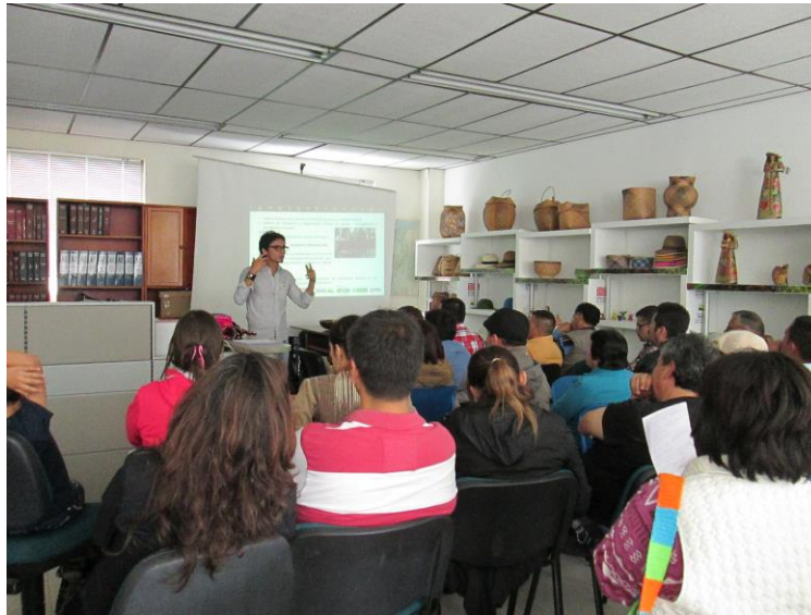
Socialización. Artesanos independientes, Pasto (Nariño). Proyecto Hilando redes humanas de vida. Artesanías de Colombia. Gobernación de Nariño. Fundación Emssanar.

repartieron a los artesanos para lograr la cobertura completa y se intentará desarrollar un trabajo muy explorativo para que ellos puedan encontrar nuevos caminos creativos para la ejecución de sus productos.