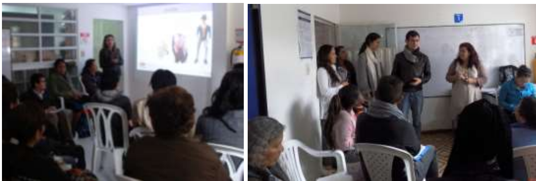
Presentación del proyecto en Bosa. Septiembre 2015.

Orientado al trabajo con las mujeres emprendedoras de Bogotá, quienes se mostraron muy interesadas en participar del proyecto y expresaron sus expectativas.