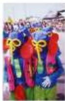
• Referentes culturales