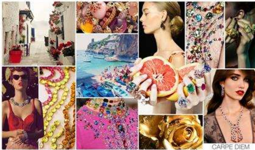
Límites exagerados de los detalles