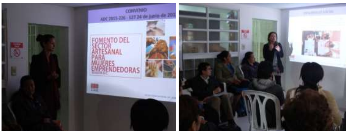
Presentación del proyecto en Usme. Septiembre 2015.

Los módulos de Diseño y Producción son presentados por los Diseñadores asistentes.