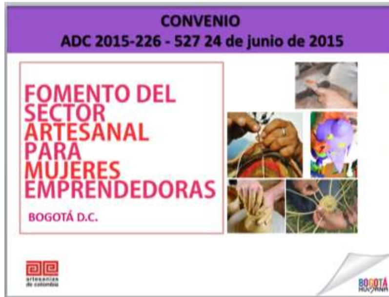
Diapositiva 1, Presentación Perfil Proyecto Mujeres Bogotá. Sep. 2015. Equipo base

Por medio de esta presentación se da a conocer el proyecto a las mujeres que participaran en él. Se enfatiza en la explicación de las entidades que forman parte del convenio y se hace una presentación del equipo, señalando aquellos responsables de cada módulo.