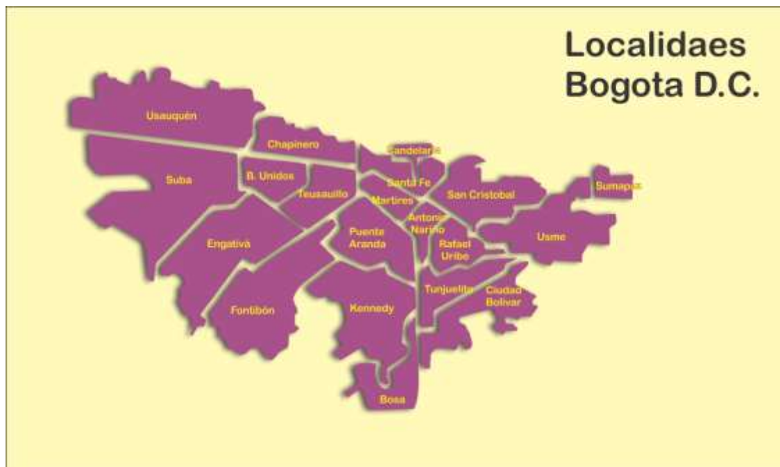
Mapa de Bogotá por Localidades. Sep. 14 de 2015, Artesanías de Colombia.