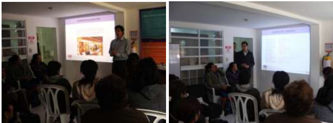
Presentación del proyecto en Bosa. Septiembre 2015.