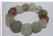
• Referentes naturales