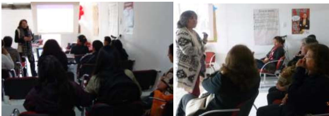
Presentación del proyecto en Ciudad Bolívar- Tunjuelito. Septiembre 2015.

Los puntos iniciales fueron presentados por Artesanías de Colombia y la Secretaria Distrital de la Mujer hizo presencia con diferentes representantes en cada reunión, quienes se encargaron de explicar de forma detallada las diapositivas correspondientes a su institución.