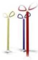
Aplicación en producto