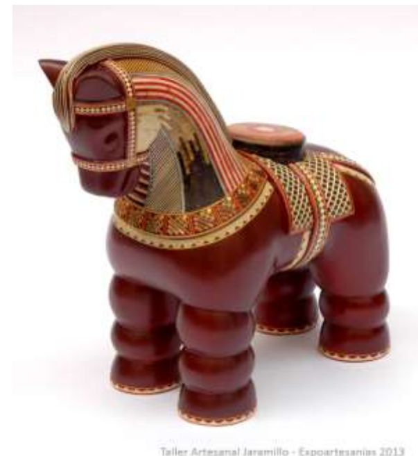
Taller Artesanal Jaramillo - Expoartesanas 2013

Tiene como misión la de “Liderar y contribuir al mejoramiento integral de la actividad artesanal mediante el rescate y la preservación de los oficios y la tradición, promoviendo la competitividad apoyando la investigación, el desarrollo de productos, la transferencia de metodologías, el mercadeo y la comercialización; todo en un contexto de descentralización y desarrollo de capacidades locales y regionales, de manera que asegure la sostenibilidad de la actividad artesanal y el bienestar de los artesanos.”