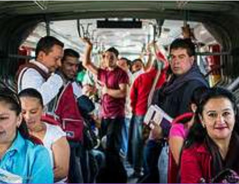
Vida libre de violencia

La Política Pública de Mujeres y Equidad de Género prioriza 8 derechos de las mujeres en Bogotá: