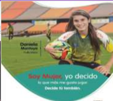
Cultura libre de sexismo