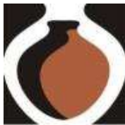
La Chamba Marca Colectiva