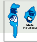
Acuerdo de San Andrés y Providencia