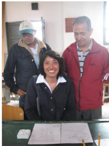
Taller de Diseño Zipaquirá – Talla en Sal Fotografías: Adriana Sáenz Forero – Artesanías de Colombia S.A.