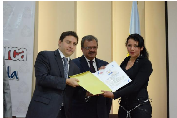
Entrega de Sello a Artesanos certificados de Fúquene Gobernación de Cundinamarca – Salón de los Gobernadores – Bogotá 8 de agosto de 2012