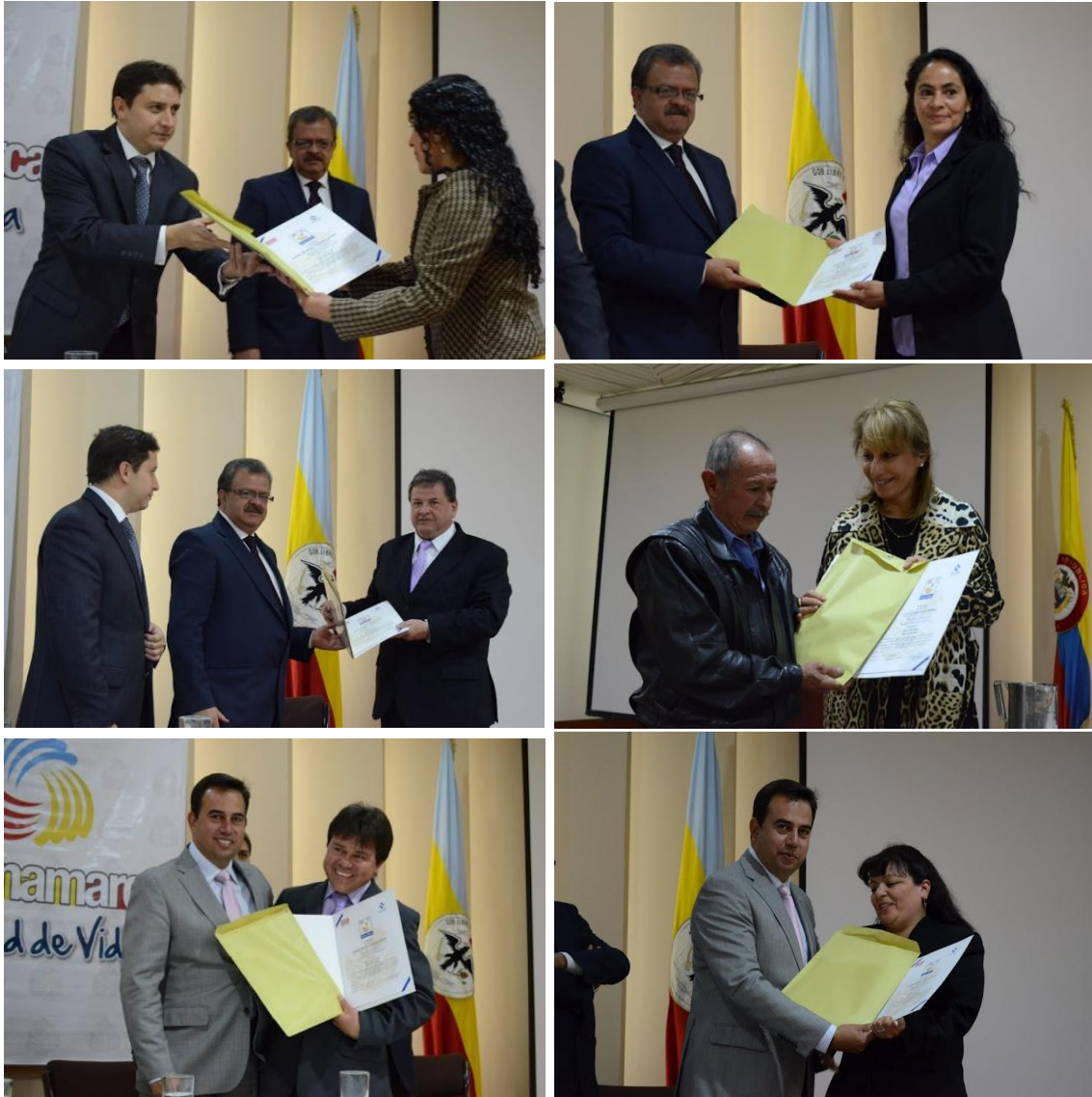
Entrega de Sello a Artesanos certificados de Zipaquirá Gobernación de Cundinamarca – Salón de los Gobernadores – Bogotá 8 de agosto de 2012