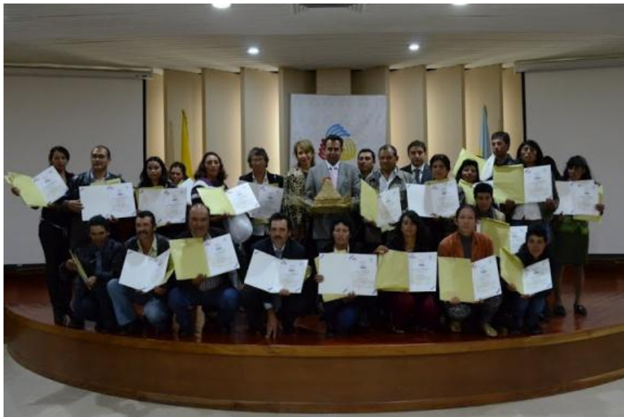
Artesanos certificados de Fúquene Gobernación de Cundinamarca – Salón de los Gobernadores – Bogotá 8 de agosto de 2012