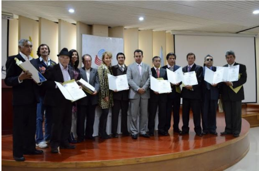
Artesanos certificados de Cucunubá Gobernación de Cundinamarca – Salón de los Gobernadores – Bogotá 8 de agosto de 2012