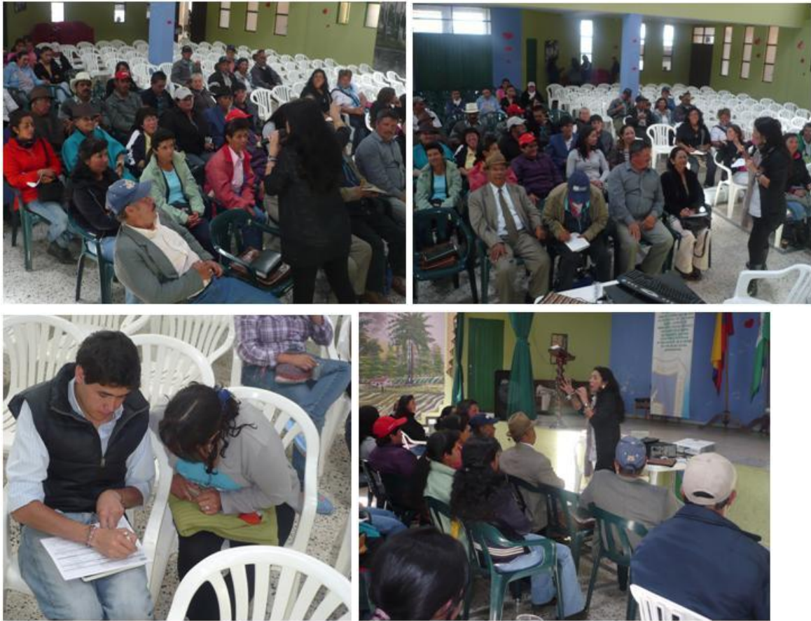
Taller de Socialización del proyecto y presentación de esquemas de certificación en calidad y Sello Hecho a Mano para la Artesanía Municipio de Fúquene. Septiembre 23 de 2011