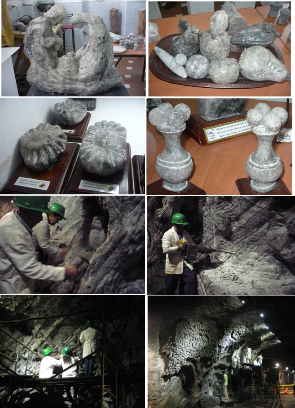
Actividad de talla en mural en la catedral de Sal de Zipaquirá Octubre 12 de 2011