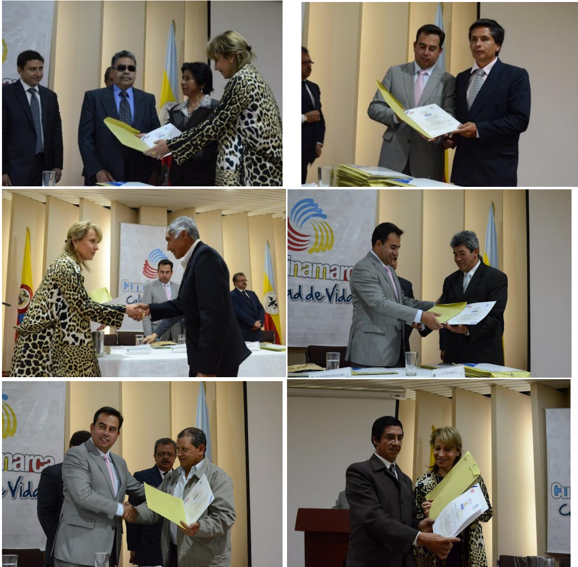
Entrega de Sello a Artesanos certificados de Cucunubá Gobernación de Cundinamarca – Salón de los Gobernadores – Bogotá 8 de agosto de 2012