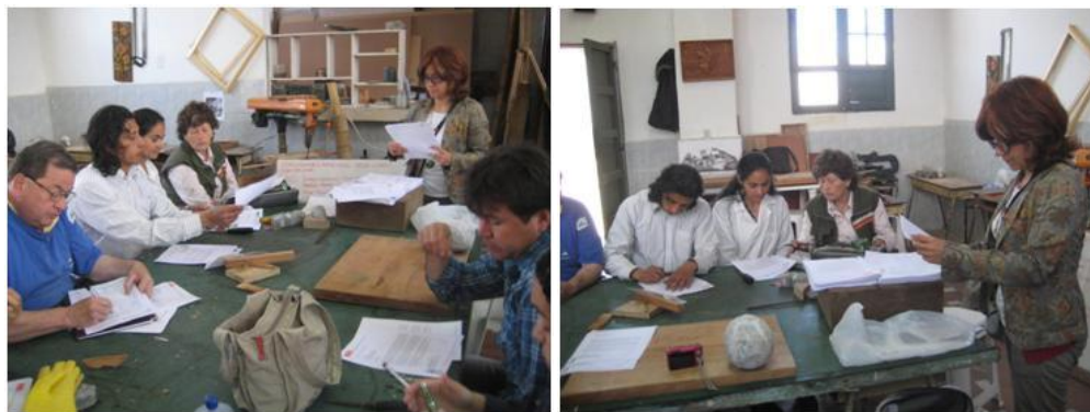
Taller construcción del referencial para Talla en sal Zipaquirá – Cundinamarca