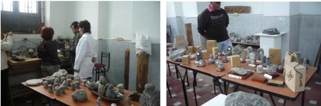
Taller de talla y exhibición de la producción Zipaquirá

Como resultado de esta actividad se elaboró el documento referencial, el cual fue revisado con los artesanos posteriormente sobre lo cual se suscribió Acta (Anexo 27 Acta revisión referencial Zipa)