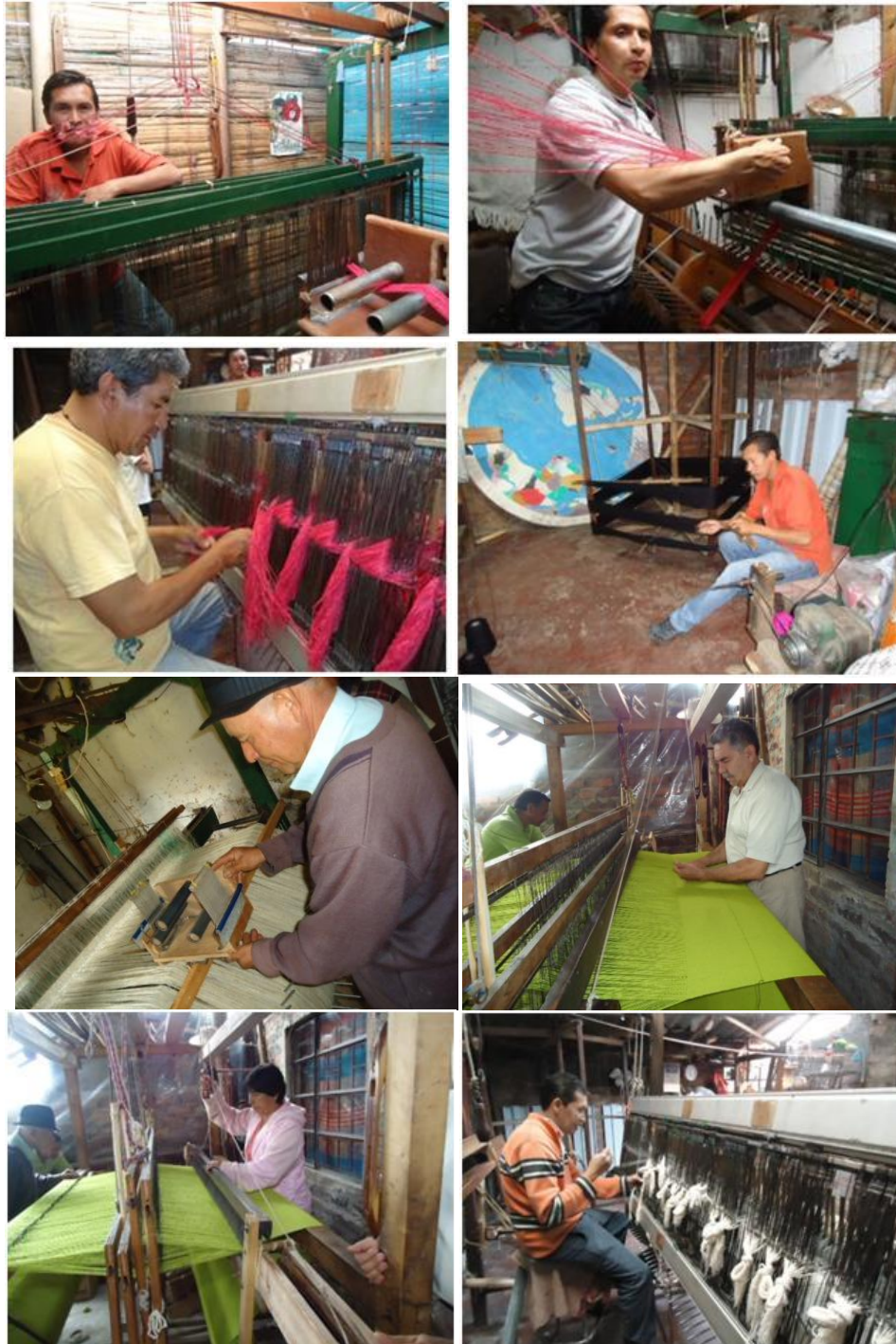
Artesanos de Cucunubá en sus talleres Municipio de Cucunubá. Octubre de 2011