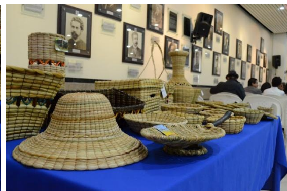
Exposición de productos de los artesanos que se certificaron en tejeduría en telar – Capítulo Cucunubá, Talla en Sal – Zipaquirá y Cestería en Junco y Enea Gobernación de Cundinamarca – Salón de los Gobernadores – Bogotá 8 de agosto de 2012