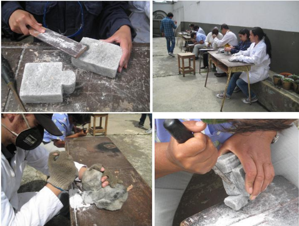
Artesanos tallando sal Zipaquirá – Cundinamarca