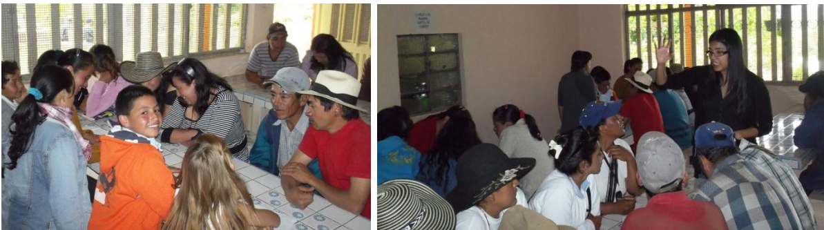
Taller construcción del referencial de cestería en junco y enea por parte de los artesanos.

Como resultado de esta actividad se elaboró el documento referencial.