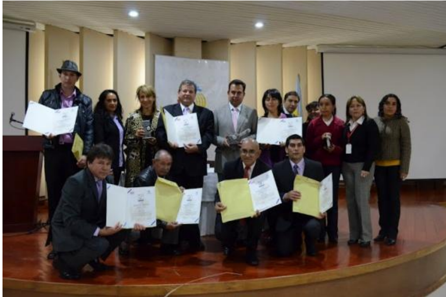
Artesanos certificados de Zipaquirá

Gobernación de Cundinamarca – Salón de los Gobernadores – Bogotá 8 de agosto de 2012