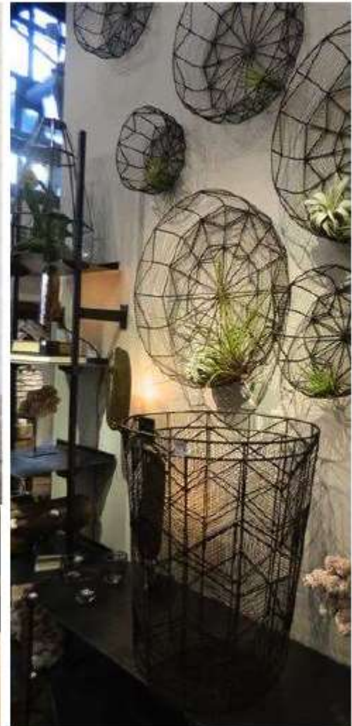
Detalles naturales y patrones geométricos