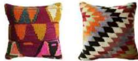
Saturación en objetos completos