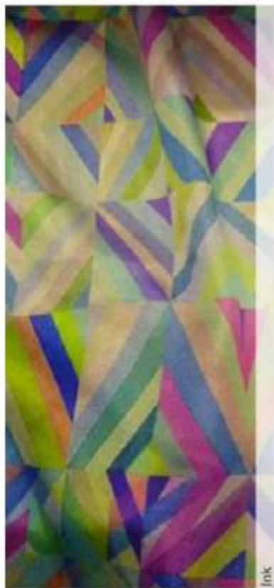
Geometrías en alto contraste