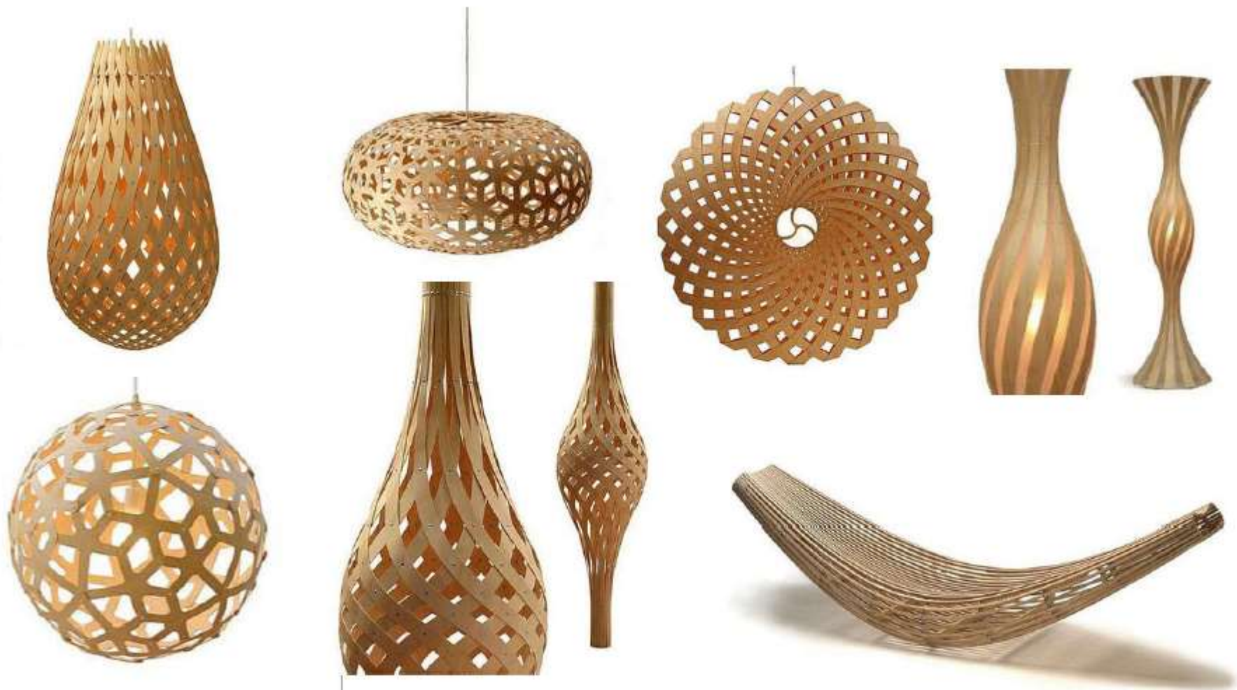
Implementación de técnicas de tejido y planos seriados