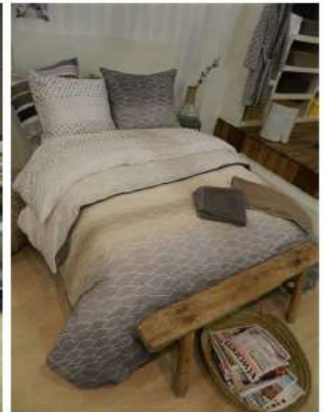
Técnicas de mano alzada para el trabajo gráfico en los textiles