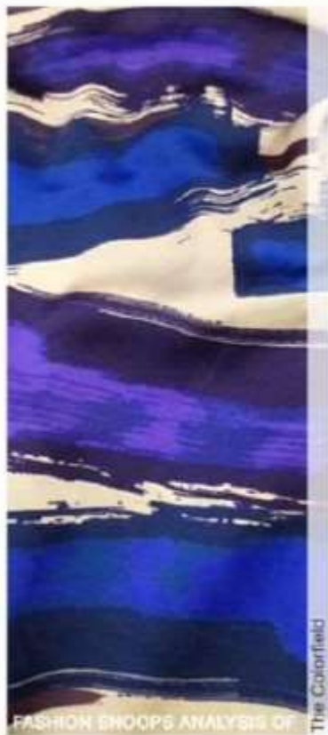
Técnicas a Mano alzada