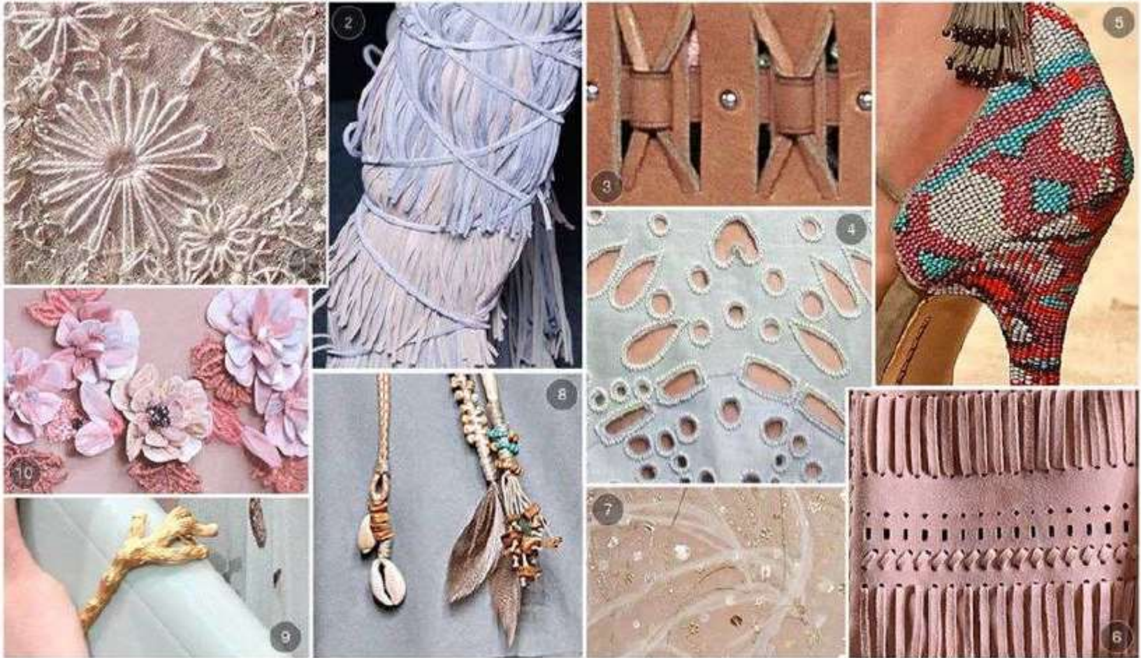
Tratamientos al material base