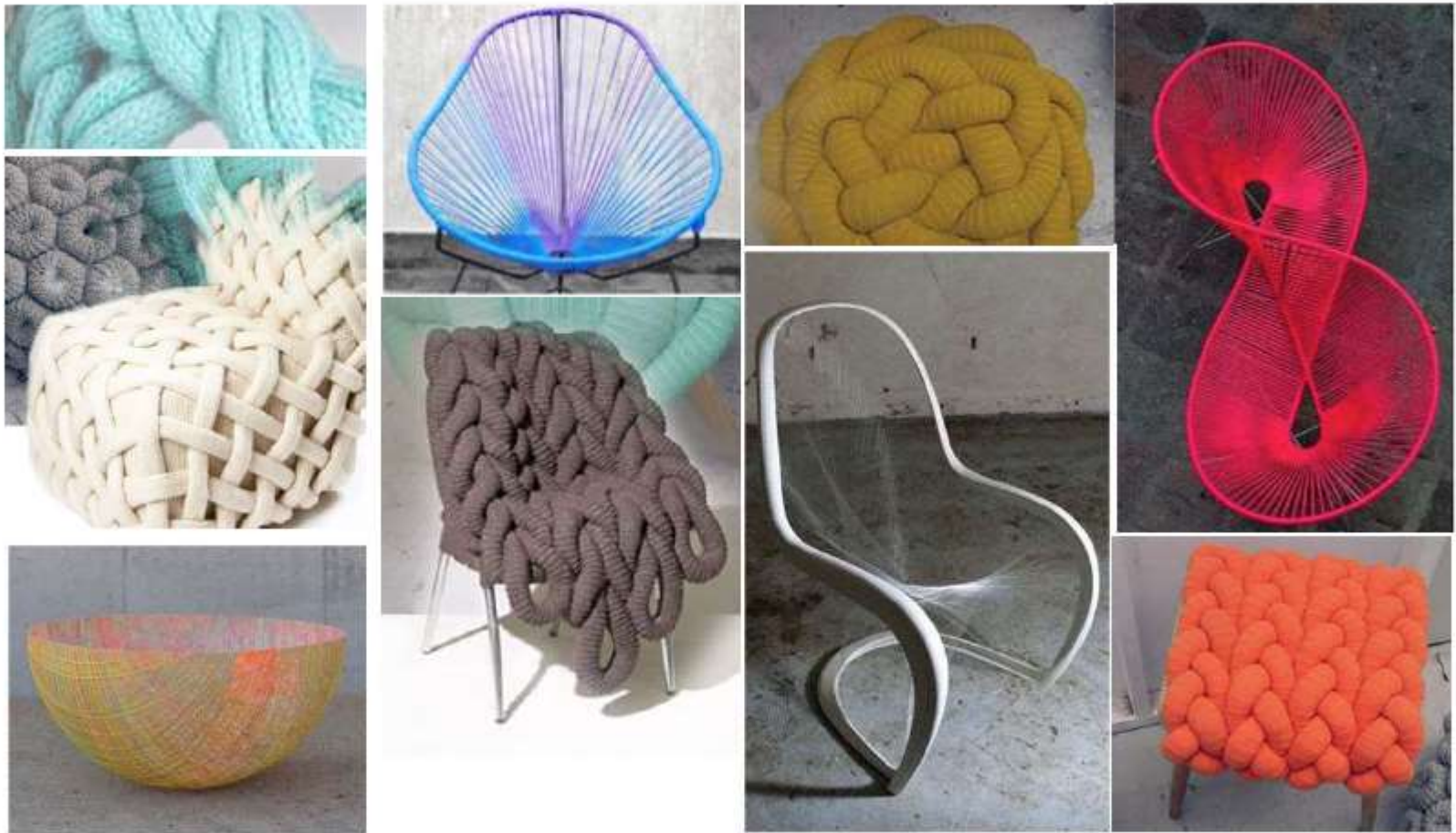
Exaltación de la forma a partir de la estructura.