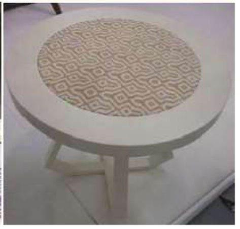
Mezcla de materiales