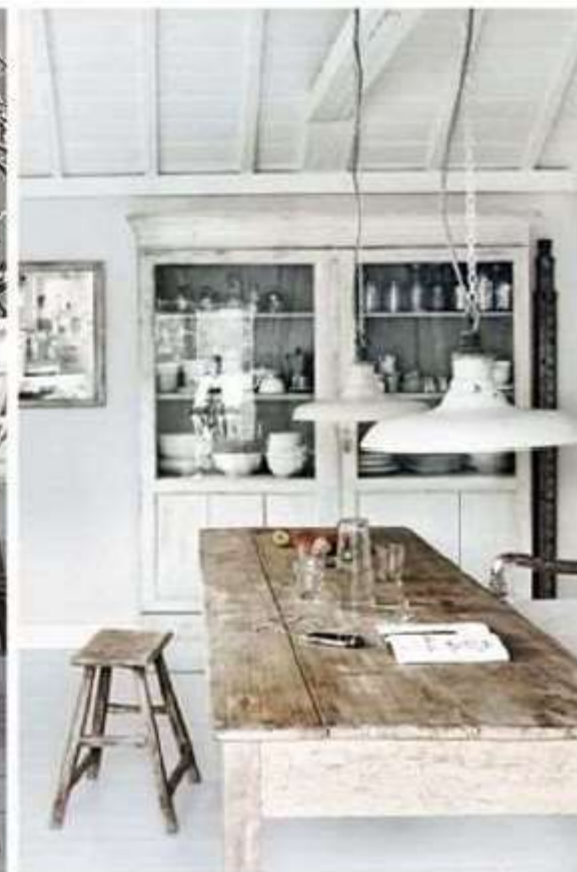
Naturaleza del material