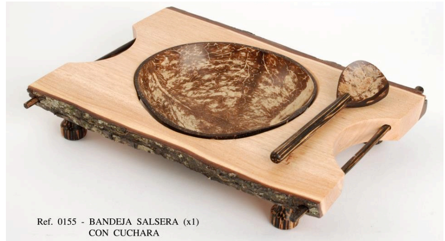
Ref. 0155 - BANDEJA SALSERA (x1) CON CUCHARA

Octavio Londoño (ebanistería – Trabajo en torno)