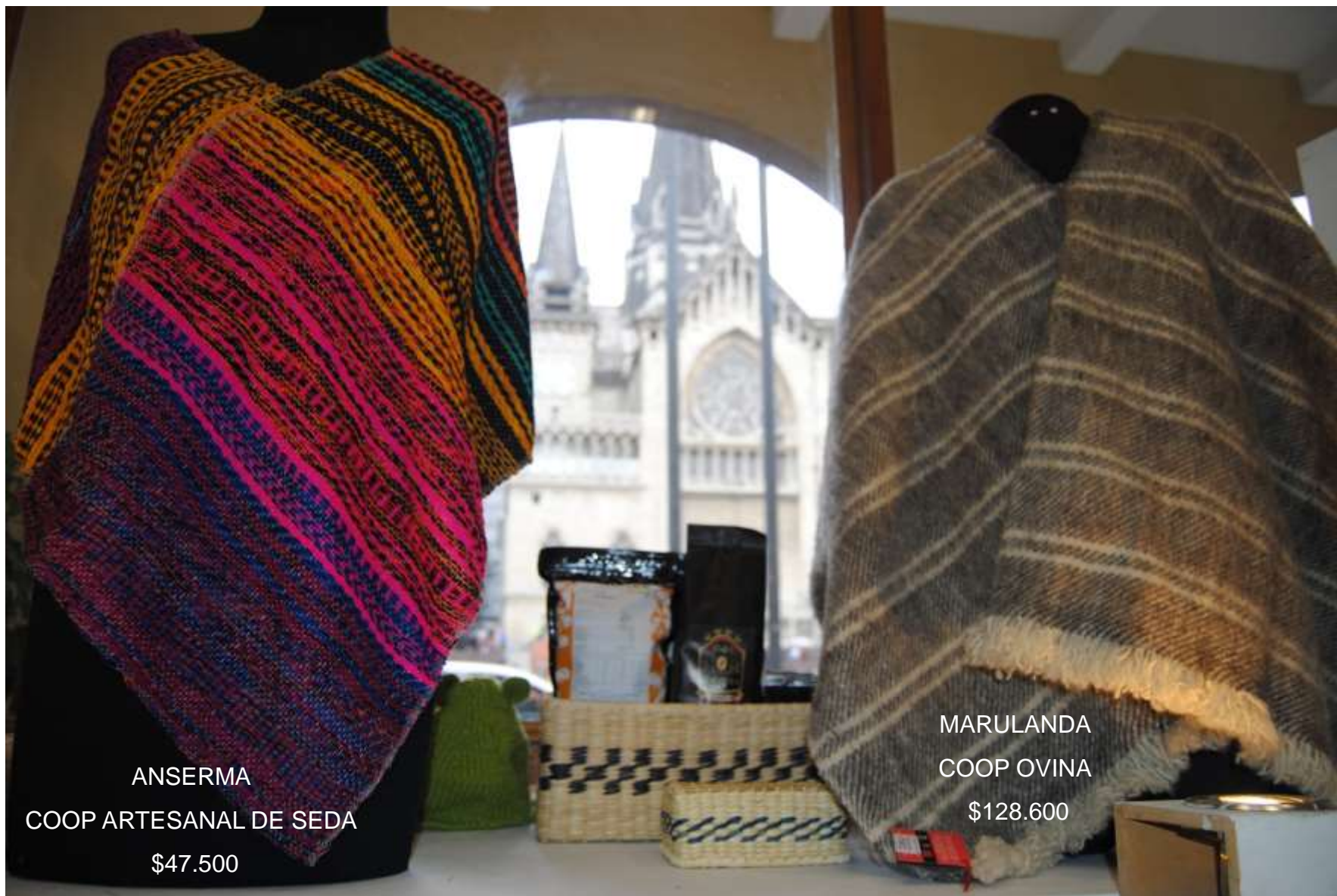
ANSERMA COOP ARTESANAL DE SEDA $47.500