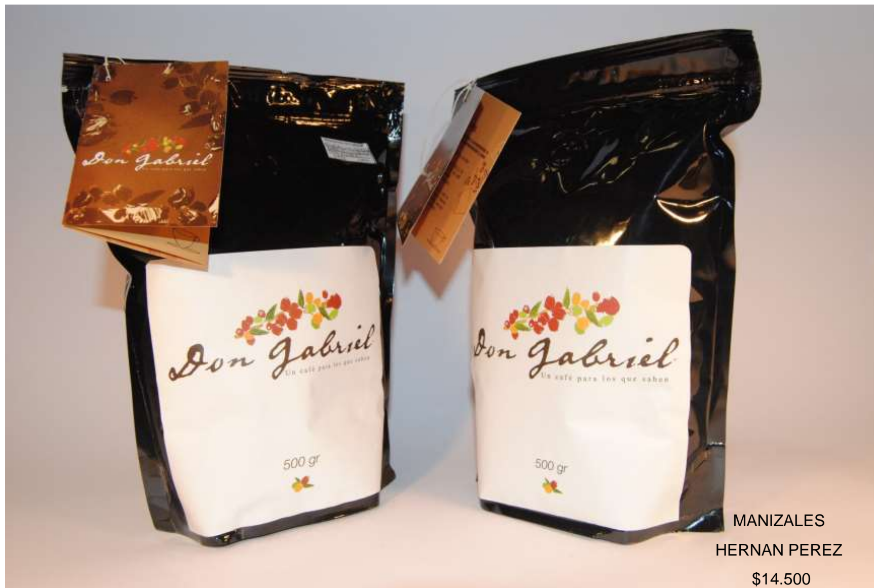
MANIZALES HERNAN PEREZ $14.500