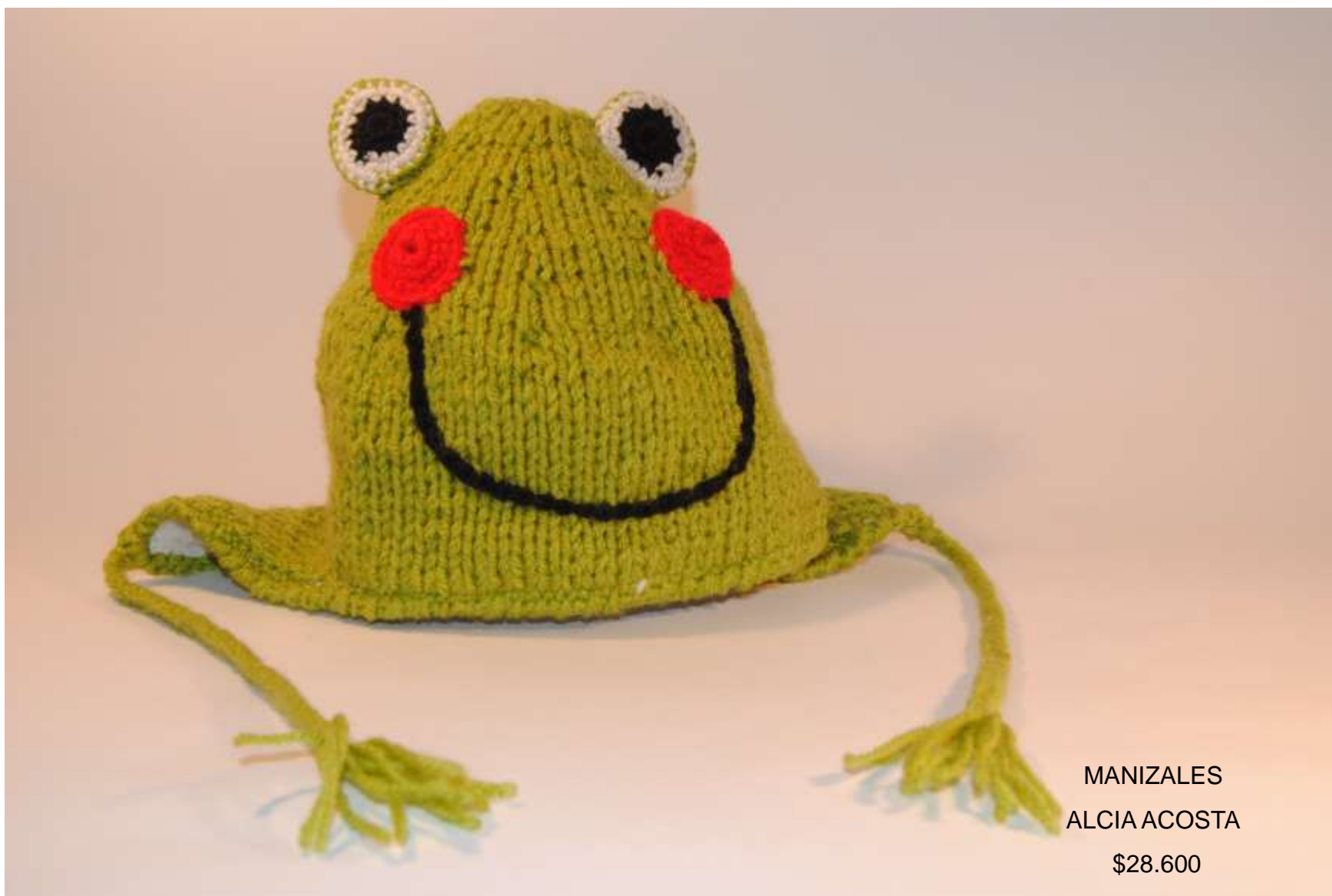
MANIZALES ALCIA ACOSTA $28.600