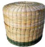
TEJEDURIA EN FIBRAS DURAS