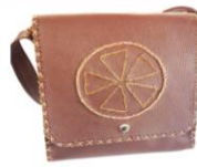
TRABAJO EN CUERO