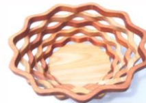
TRABAJO EN MADERA