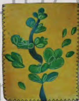
Bolso y estuche tablet Marroquinería