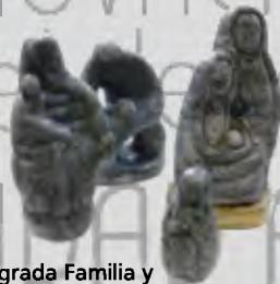
Escultura Sagrada Familia y jugando Talla en sal Ronni Edgar Mauricio Martínez