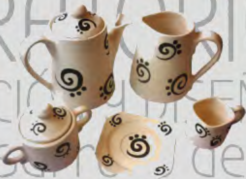
Vajilla café Cerámica vitrificada José Ignacio Pinilla