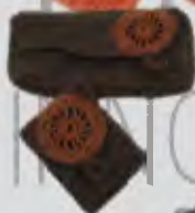
Bolso y accesorios Tejeduría Croché - hilo guajira Socorro Osuna