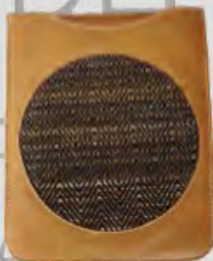
Textiles y marroquinería Lana de oveja e hilo Guajira Lilia Escobar de Rozo