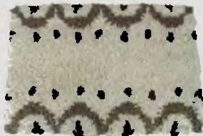
Tapete Tejeduría Lana de oveja