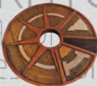
Portacalientes Ebanistería Fernando Guerrero V.