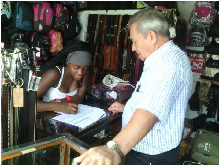
Foto 10. Fecha octubre 17 de 2014 Registro fotográfico Encuesta Institucional Municipio de Anserma - Caldas