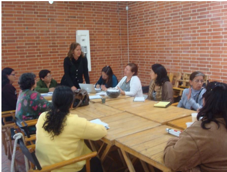
Proyecto “Fortalecimiento y desarrollo de la actividad artesanal en la ciudad de Bogotá. Primera fase”. Taller plan de negocio. Fecha: 22 de octubre de 2014. Lugar: Plaza de los artesanos.