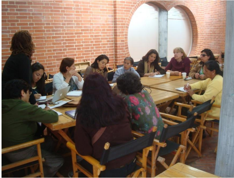
Proyecto “Fortalecimiento y desarrollo de la actividad artesanal en la ciudad de Bogotá. Primera fase”. Taller plan de negocio. Fecha: 22 de octubre de 2014. Lugar: Plaza de los artesanos, Fotografía: Daniela Alejandra Vera.