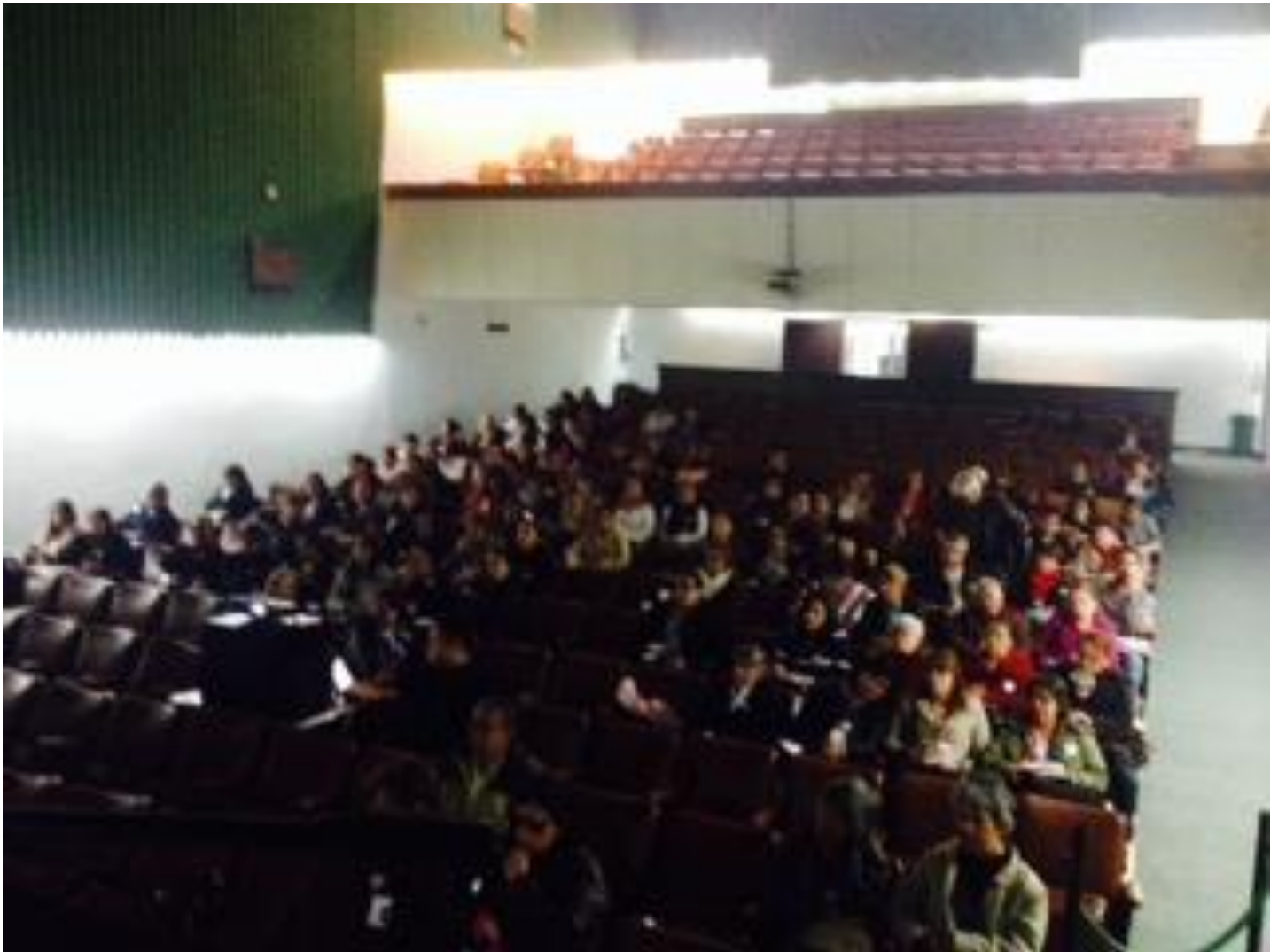
Proyecto “Fortalecimiento y desarrollo de la actividad artesanal en la ciudad de Bogotá. Primera fase”. Charla y taller sobre servicio al cliente. Fecha: 27 de octubre de 2014. Lugar: FENALCO.