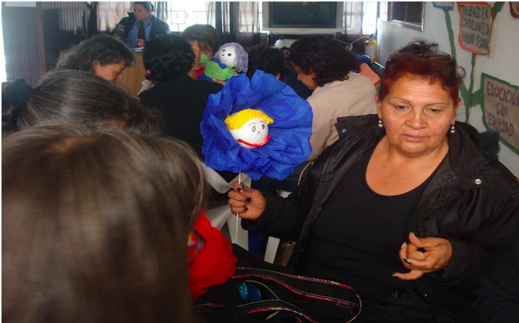
Proyecto "Fortalecimiento y Desarrollo de la Actividad Artesanal en la Ciudad de Bogotá" Talleres Servicio al Cliente – Costos – Plan de Negocio en la ciudad de Bogotá. Localidad de Suba Fecha: Noviembre 11 y 18 de 2014