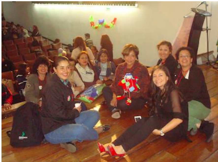
Proyecto “Fortalecimiento y Desarrollo de la Actividad Artesanal en la Ciudad de Bogotá” Talleres Servicio al Cliente – Costos – Plan de Negocio en la ciudad de Bogotá. FENALCO Fecha: Octubre 27 de 2014