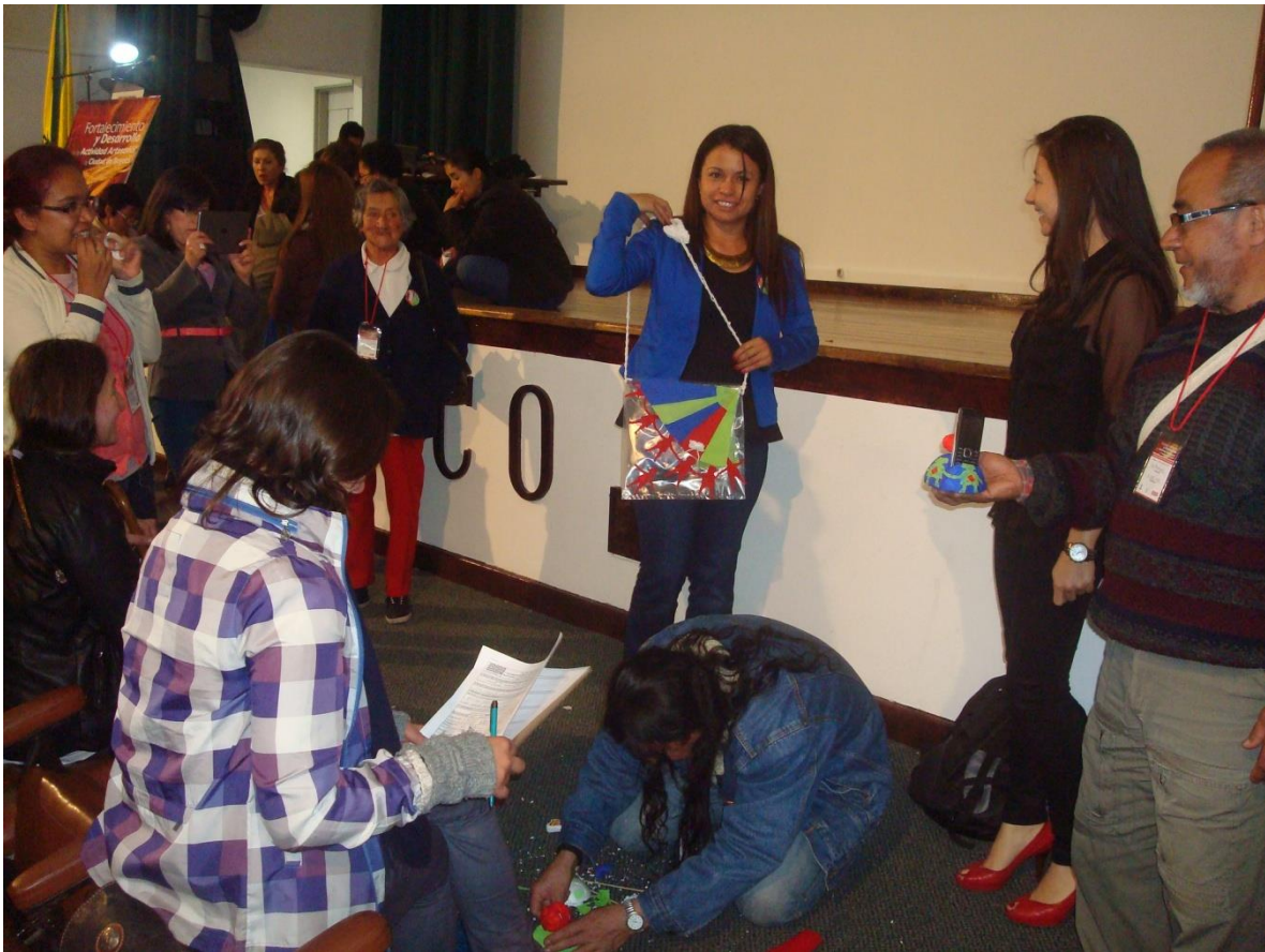
Proyecto “Fortalecimiento y desarrollo de la actividad artesanal en la ciudad de Bogotá. Primera fase”. Charla y taller sobre servicio al cliente. Fecha: 27 de octubre de 2014. Lugar: FENALCO.