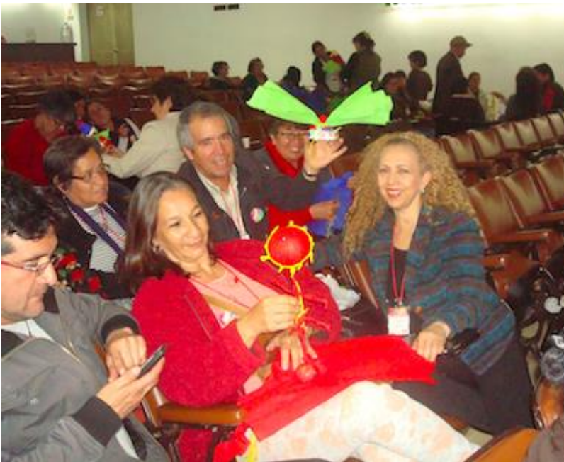
Proyecto “Fortalecimiento y Desarrollo de la Actividad Artesanal en la Ciudad de Bogotá” Talleres Servicio al Cliente – Costos – Plan de Negocio en la ciudad de Bogotá. FENALCO Fecha: Octubre 27 de 2014