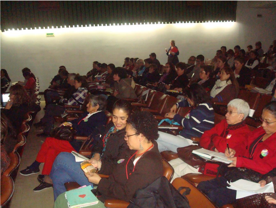
Proyecto “Fortalecimiento y desarrollo de la actividad artesanal en la ciudad de Bogotá. Primera fase”. Charla y taller sobre servicio al cliente. Fecha: 27 de octubre de 2014. Lugar: FENALCO.