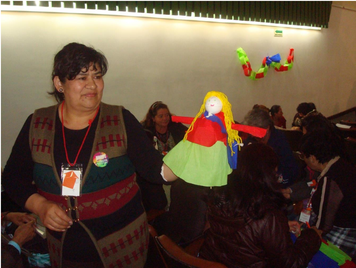
Proyecto “Fortalecimiento y desarrollo de la actividad artesanal en la ciudad de Bogotá. Primera fase”. Charla y taller sobre servicio al cliente. Fecha: 27 de octubre de 2014. Lugar: FENALCO.