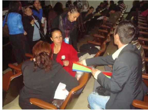
Proyecto “Fortalecimiento y desarrollo de la actividad artesanal en la ciudad de Bogotá. Primera fase”. Charla y taller sobre servicio al cliente. Fecha: 27 de octubre de 2014. Lugar: FENALCO.