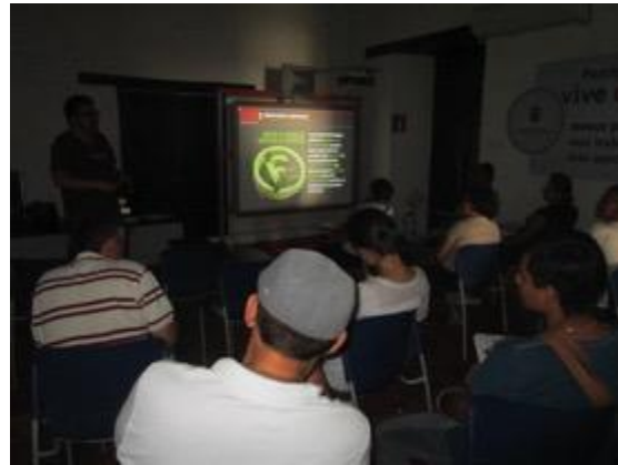
Conferencia imagen grafica corporativa, asistentes y asesor, Fotos Juan Mario Ortiz.