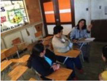
asistentes y asesor, Fotos Juan Mario Ortiz.

25 septiembre 2:00 pm, lugar: Segundo piso Banco Agrario, sientos las 2:30 pm no hay asistencia de beneficiarios, no hay (video beam) esperamos que nos presten uno, 3 pm asisten 3 personas, se les brinda la información sobre el proyecto, llenamos asistencia y se cancela la actividad por falta de asistencia.