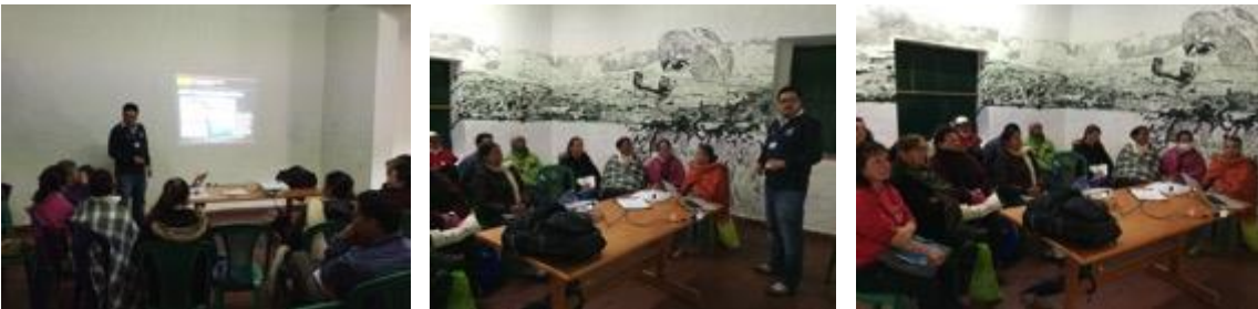
Conferencia imagen grafica corporativa, asistentes y asesor.

9 octubre 9:00 am, lugar: casa de la cultura, se llega al municipio 30 minutos tarde por cierres en la vía, arranca la actividad sin mayores contratiempos, los artesanos se muestran interesados en la asesoría puntual pues están organizando una asociación de artesanos en el municipio, asisten 13 beneficiarios 11 mujeres 2 hombres, después de consultar con la unión temporal el deseo de que el municipio participe en la siguiente actividad se llega a la decisión de tenerlos en cuenta.