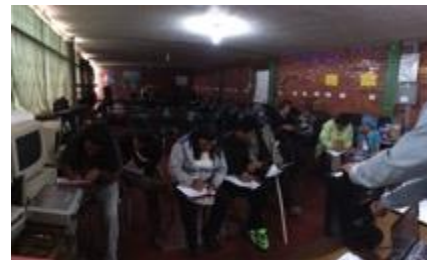
Conferencia imagen grafica corporativa, asistentes y asesor, Fotos Juan Mario Ortiz.