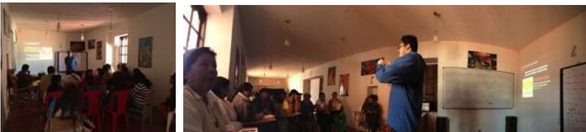
Conferencia imagen grafica corporativa, asistentes y asesor, Fotos Juan Mario Ortiz.

25 septiembre 8:00 am, lugar: Casa de la cultura, llegan 3 personas puntuales, la actividad empieza 60 minutos tarde mientras esperamos mayor quórum, asisten 20 beneficiados, 1 hombres y 19 mujeres, se recoge material gráfico con el fin de regresar a la asesoría directa.