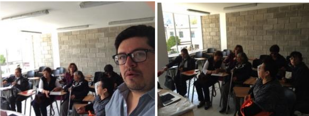
Conferencia imagen grafica corporativa, asistentes y asesor, Fotos Juan Mario Ortiz.

Miércoles 25 marzo de 2015, salón asignado en el laboratorio de Cundinamarca sede Sopo, salones Policarpa, la reunión y charla empieza a las 9 am mientras llega la gente se hace una espera de 30 minutos, arranca la charla con 14 beneficiarios, 3 hombres, 10 mujeres, la charla se dicta sin contratiempos, en este municipio se encuentra con un grupo muy interesado y avanzado en los temas gráficos, se procede a hacer algunas asesorías directas cortas con los interesados, se les comunica sobre el beneficio del registro de marca y algunos logran hacer el trámite para dicho proceso.