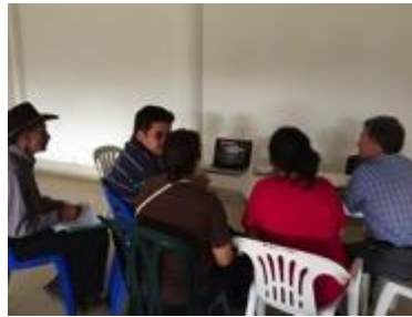
Conferencia imagen grafica corporativa, asistentes y asesor, Fotos Juan Mario Ortiz.