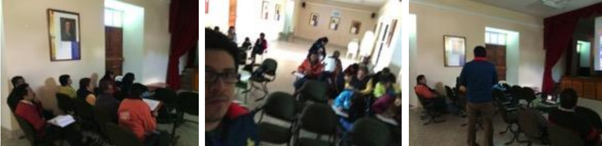
Conferencia imagen grafica corporativa, asistentes y asesor

16 septiembre 8:00 am, lugar: auditorio municipal Policarpa Salavarrieta, la actividad empieza a tiempo asisten 15 beneficiados, 9 hombres y 6 mujeres, se recoge material gráfico con el fin de regresar a la asesoría directa.