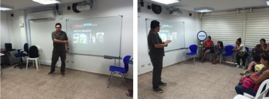
Conferencia imagen grafica corporativa, asistentes y asesor, Fotos Juan Mario Ortiz.

contratiempos, la encargada del municipio y algunas artesanas dejan claro la intención de seguir en el proyecto y en el gran interés por que ADC llegue y haga mayor impacto en la comunidad artesanal.