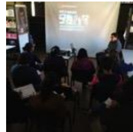
Conferencia imagen grafica corporativa, asistentes y asesor, Fotos Juan Mario Ortiz.