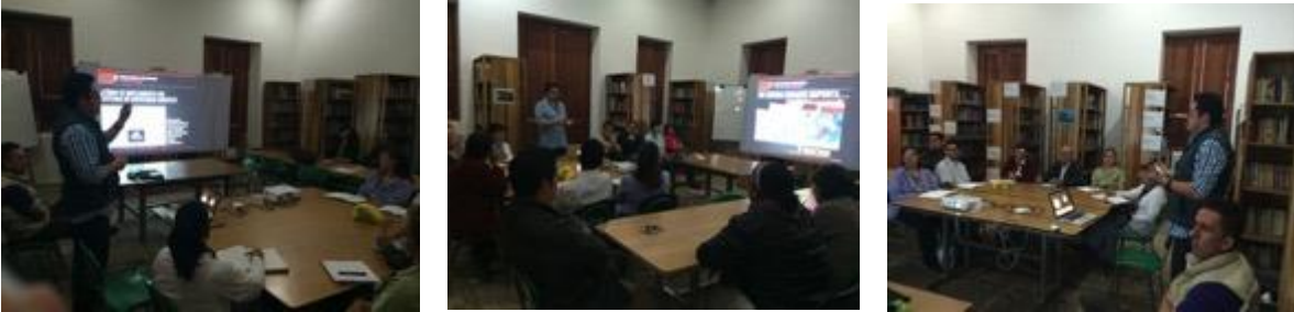
Conferencia imagen grafica corporativa, asistentes y asesor, Fotos Juan Mario Ortiz.

23 septiembre 8:00 am, lugar: Biblioteca municipal, llegan 6 personas puntuales, la actividad empieza 60 minutos tarde mientras esperamos mayor quórum, al parecer la mayoría de personas dicen que la actividad la programaron a las 9 (por eso esperamos una hora) asisten 15 beneficiados, 5 hombres y 10 mujeres, se recoge material gráfico con el fin de regresar a la asesoría directa.