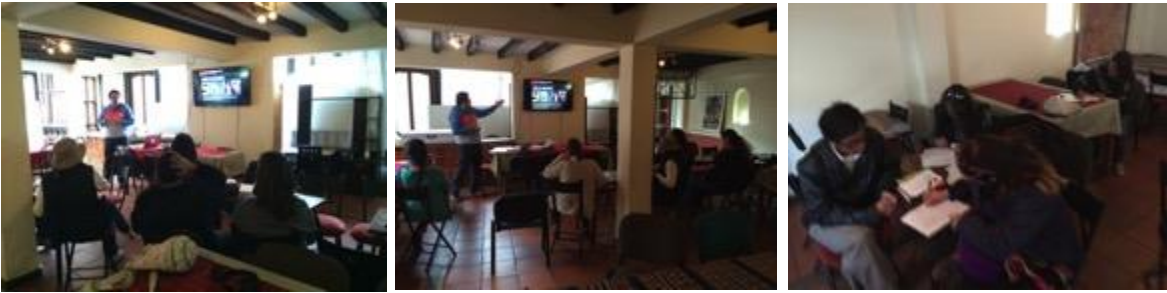
Conferencia imagen grafica corporativa, asistentes y asesor, Fotos Juan Mario Ortiz.