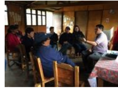
Conferencia imagen grafica corporativa, asistentes y asesor, Fotos Juan Mario Ortiz.