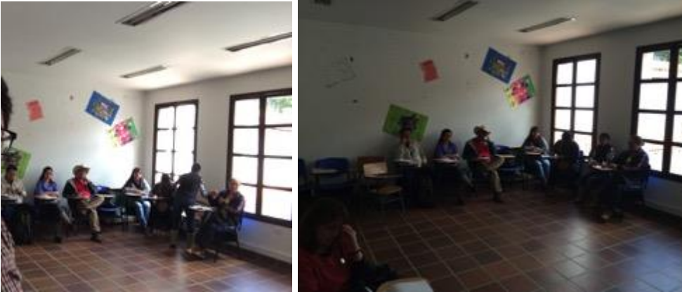
Conferencia imagen grafica corporativa, asistentes y asesor, Fotos Juan Mario Ortiz.

asesorías directas cortas con algunos, se les comunica sobre el beneficio del registro de marca, los artesanos en general muestran su interés por seguir con los talleres dictados por ADC .