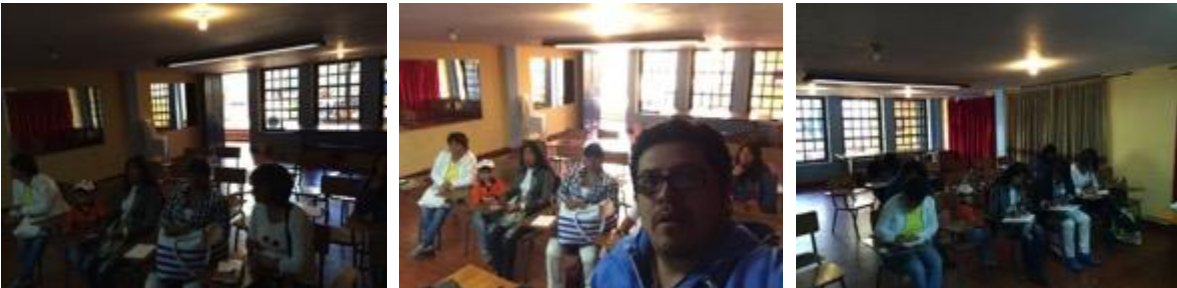
Conferencia imagen grafica corporativa, asistentes y asesor, Fotos Juan Mario Ortiz.

24 septiembre 8:00 am, lugar: salón 1 casa cultura, La reunión esta programad para las 9 am llegamos puntuales pero solo hay una persona el representante de la alcaldía no se hace presente con los materiales solicitados (proyector) esperamos 40 minutos mientras hay quórum, comienza la capacitación con 8 artesanos beneficiados.