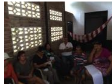
Conferencia imagen grafica corporativa, asistentes y asesor, Fotos Juan Mario Ortiz.