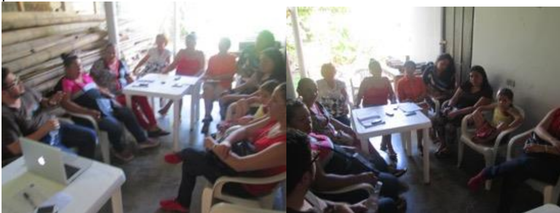
Conferencia imagen grafica corporativa, asistentes y asesor, Fotos Juan Mario Ortiz.

Lunes 13 de abril del 2015, Local A Artepaz (asociación artesanos de la Paz), la reunión y charla empieza a las 9:30 am, media hora después mientras los artesanos terminan de llegar, comienza la actividad con 9 beneficiarios, 0 hombres, 9 mujeres, la charla se dicta sin contratiempos, se procede a hacer algunas asesorías directas cortas con algunos, se les comunica sobre el beneficio del registro de marca, los artesanos en general muestran su interés por seguir con los talleres dictados por ADC y piden que sean encuestados y tenidos en cuenta para futuras visitas.