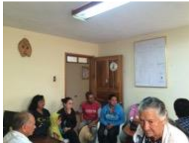
Primera foto 19 de marzo, las dos fotos siguientes son de conferencia imagen grafica corporativa, asistentes y asesor, Fotos Juan Mario Ortiz.

Jueves 24 de marzo 2105 salón vive digital 10 am, Se llega al lugar para empezar la reunión, pasan 1 hora y no llega n mas de 3 personas, se decide pasarnos a una oficina de la alcaldía pues el salón estaba cerrado y la persona encargada no llego, la reunión y charla empieza a las 11:30am con 7 beneficiarios, 2 hombres, 5 mujeres, la charla se dicta sin contratiempos.