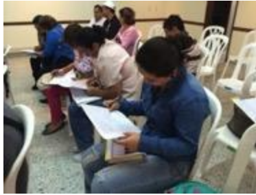
Conferencia imagen grafica corporativa,

asistentes y asesor, Fotos Juan Mario Ortiz