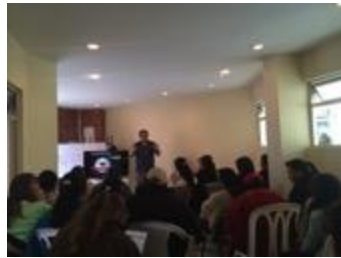
Conferencia imagen grafica corporativa, asistentes y asesor, Fotos Juan Mario Ortiz.