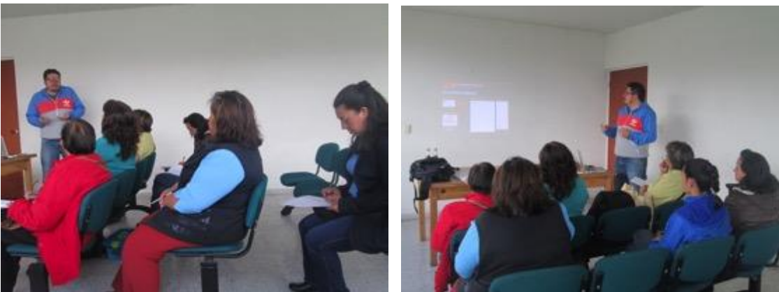
Conferencia imagen grafica corporativa, asistentes y asesor, Fotos Juan Mario Ortiz.

Martes 7 de abril del 2015, Oficina de desarrollo económico, la reunión y charla empieza a las 10 am una hora después mientras los artesano terminan de llegar, arranca con 9 beneficiarios, 1 hombres, 8 mujeres, la charla se dicta sin contratiempos, en este municipio se encuentra con un grupo muy interesado, se procede a hacer algunas asesorías directas cortas con algunos, se les comunica sobre el beneficio del registro de marca, los artesanos en general muestran su interés por seguir con los talleres dictados por ADC , la persona encargada demuestra que hay dos municipios cercanos que están interesados en el proyecto en los cuales hay buena cantidad de artesanos, se procede a tomar los datos de estos municipios y queda pendiente el contacto con ellos para futuras visitas.