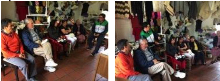
Conferencia imagen grafica corporativa, asistentes y asesor, Fotos Juan Mario Ortiz.

18 y 22 de septiembre 9:00 am, lugar: almacén de la Asociación de artesanos, la actividad esta programada para las 9 am llegan 1 persona, esperamos una hora para hacer quórum, nos comentan que la mayoría de artesanos están en Zipaquirá en una feria de emprendimiento de la cámara de comercio, se establece contacto directo con artesanos llegando hasta Zipaquirá se logra establecer un a nueva cita para el lunes 22 de septiembre a las 2 pm, se cancela la actividad del 18 por falta de beneficiarios y se aplaza para el 22. El 22 se llega a tiempo se empieza una hora tarde mientras llegan los artesanos, llegan 5 y comienza la capacitación sin mayores contratiempos.