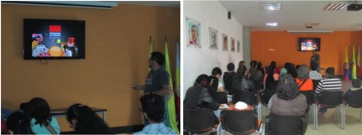
Conferencia imagen grafica corporativa, asistentes y asesor, Fotos Juan Mario Ortiz.

hombres, 15 mujeres, la charla se dicta sin contratiempos, en este municipio se encuentra con un grupo muy interesado, se procede a hacer algunas asesorías directas cortas con algunos, se les comunica sobre el beneficio del registro de marca, los artesanos en general muestran su interés por seguir con los talleres dictados por ADC y piden que sean encuestados y tenidos en cuenta para futuras visitas, el municipio parece tener potencial y gran poder de convocatoria y asistencia.