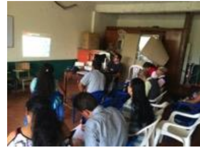
Conferencia imagen grafica corporativa, asistentes y asesor