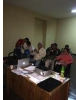
Conferencia imagen grafica corporativa, asistentes y asesor, Fotos Juan Mario Ortiz.