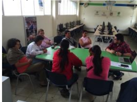
Conferencia imagen grafica corporativa, asistentes y asesor, Fotos Juan Mario Ortiz.