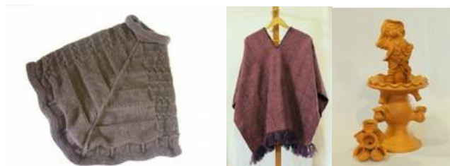
17 Presentación de los productos a evaluar por parte de las artesanas. (Ubaté. Septiembre a Octubre/2014. Proyecto: “Fomento a la actividad productiva artesanal del Departamento de Cundinamarca”. Operador: Nexus – Gestando. Artesanías de Colombia S.A.)

tienen buenos criterios de calidad, usabilidad y vida útil, que se reflejan en sus productos. La forma de trabajo apreciada en la asociación asarvu es desarticulada, opera más como un centro de acopio y comercialización. Cada artesana desarrolla sus propios productos y luego estos son recolectados por la representante legal y comercializados en los eventos a los que se inscriben como asociación, tal como expoartesanías. Por lo que se hace necesario el apoyo en metodologías de trabajo conjunto que fortalezcan el producto y les ayuden a construir una identidad y una marca.