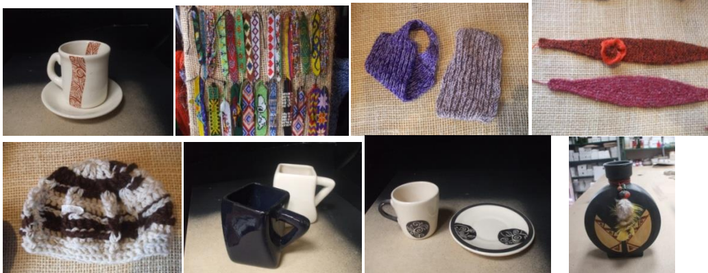
9 Algunos productos evaluados (Guatavita. Septiembre 15/2014. Proyecto: “Fomento a la actividad productiva artesanal del Departamento de Cundinamarca”. Operador: Nexus – Gestando. Artesanías de Colombia)