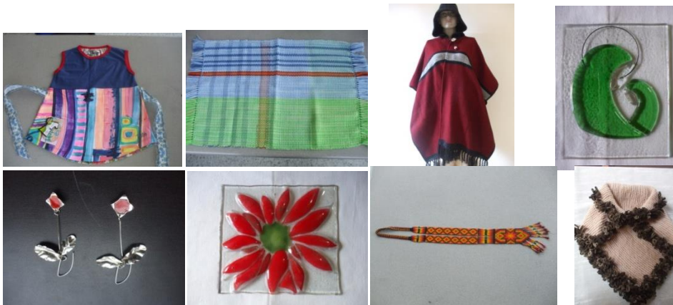
10 Algunos productos evaluados (La Calera. Septiembre 12/2014. Proyecto: “Fomento a la actividad productiva artesanal del Departamento de Cundinamarca”. Operador: Nexus – Gestando. Artesanías de Colombia)