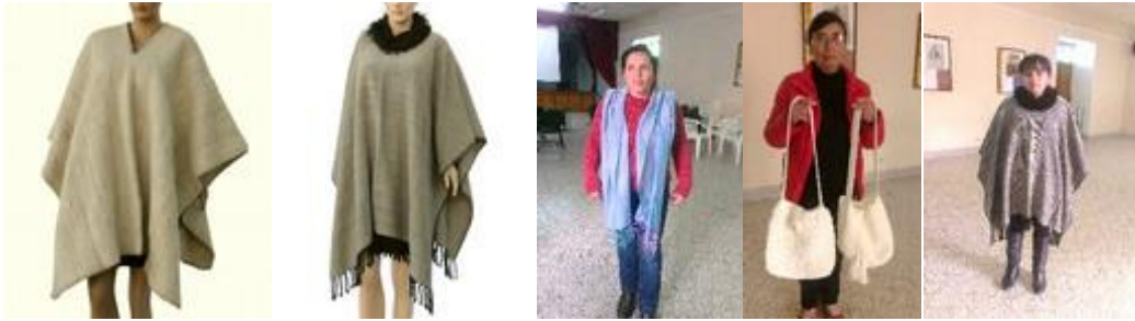
5 Presentación de los productos a evaluar por parte de las artesanas. (Cucunubá. Septiembre a Noviembre/2014. Proyecto: “Fomento a la actividad productiva artesanal del Departamento de Cundinamarca”. Operador: Nexus – Gestando