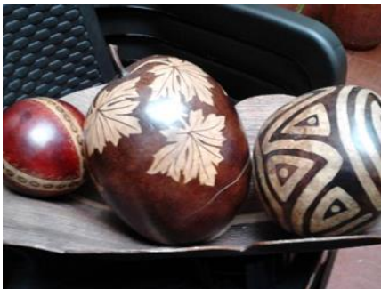
11 LA MESA, Septiembre de 2014 Foto: Nicolás Vergara – Fomento de la actividad productiva artesanal en Cundinamarca –UT Nexus Gestando, Artesanías de Colombia.

El amero y el estropajo son dos técnicas de resaltar por su representación en dos artesanas de calidad.