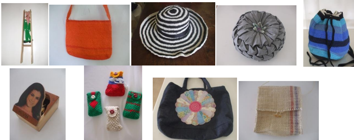
8 Algunos productos evaluados (Gachetá. Septiembre 18/2014. Proyecto: “Fomento a la actividad productiva artesanal del Departamento de Cundinamarca”. Operador: Nexus – Gestando. Artesanías de Colombia)