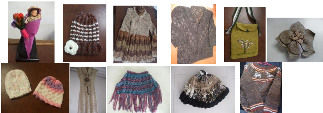
13 Algunos productos evaluados (Sopó Septiembre 9/2014. Proyecto: “Fomento a la actividad productiva artesanal del Departamento de Cundinamarca”. Operador: Nexus – Gestando. Artesanías de Colombia)