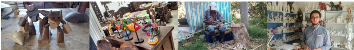
12 Silvania: Septiembre-2014. Artesanías de Silvania. Proyecto: “Fomento a la actividad productiva artesanal del Departamento de Cundinamarca”. Operador: Nexus – Gestando. Artesanías de Colombia.

Se evaluaron 15 de las 15 unidades productivas proyectadas por Artesanías de Colombia para este municipio. Identificación de fortalezas y debilidades tanto en producto como en unidad productiva. Los beneficiarios de este municipio están segmentados en dos grandes grupos, aquellos que se dedican al tejido de fibras naturales como el mimbre y la calceta de plátano; han introducido dentro de sus materiales el “mimbre sintético”. Por otro lado se encuentran un grupo mixto entre los cuales se encuentran oficios como la ebanistería, la talabartería, cerámica y artes manuales. Es relevante anotar que se encontró carencia en la propuesta de diseño a partir de referentes propios de la zona, se trata en su mayoría del resultado de la imitación de los ya existentes en el mercado.