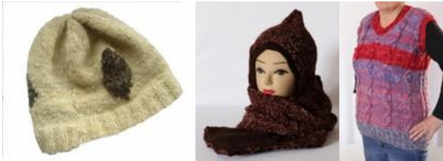
15 Presentación de los productos a evaluar por parte de las artesanas. (Tausa. Septiembre a Octubre/2014. Proyecto: “Fomento a la actividad productiva artesanal del Departamento de Cundinamarca”. Operador: Nexus – Gestando.