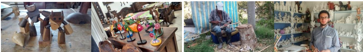
Sylvania: Septiembre-2014. Artesanías de Sylvania. Proyecto: “Fomento a la actividad productiva artesanal del Departamento de Cundinamarca”. Operador: Nexus – Gestando. Artesanías de Colombia.

Se evaluaron 15 de las 15 unidades productivas proyectadas por Artesanías de Colombia para este municipio. Identificación de fortalezas y debilidades tanto en producto como en unidad productiva. Los beneficiarios de este municipio están segmentados en dos grandes grupos, aquellos que se dedican al tejido de fibras naturales como el mimbres y la calceta de plátano; han introducido dentro de sus materiales el “mimbres sintético”. Por otro lado se encuentran un grupo mixto entre los cuales se encuentran oficios como la ebanistería, la talabartería, cerámica y artes manuales. Es relevante anotar que se encontró carencia en la propuesta de diseño a partir de referentes propios de la zona, se trata en su mayoría del resultado de la imitación de los ya existentes en el mercado.