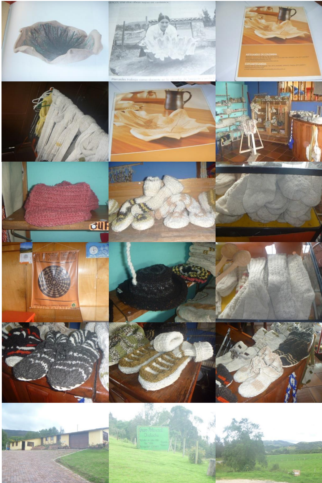
Ilustración 1 Evaluación de la Unidad Productiva (Sesquilé y Vereda Chaleche, 24 de septiembre 2014.) Proyecto "Fomento de la actividad productiva artesanal en el departamento de Cundinamarca" Operador: Nexus-Gestando. Artesanías de Colombia.