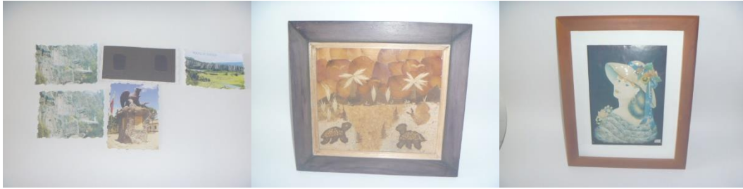
Ilustración 1 Evaluación de la Unidad Productiva (Suesca Casa de la Cultura, 19 de septiembre 2014.) Proyecto "Fomento de la actividad productiva artesanal en el departamento de Cundinamarca" Operador: Nexus-Gestando. Artesanías de Colombia.