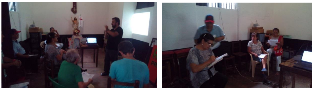
*Foto: Centro artesanal Tocaima. Fotos tomadas por Alexander Flórez P. 2014