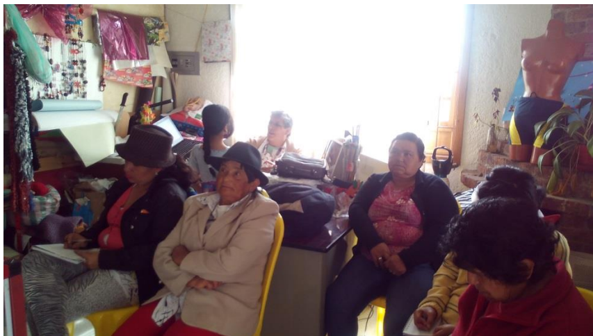
*Foto: Casa Elsa Beatriz Sánchez. Simijaca. Fotos tomadas por Alexander Flórez P. 2014