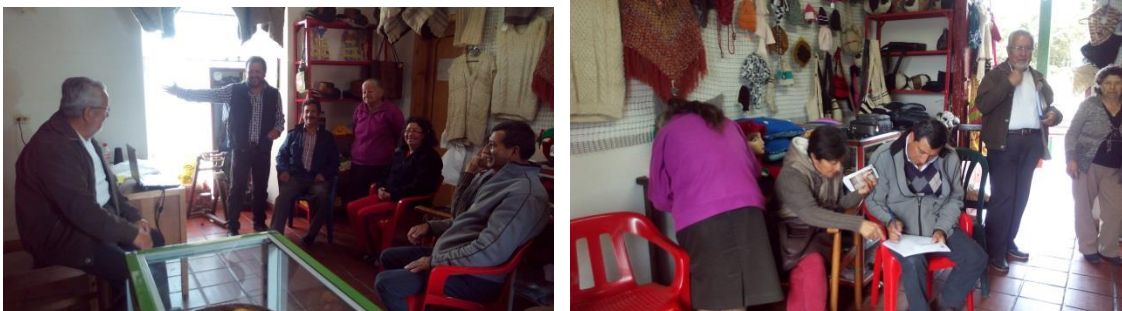
*Foto: Aprotocoarco. Cogua. Fotos tomadas por Alexander Flórez P. 2014