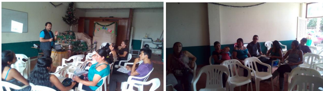
*Foto: Salón Kennedy, Silvania. Fotos tomadas por Alexander Flórez P. 2014