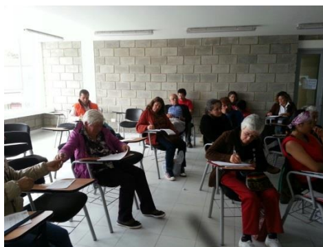
*Foto: Antiguo Colegio Policarpa Salabarieta Sopo. Fotos tomadas por Diego Carrillo. 2015