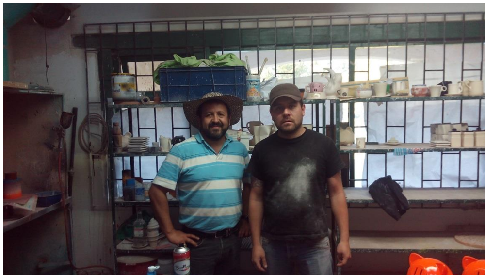
*Foto: Centro artesanal Guatavita. Fotos tomadas por Alexander Flórez P. 2014