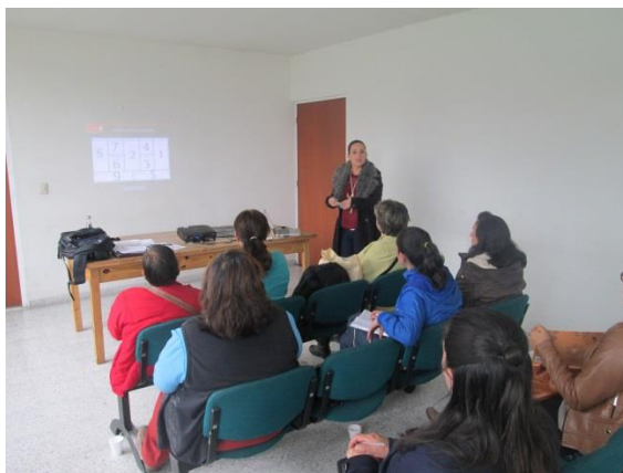
*Foto: Oficina desarrollo económico Facatativa. Fotos tomadas por Juan Mario Ortiz. 2015