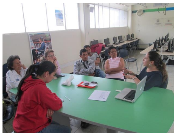
*Foto: Punto vive digital – Alcaldía Guayabal de Síquima. Fotos tomadas por Juan Mario Ortiz. 2015