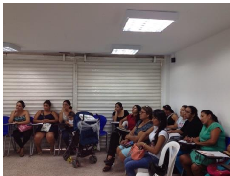
*Foto: Punto vive digital Ricaurte. Fotos tomadas por María Fernanda Carvajal. 2015

Sopó – Cundinamarca: 27 de Marzo del 2015