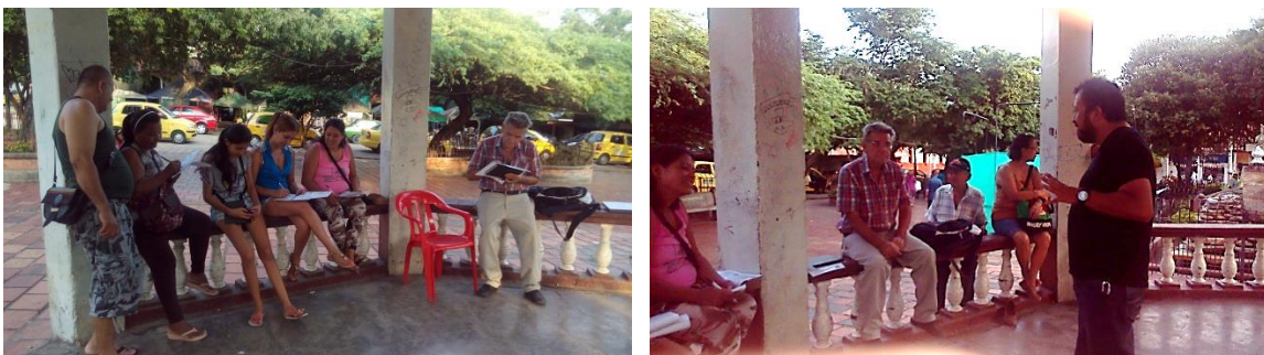
*Foto: Parque principal Agua de Dios. Fotos tomadas por Alexander Flórez P. 2014